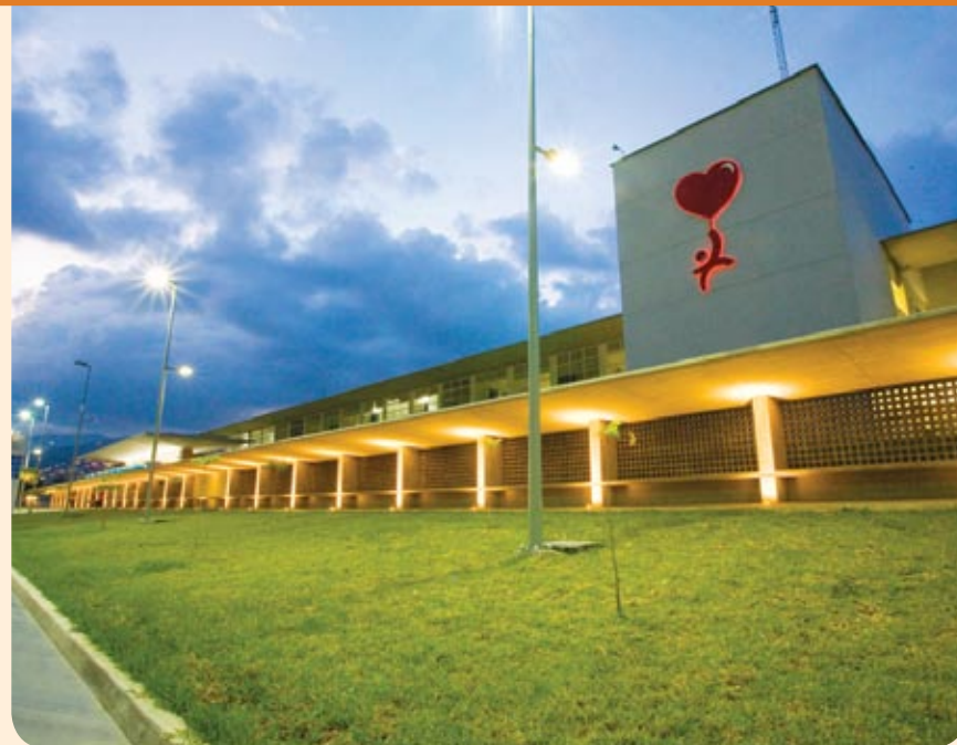
Hospital Cardiológico Infantil Dr. Gilberto Rodríguez Ochoa