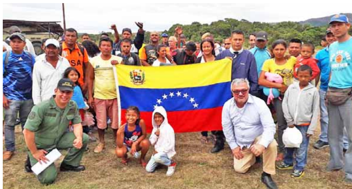
Connacionales expresaron que fueron víctimas de xenofobia y maltrato

Este operativo fue coordinado y realizado de manera conjunta por la Cancillería de la República Bolivariana de Venezuela, la Fuerza Armada