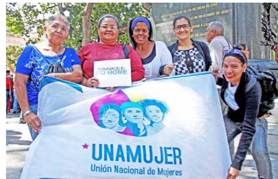
Los movimientos sociales se unen a lucha contra el imperialismo