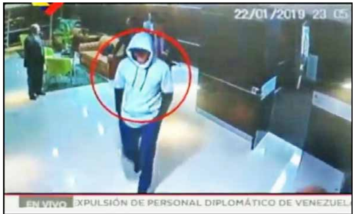
Diputado Guaidó entrando al Hotel Lido

Por otra parte, Rodríguez sostuvo que Guaidó aseguró en esa reunión que él “no sería presidente de nada” y que iba a promover el diálogo entre el Gobierno y la oposición.