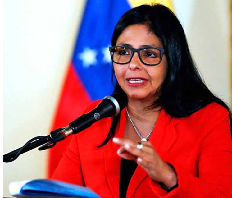
La vicepresidenta agradeció el respaldo de China

La vicepresidenta sentenció que “todo el petróleo que necesita