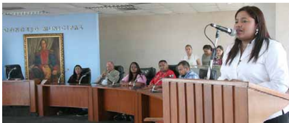
Ediles afirmaron que Maracaibo ahora forma parte de la revolución