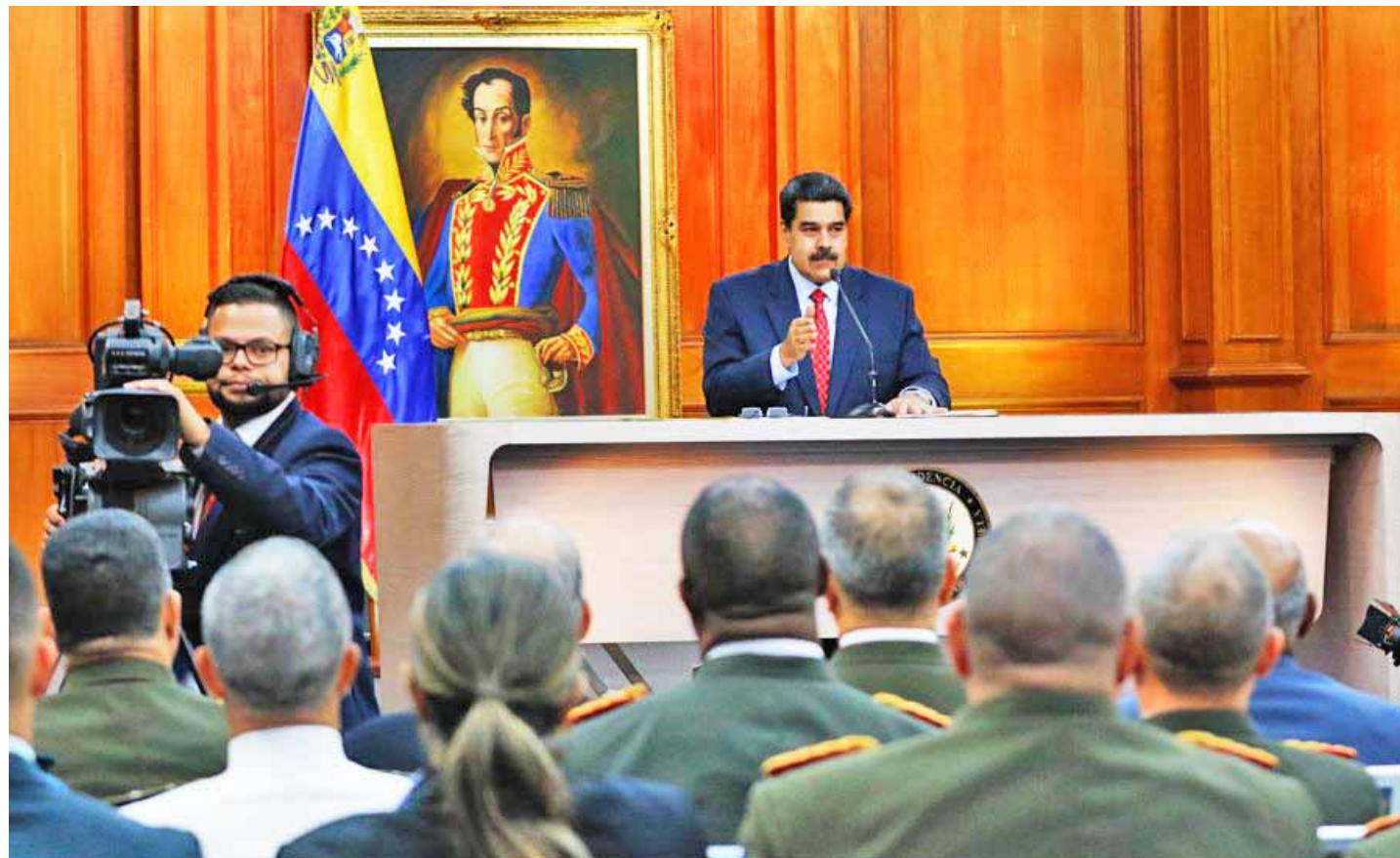
El Mandatario aseveró que el país no será gobernado por la guarimba

El Jefe de Estado indicó que Citgo es propiedad de Petróleos de Venezuela (Pdvsa) y es propiedad del Estado y pueblo venezolano