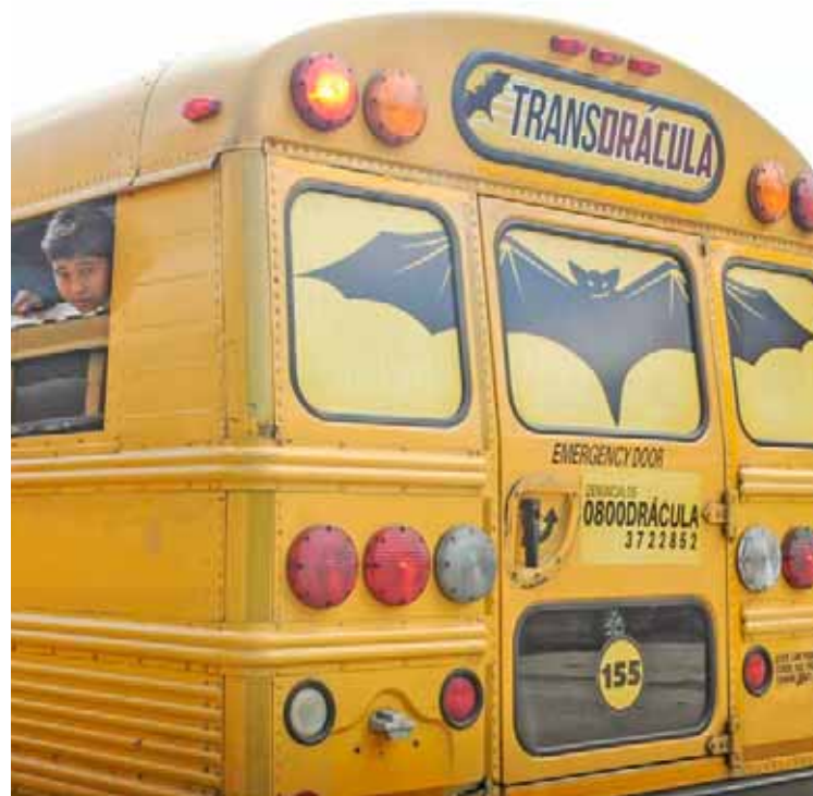
El dirigente aseveró que continuarán las mejoras en Carabobo

El vocero consideró que la deficiencia en el suministro de agua potable resultaba un drama en Valencia y Puerto