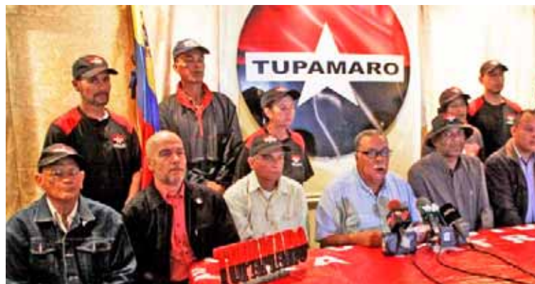
El MRT hizo un llamado para conformar las brigadas antiimperialistas e internacionalistas