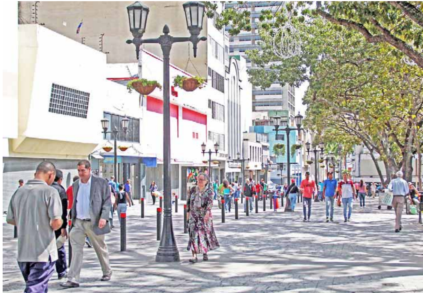
Consultados destacan el apego a la paz del caraqueño

Durante un sondeo de opinión realizado por el Correo del Orinoco , los consultados rechazaron los ataques contra Venezuela auspiciados por los Estados Unidos, y llamaron a promover la paz y la unidad del pueblo