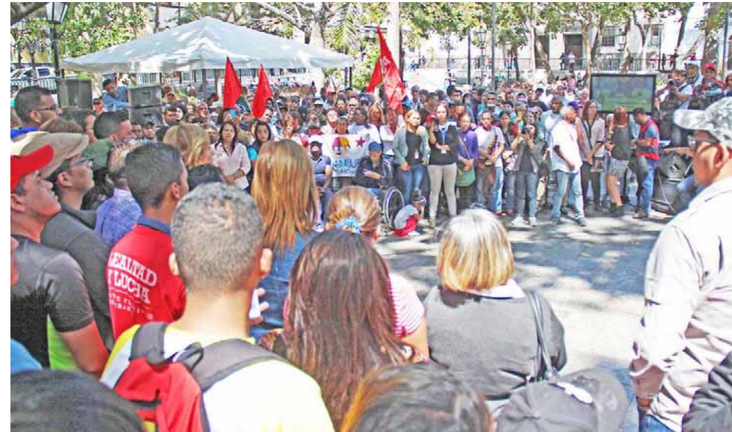
La unidad es el arma principal del pueblo revolucionario