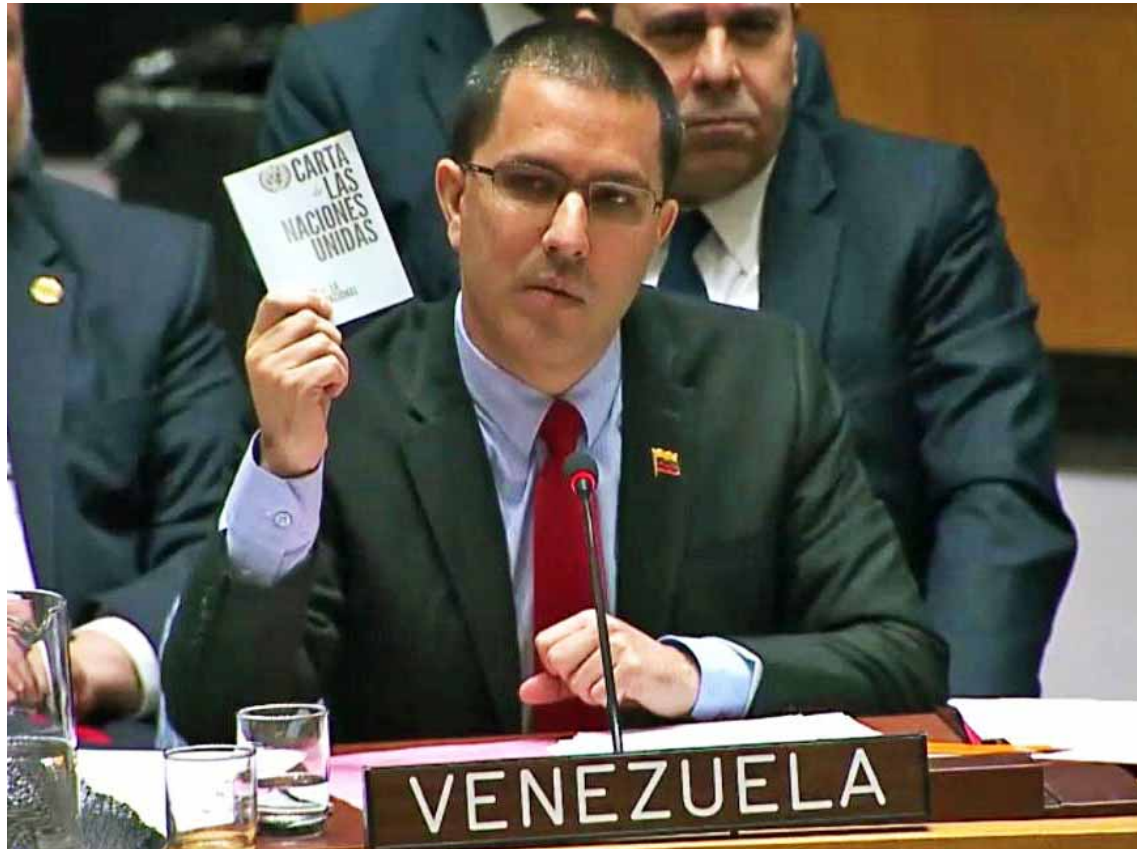
Ministro Arreaza en reunión de Naciones Unidas

Durante su intervención en Nueva York, donde se convocó una reunión del Consejo de Seguridad que buscaba dar apoyo pleno a la Asamblea Nacional y al diputado Juan Guaidó, solicitada por Estados Unidos, el canciller sentenció que no podrán derrocar al presidente