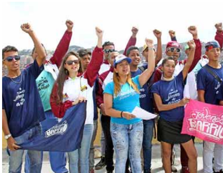
La oposición busca “un enfrentamiento del pueblo contra el pueblo”, alertó Peña

Sostuvo que hay “unos pequeños focos, los jóvenes de los barrios estamos con el presidente Nicolás Maduro”. Señaló que la oposición ha obstaculizado al Gobierno revolucionario el desarrollo pleno de las políticas sociales, “hemos estado en una permanente defensiva, en esta oportunidad estamos en una ofensiva y vamos con todo”, añadió.