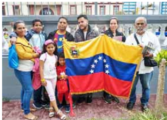
Vuelo desde Perú