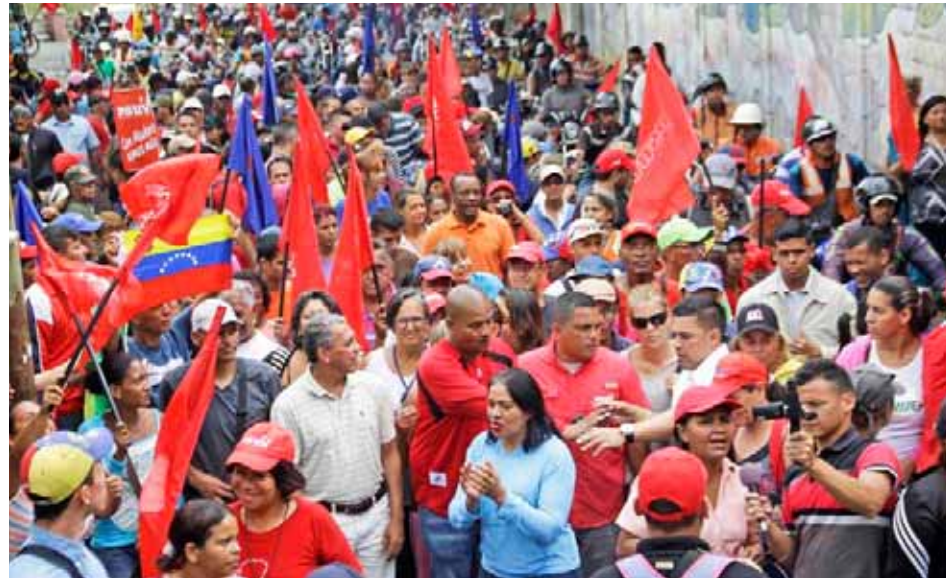
Luego de realizar un cabildo popular vecinos de La Pastora marcharon hasta el Palacio de Miraflores

Con una marcha desde la parroquia San Francisco de Yare, hasta el lugar donde fue atacado por acciones vandálicas el monumento en homenaje a los Diablos Danzantes de Yare, el pueblo del estado Miranda manifestó su repudio a estos actos que atentaron contra los monumentos y patrimonios culturales, y en Caracas los pastoreños marcharon hacia Miraflores en rechazo a estos ataques contra los íconos culturales.