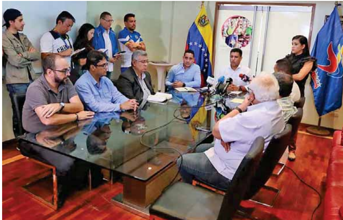
Ministro Infante aseguró que la Serie del Caribe 2019 se mantiene en Barquisimeto

Durante una reunión con el comité organizador de la Serie del Caribe Barquisimeto 2019, en el Instituto Nacional de Deporte (IND), en Caracas; el ministro Infante señaló que se revisaron los avances logísticos y los escenarios para