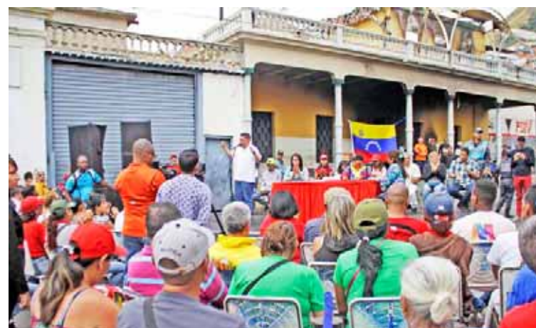
Vecinos de La Pastora en cabildo abierto popular repudiaron actos vandálicos