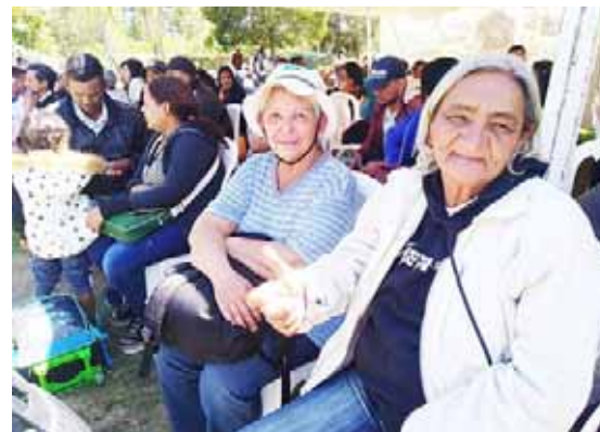
Venezolanos regresaron de Quito