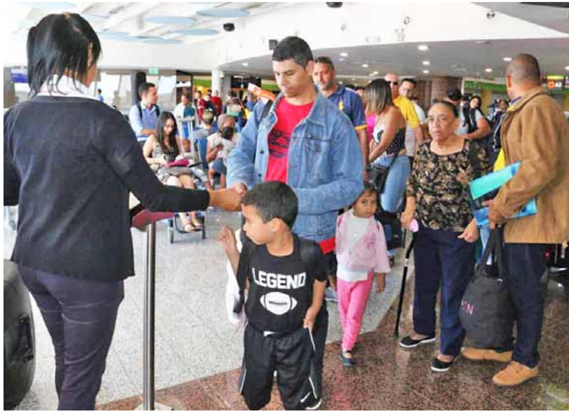
Aeropuerto de Santo Domingo

Mientras tanto, como parte de los esfuerzos de protección social a los compatriotas migrantes, el Gobierno Bolivariano activó ayer el tercer vuelo del Plan Vuelta a la Patria, capítulo República Dominicana, con el objetivo de contribuir con el retorno de 91 compatriotas que decidie-