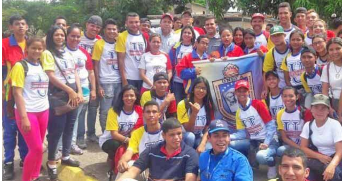
Dirigentes estudiantiles del estado Bolívar expresaron su apoyo al presidente Maduro

Desde la sede del Eje Geopolítico Kerepakupai Vena (UBV-Bolívar), los dirigentes estudiantiles, rechazaron las pretensiones de la oposición venezolana de hacerse del poder político a través de la