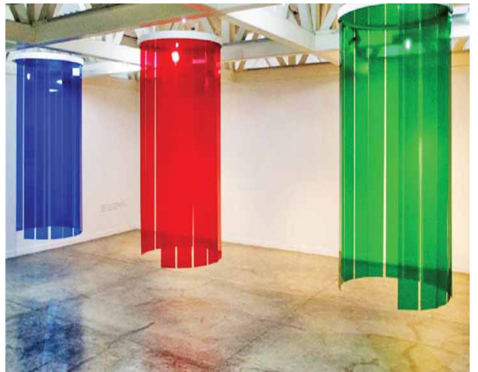
El Museo Cruz-Diez posee el ambiente artificial compuesto por tres cámaras de color

Este ambiente puede actuar como detonante, activando en el espectador la noción del color en tanto que la situación material, física, sucede en el espacio sin la ayuda de la forma, e incluso sin soporte alguno, independientemente de las convenciones culturales.