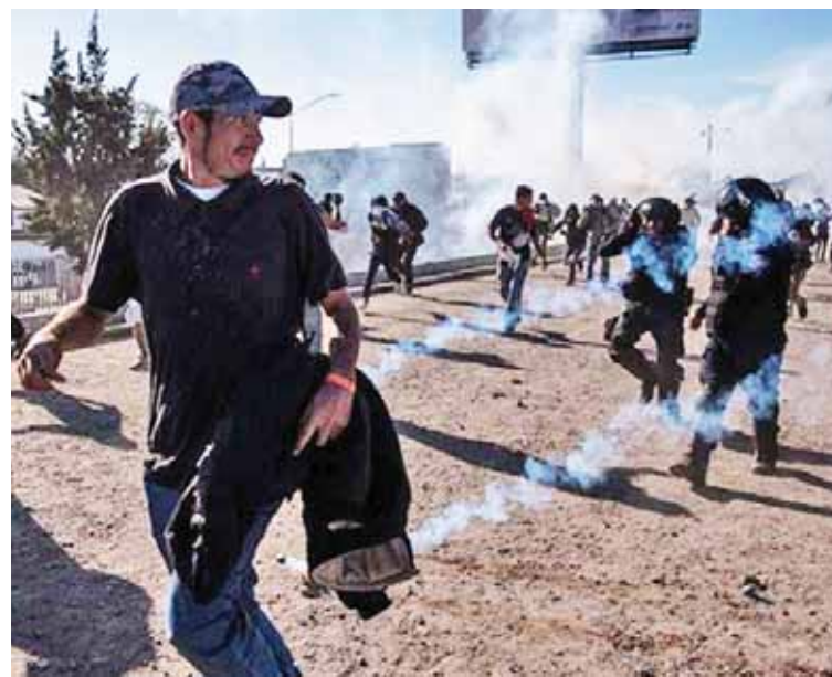
Represión estadounidense contra migrantes el pasado 1º de enero

México “lamentó que se registre cualquier tipo de actos violentos en la frontera” y “reiteró su compromiso para salvaguardar los derechos humanos y la seguridad de todas las personas migrantes”, indica el comunicado. Estos migrantes forman parte de una