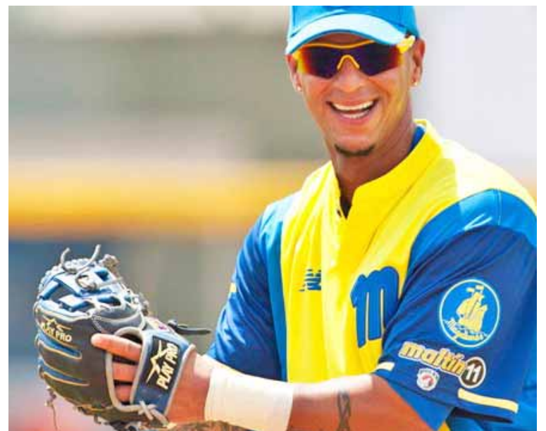
Cedeño fue Novato de la 2005-06 en nuestra pelota rentada

El infielder, que se tituló con los Navegantes en la temporada 2013-2014, en calidad de refuerzo: “Esta meta se la dedico a mi nana, a mis padres, que siempre me cuidaron, me educaron y están conmigo; pero, especialmente a mis hijos, que me dan esas ganas de seguir luchando, de venir todos los días al estadio a entrenar”.