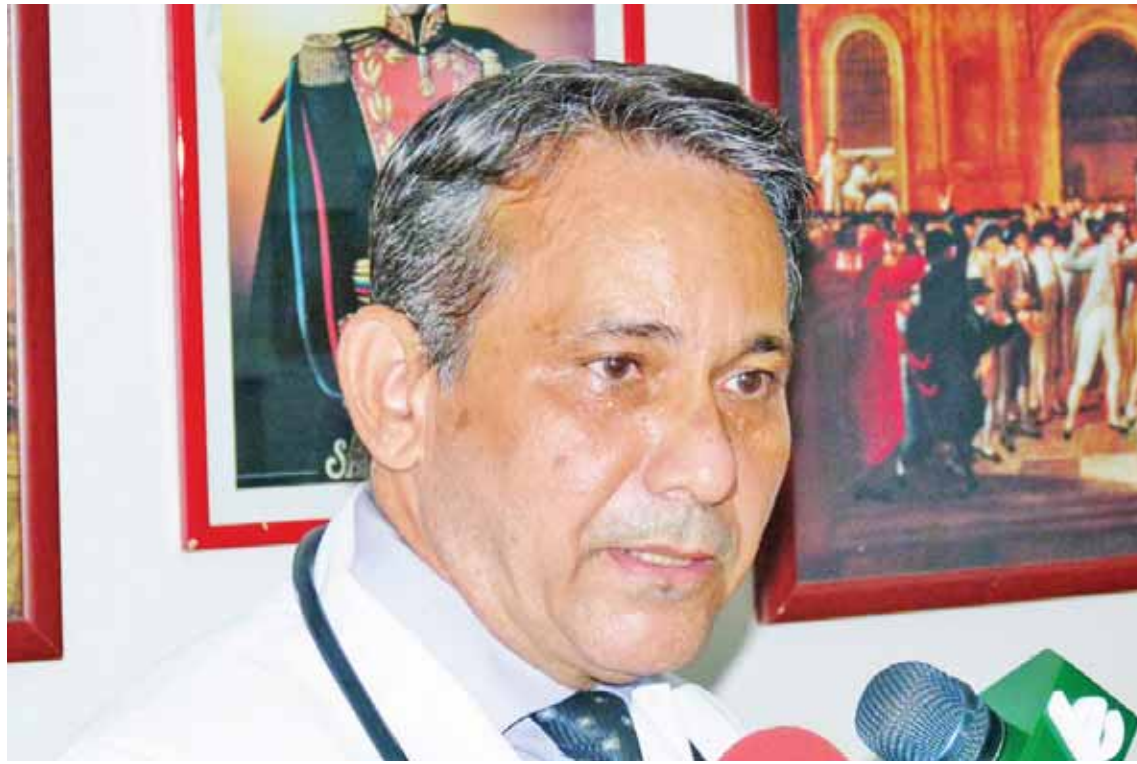
Araujo: "Mi sueño es tener un hospital limpio, pintado y funcional"

Aunque no precisó el monto del presupuesto asignado, Araujo aclaró que les dará el mejor uso a pesar de los problemas económicos que hay en el país.