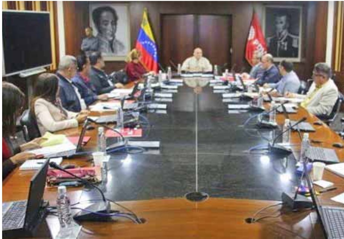
Venezuela asume presidencia de la OPEP en 2019

En un tuit, señaló: “En la 1ra. reunión del Comité Directivo de Pdvsa trazamos estrategias para aumentar la producción petrolera, fortalecer nuestro talento humano y profundizar nuestras relaciones con socios nacionales y extranjeros ¡Con la orientación del presidente Nicolás Maduro potenciaremos la industria!”.