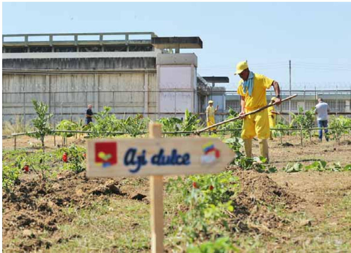
Ministerio del Servicio Penitenciario impulsa planes productivos desde los centros de reclusión