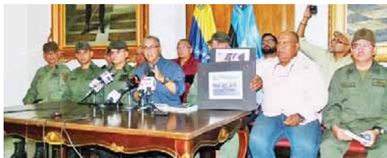
Cabello señaló que no permitirán guarimbas este martes 10