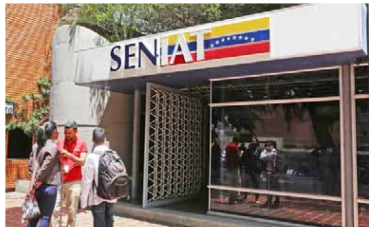
Los recursos serán invertidos en planes de desarrollo de la nación, señaló Cabello

En materia de Impuesto al Valor Agregado (IVA), sostuvo