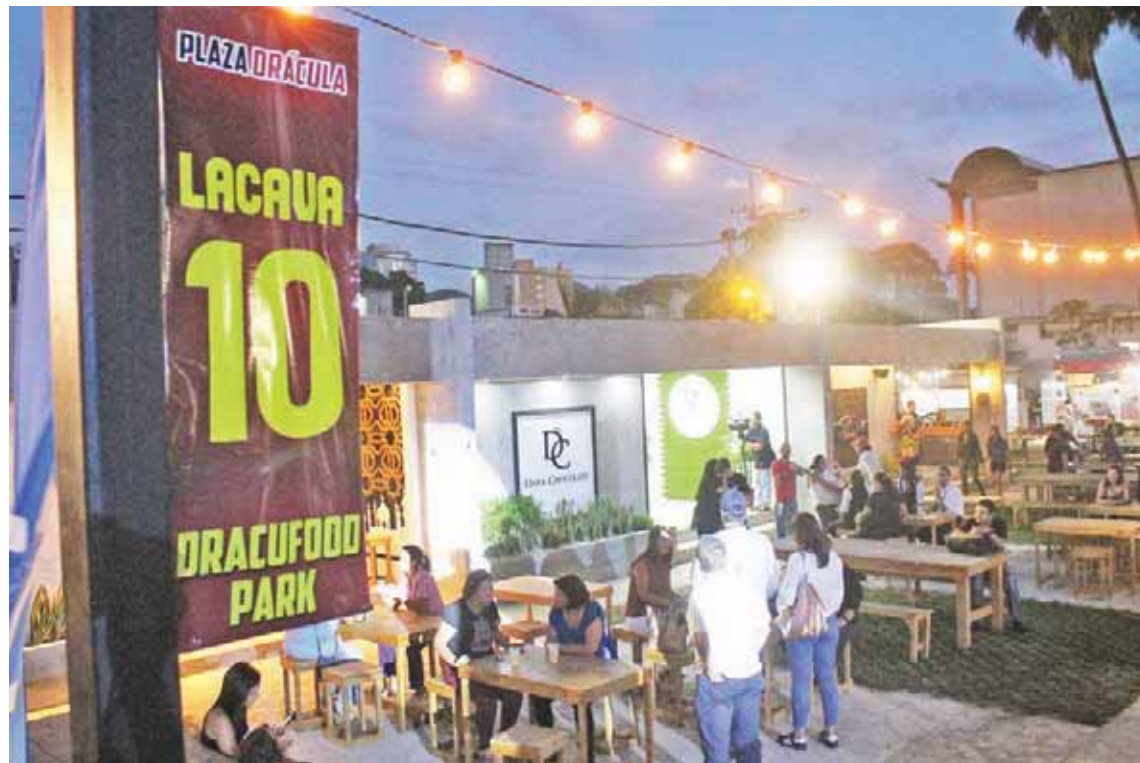
Los jóvenes llaman al espacio la "plaza Dracula"