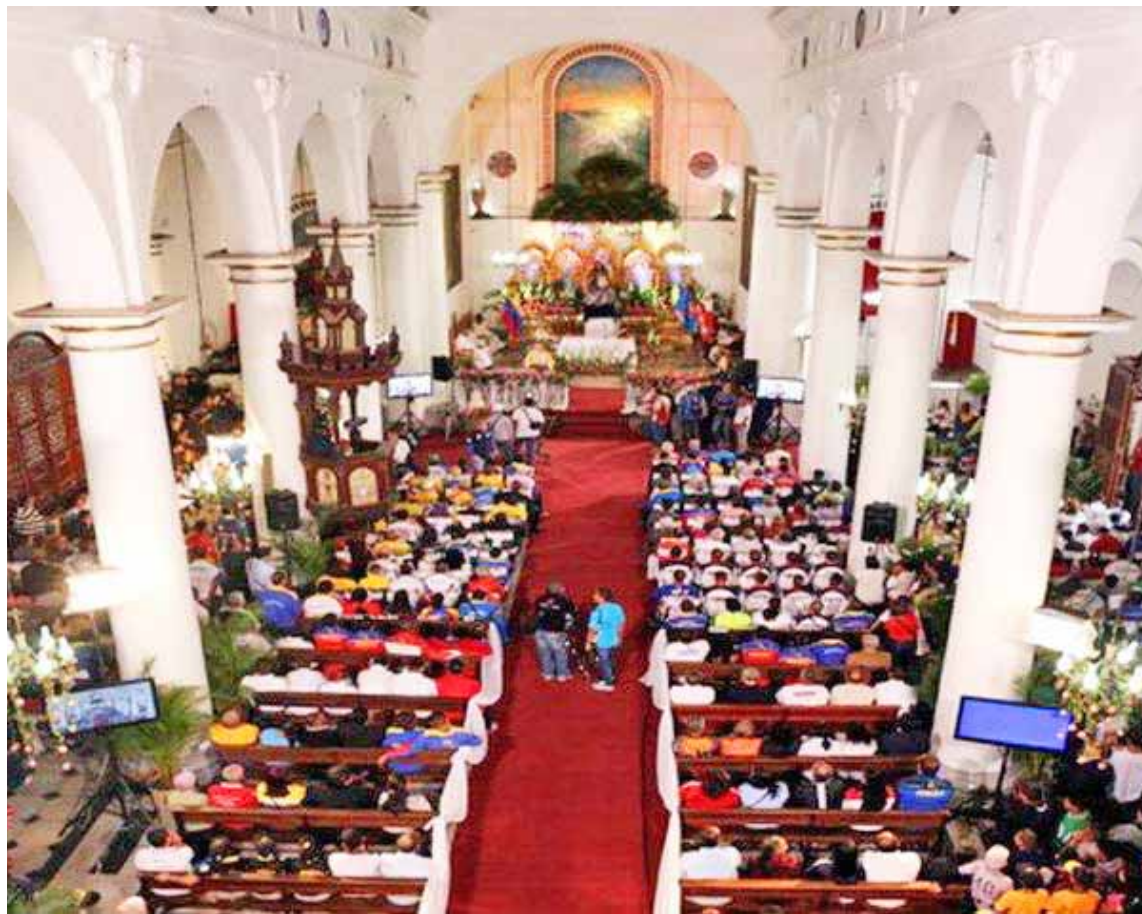
Son 73 años de tradición religiosa-deportiva

Dirigentes, entrenadores, atletas, funcionarios y amantes en general de la actividad deportiva se reúnen cada año en un acto litúrgico que se instauró en 1945, cuando el párroco de La Pasto-