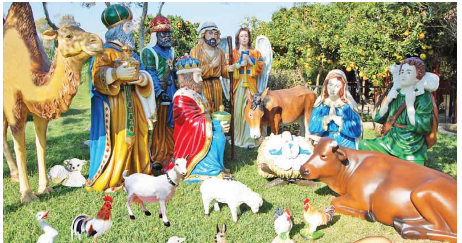
Con títeres y parranda los niños disfrutarán la Bajada de los Reyes Magos en el Eje del Buen Vivir

La festividad de los Tres Reyes Magos, o la epifanía del señor, que se celebra el 6 de enero está asociada a la escena del nacimiento del Niño Jesús y a la visita que hicieron estos per-