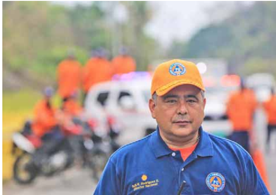
Viceministro Rodríguez llamó a la calma y a reportar cualquier daño a través del 0800-PCIVIL1

A través de un contacto telefónico con el canal Globovisión, Rodríguez informó que la noche del 6 de enero se registró en el estado Carabobo un sismo de magnitud 3,7, registrado cerca de las 10:00 de la noche con profundidad de 3,6 km y epicentro a 12 km al noroeste de Valencia.