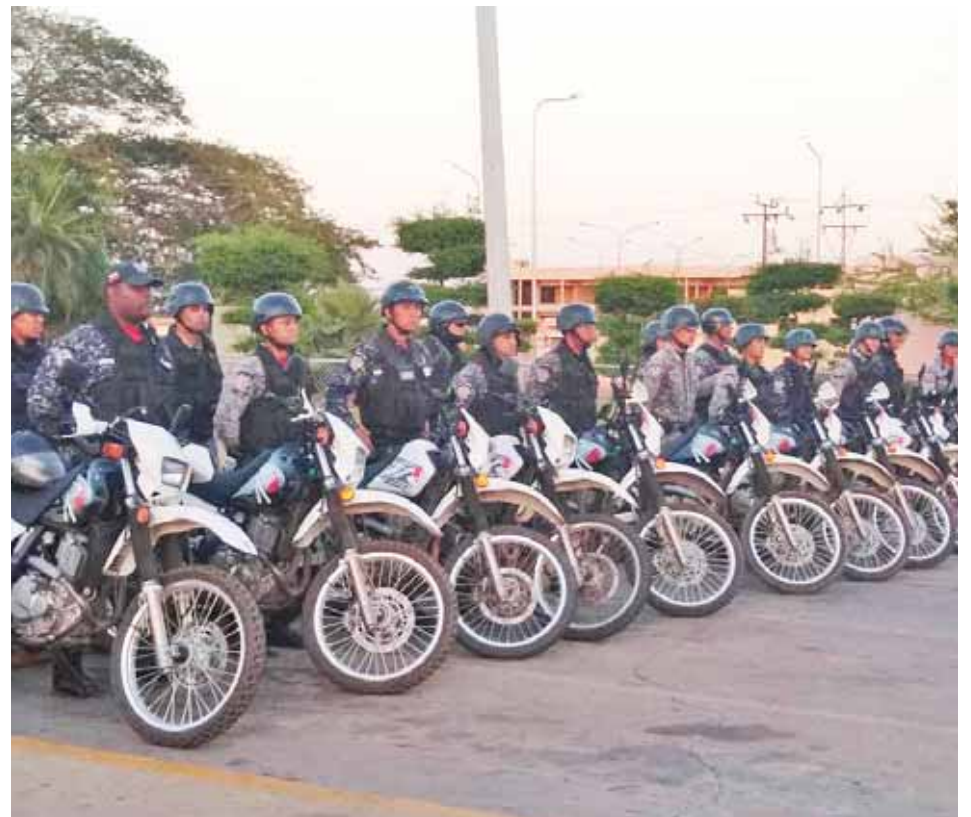
Autoridades continúan trabajando en la disminución del delito