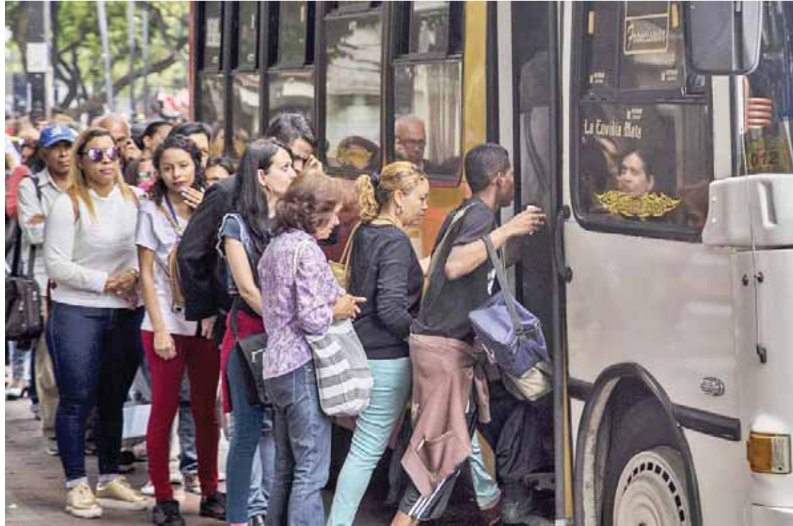
Este año se prevé el financiamiento para repotenciar unidades de transporte

Por ejemplo, se han llevado adelante inspecciones en las rutas de transporte público masivo interurbanas, urbanas, suburbanas y en las de taxis.