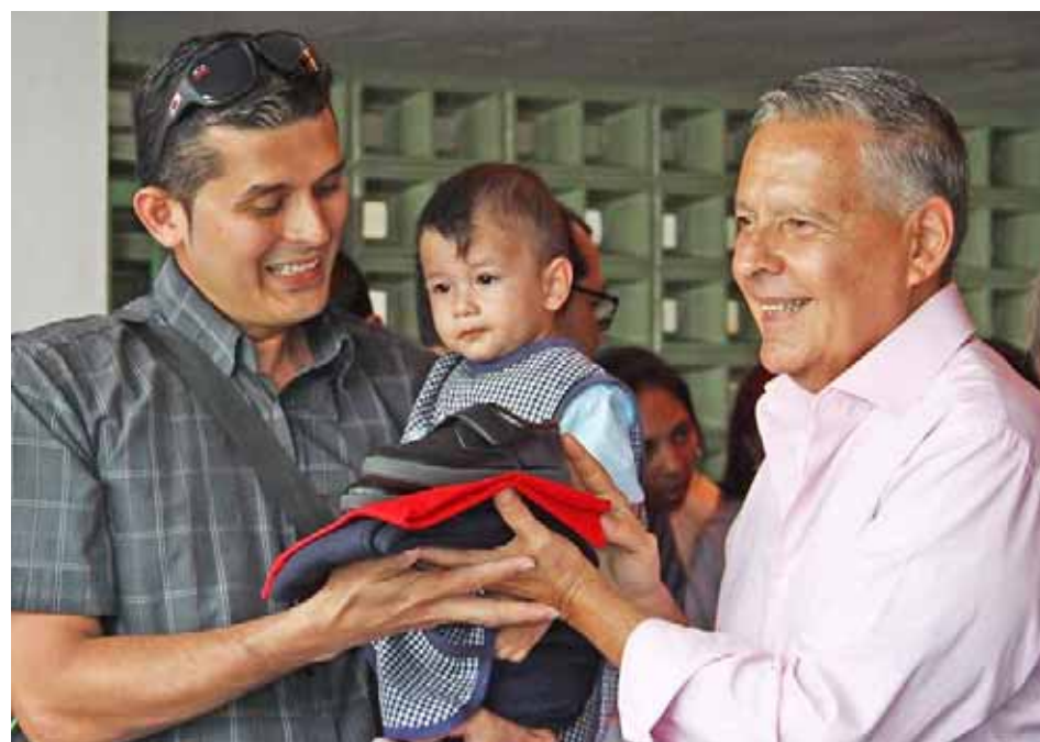
En el CEIM Agustín Aveledo los niños y niñas recibieron uniformes y calzados