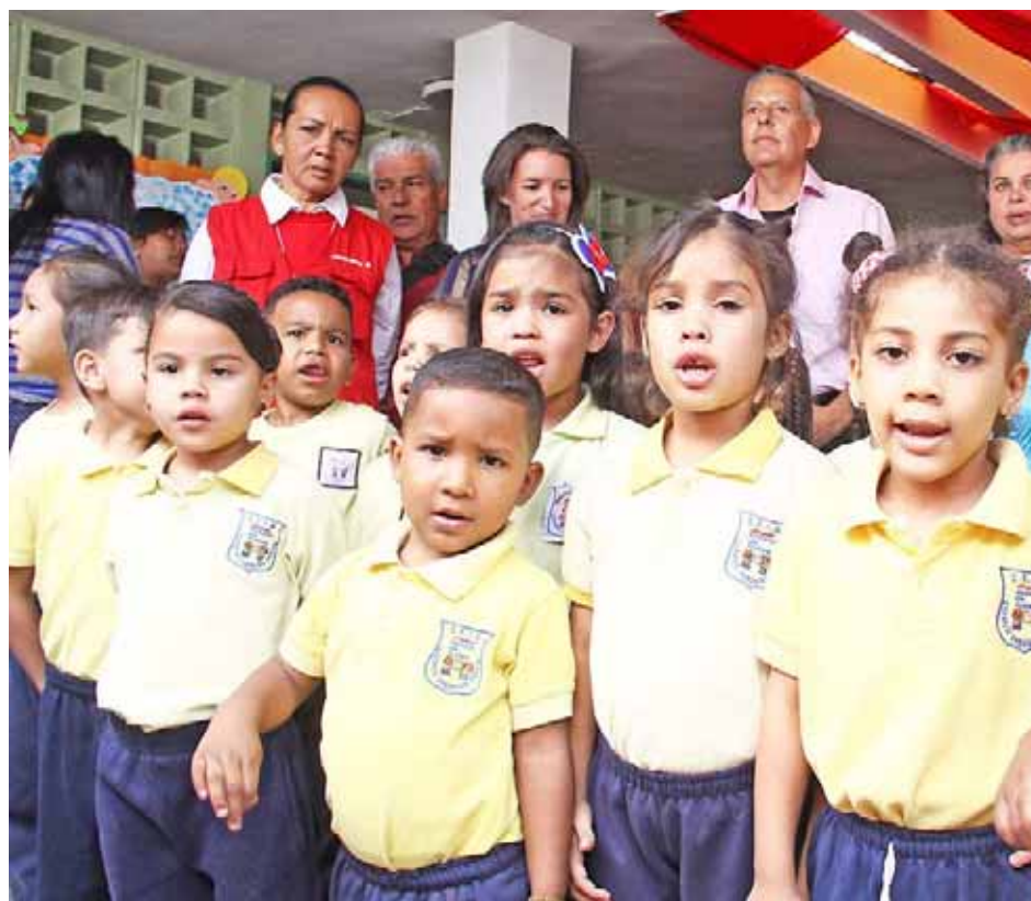
Las voces angelicales entonaron una parranda navideña

“Alrededor de 30 mil jóvenes están empezando las clases en el municipio Sucre”, expresó el alcalde José Vicente Rangel Ávalos, quien agradeció al presidente de la República Nicolás Maduro, quien a través del ministro de Educación Aristóbulo Istúriz, “nos mandó los uniformes escolares de la educación inicial y para el resto de los niveles educativos del municipio”.