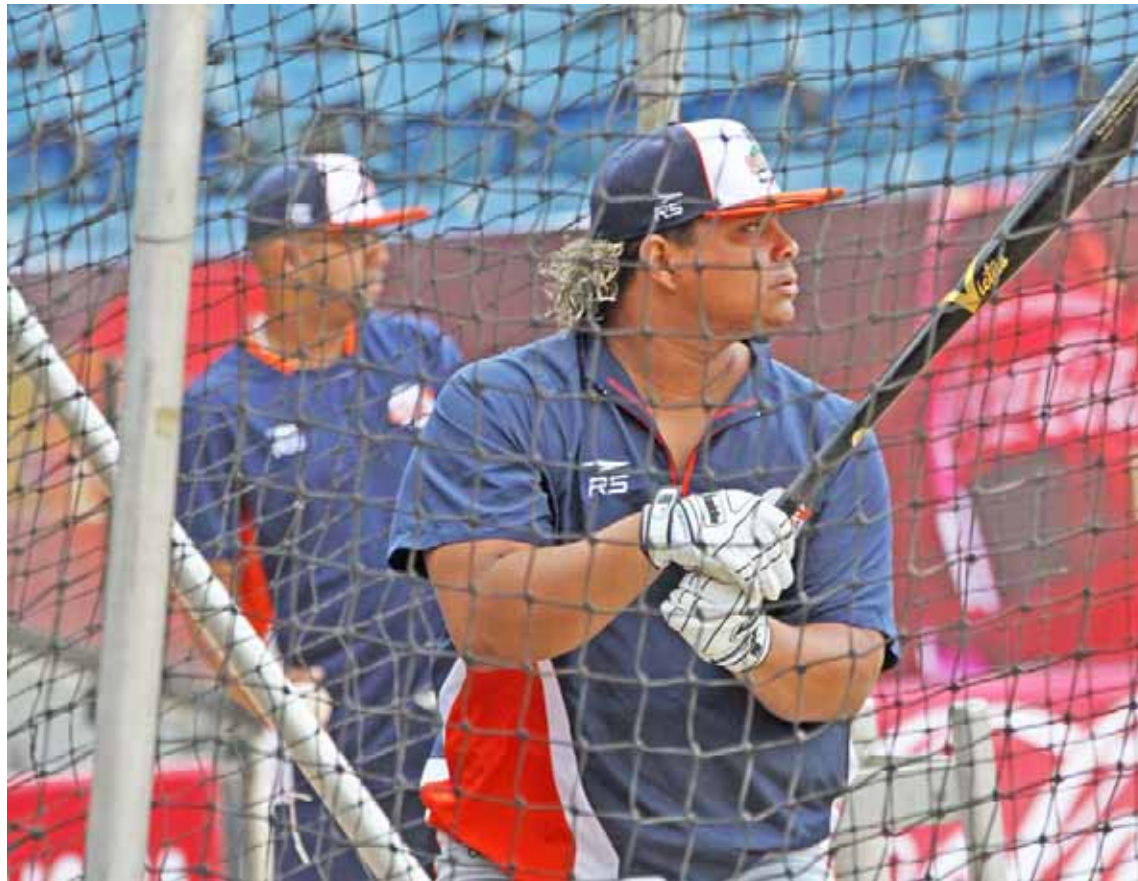
Astudillo practica diariamente en varias posiciones

De 27 años, fue firmado originalmente por la organización de Filadelfia en 2009, pero pasó también por las filiales de Rockies y ligas independiente hasta llegar a triple A con Mellizos, que al final lo subió a las mayores.