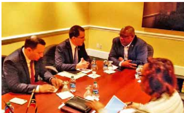
Encuentro de Arreaza con primer ministro de San Cristóbal y Nieves

Mientras tanto, el Gobierno del presidente Nicolás Maduro insiste al Gobierno de Iván