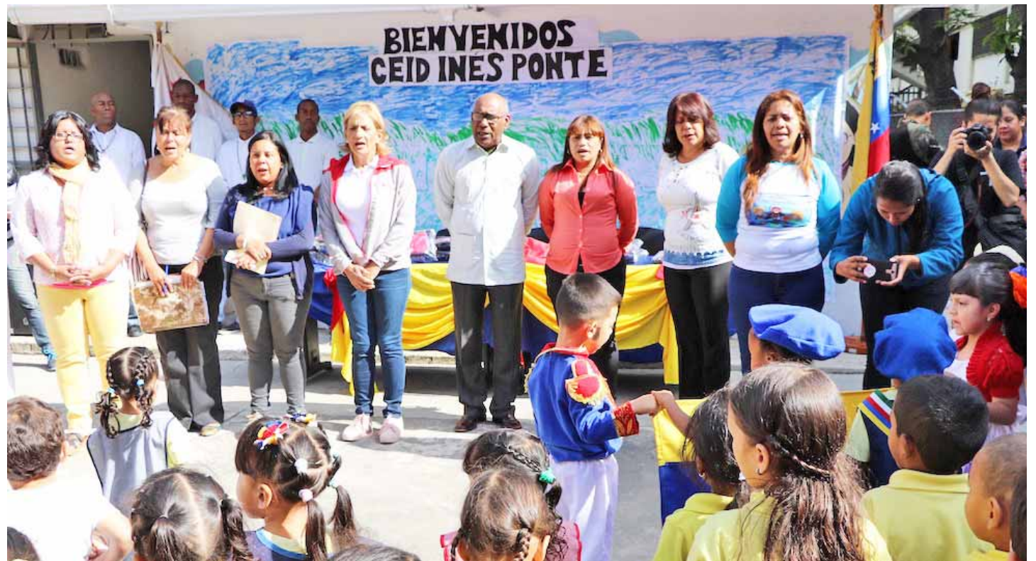
En el preescolar Ciudad Tiuna el Ministro Aristóbulo Istúriz entregó kits escolares, uniformes y zapatos

En el Complejo Educativo Andrés Bello, donde estudian 1.200 estudiantes