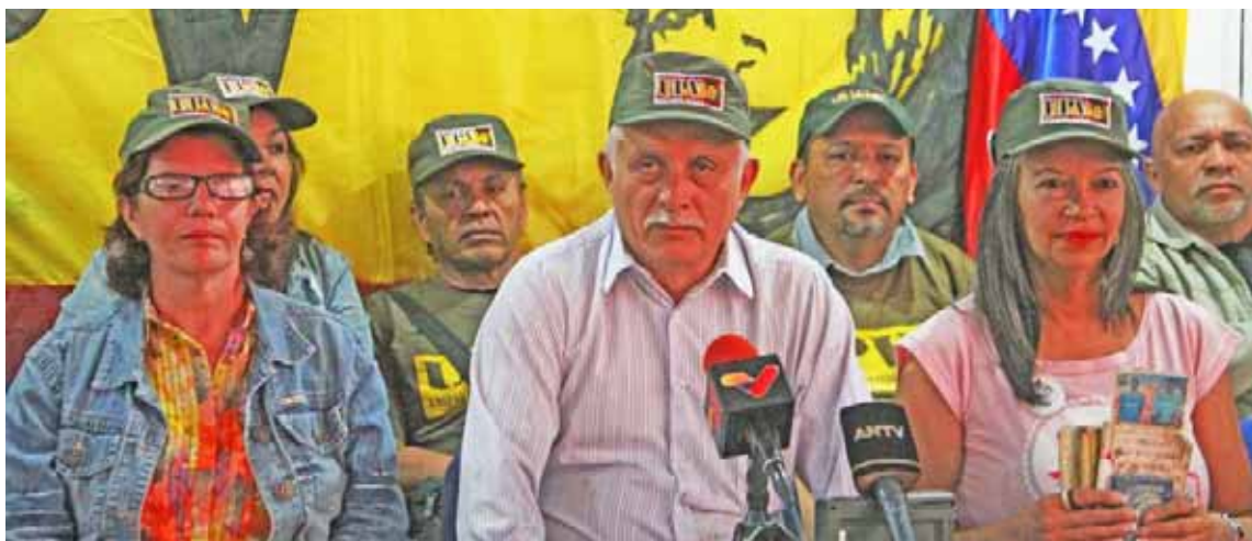
UPV tomará Caracas con motivo de la juramentación presidencial