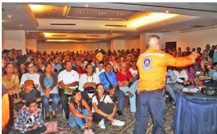
En varias jornadas se han formado más de 4 mil personas en el ámbito sismológico

Se han celebrados reuniones importantes, y hasta ahora se han dictado 130 talleres, y en distintas jornadas se han formado más de 4 mil personas en el ámbito sismológico, esto desde el primero de enero a la fecha, sostuvo el mandatario