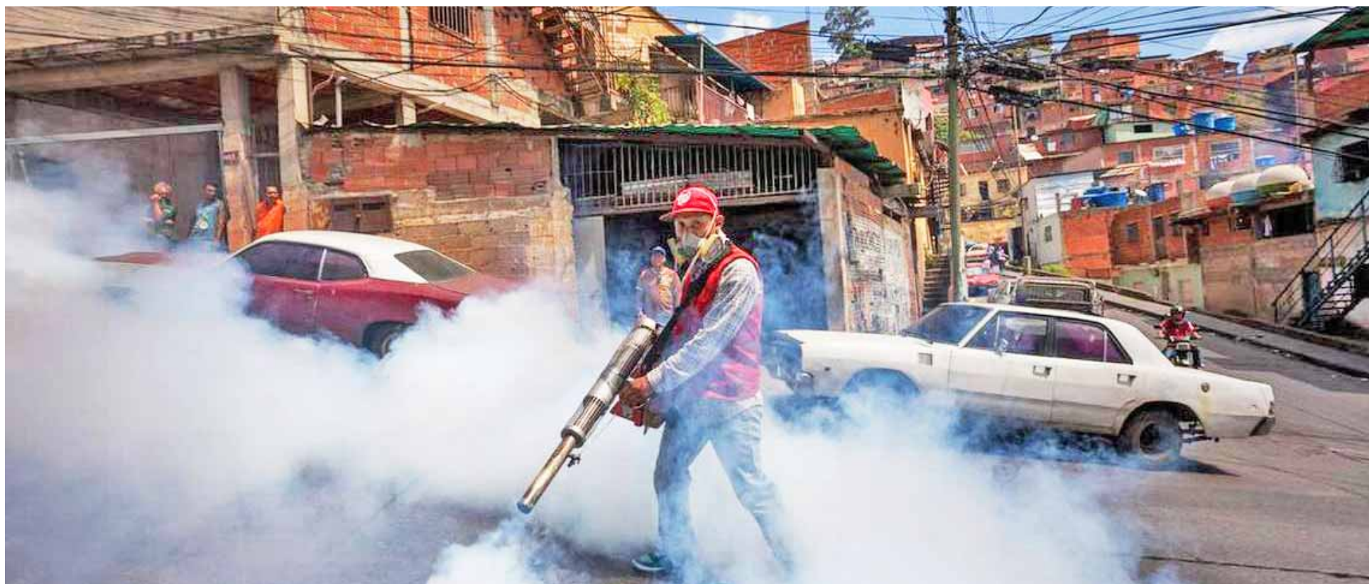
La fumigación en las comunidades se aplica para la eliminación del mosquito adulto