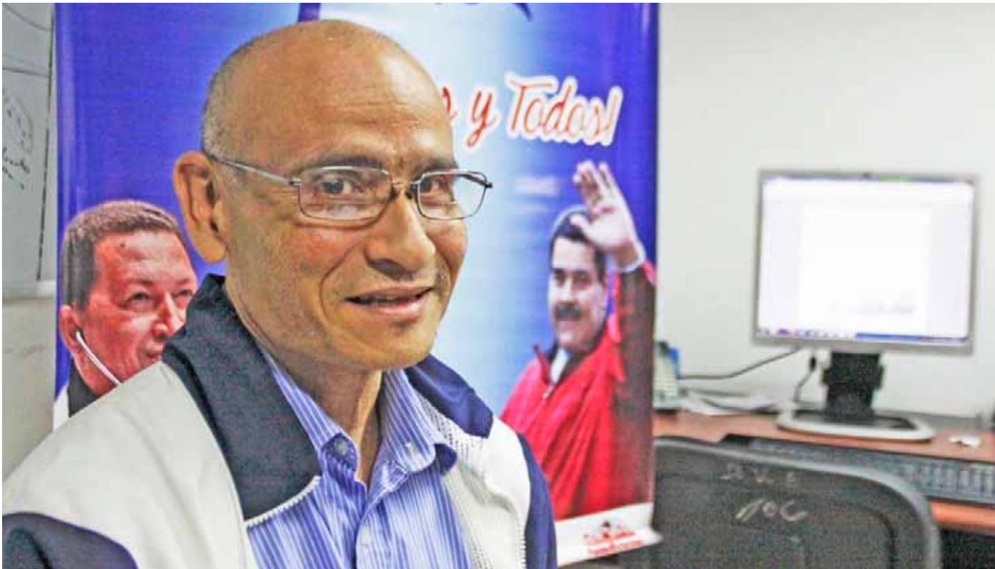
La mejor medida es combatir el dengue durante el menor nivel de incidencia