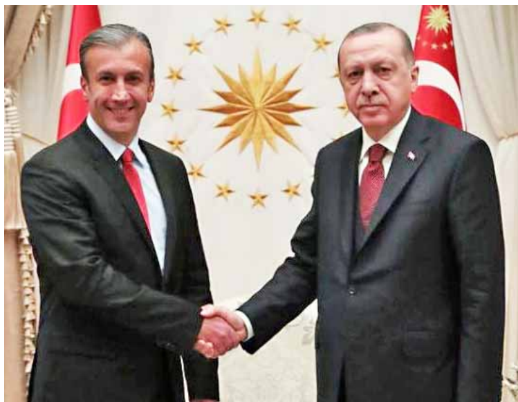
Titular de Industria y Comercio con Presidente de Turquía

En el Palacio de Gobierno, El Aissami hizo entrega de una carta del presidente Nicolás Maduro al Mandatario turco y aprovechó la oportunidad para