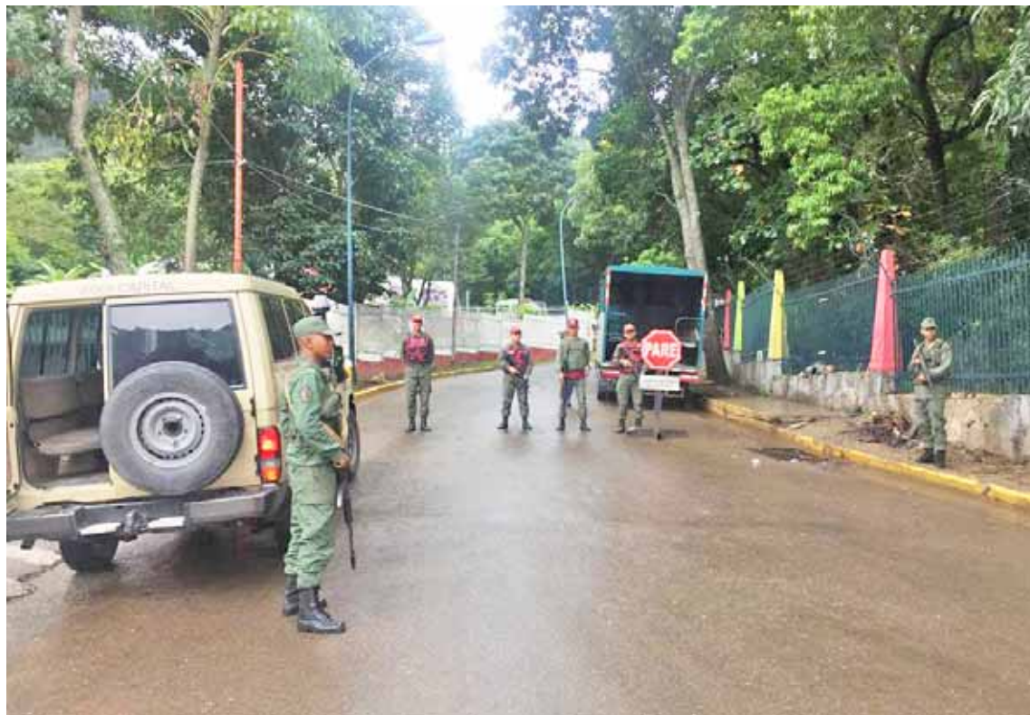
Los efectivos militares atenderán las denuncias del pueblo

También para reportar el boicot comercial, el aumento de la tarifa del pasaje, entre otros, la REDI Capital puso a disposición