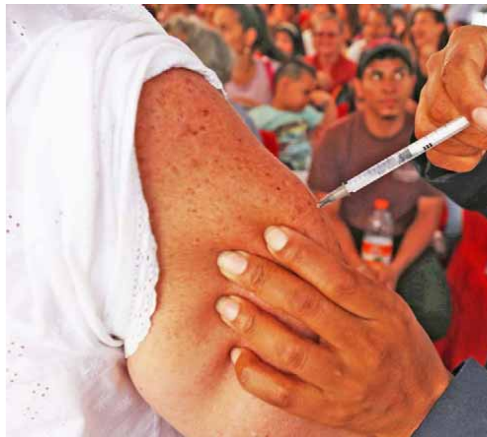
Las jornadas de vacunación comenzarán el próximo mes de abril

García aprovechó la oportunidad para informar a la población venezolana, que ya está disponible el servicio de registro y el certificado de natalidad y mortalidad. “Hemos tenido algunas dificultades en materia de la distribución de los