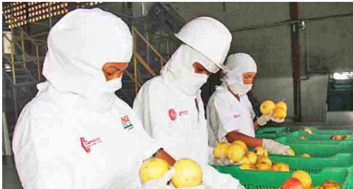
Los productores de La Guajira han sido los más beneficiados

Señaló que la corporación continúa incrementado su apo-