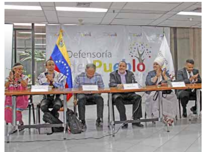
En el encuentro de oración participaron representantes de distintos cultos religiosos

“En este momento en Venezuela necesitamos la humildad para reconocer las diferencias