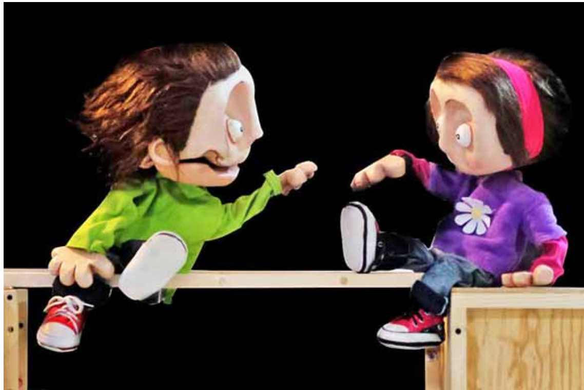
Hasta en el exterior se han realizado presentaciones vinculadas a la efeméride venezolana