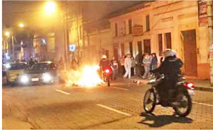
Según el Gobierno de Ecuador, unos 250.000 venezolanos se encuentran en este país

La Policía brindó protección a mujeres, niños, algunos en brazos, y adultos inmigran-