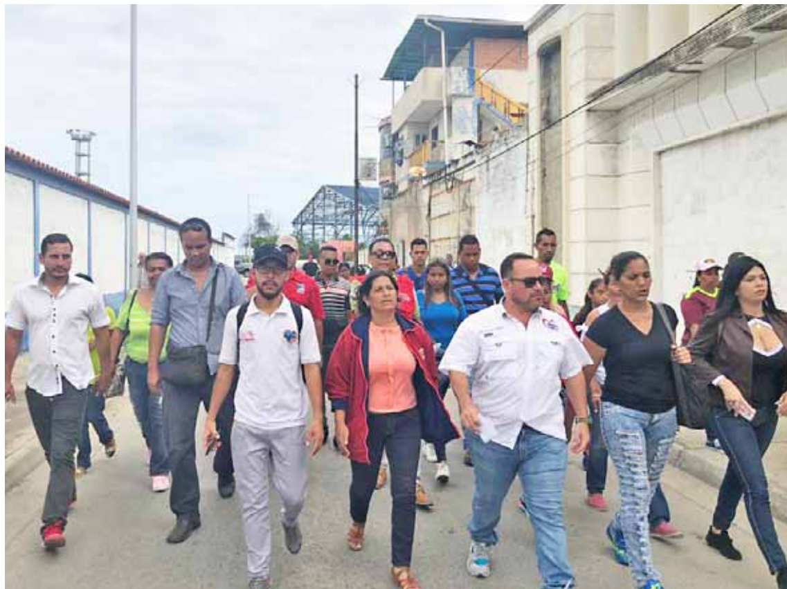
Los bolivarianos agradecieron a Maduro por escoger a la ciudad porteña

“Comenzamos a hacer las inspecciones para el trabajo mancomunado con los tres