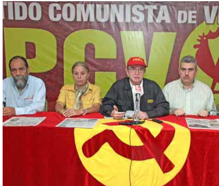
PCV invitó a defender la conquista sociales alcanzadas en los últimos 20 años

En otro orden de ideas, el dirigente llamó a la unidad del pueblo para defender la patria