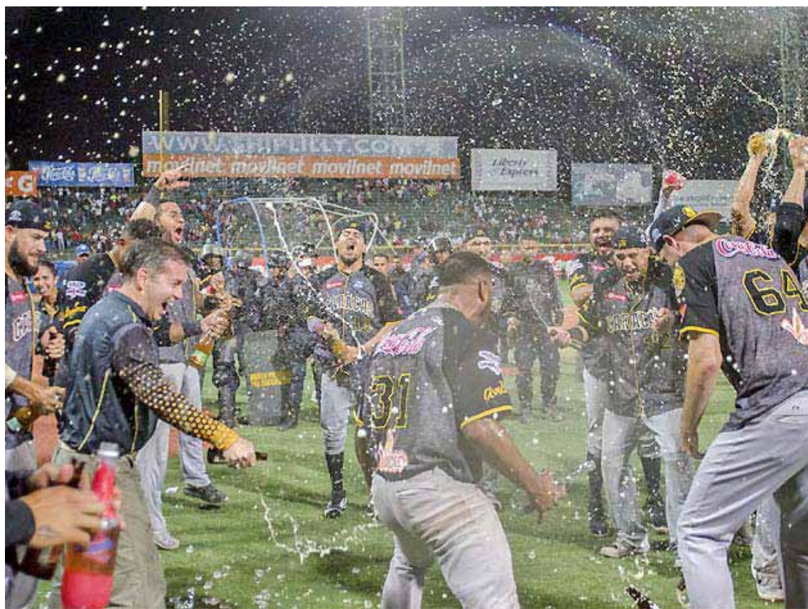
Los melenudos buscarán su título 21 en la LVBP

En el torneo 1979-1980, Leones, bajo el mando de Felipe Alou, ganó 46 juegos en la eliminatoria. Lara, con Vernon Benson trazando la estrategia, alcanzó un récord particular con 39. Ambos llegaron a la final. Leones ganó los dos primeros en Caracas, el segundo de ellos con jonrón de Williba-