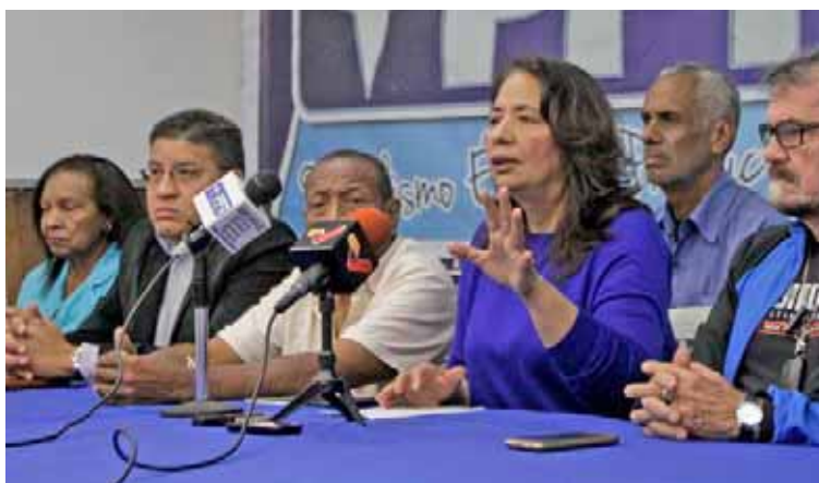
PPT solicitará un encuentro con el presidente Maduro

La dirigente anunció que este 23 de enero, el PPT estará