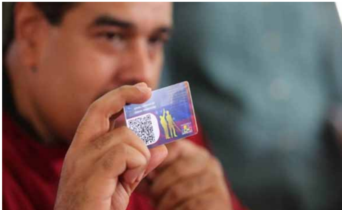
Dos años otorgando beneficios al pueblo venezolano

La creación del Sistema Patria, al que fue incorporado la tecnología de código QR, permite al Gobierno Bolivariano conocer las necesidades específicas de cada carnetizado y su grupo familiar. Con este mecanismo, el Ejecutivo ha logrado