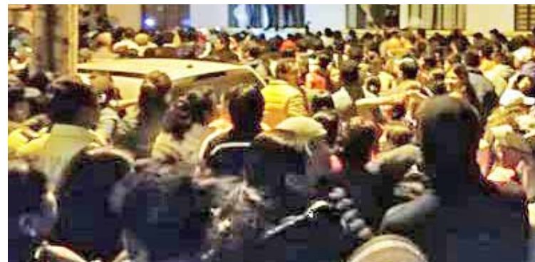
Venezolanos víctimas de xenofobia en Ibarra, Ecuador

“El presidente Lenín Moreno y su gobierno han incitado una persecución fascista contra los venezolanos y las venezolanas en Ecuador”,