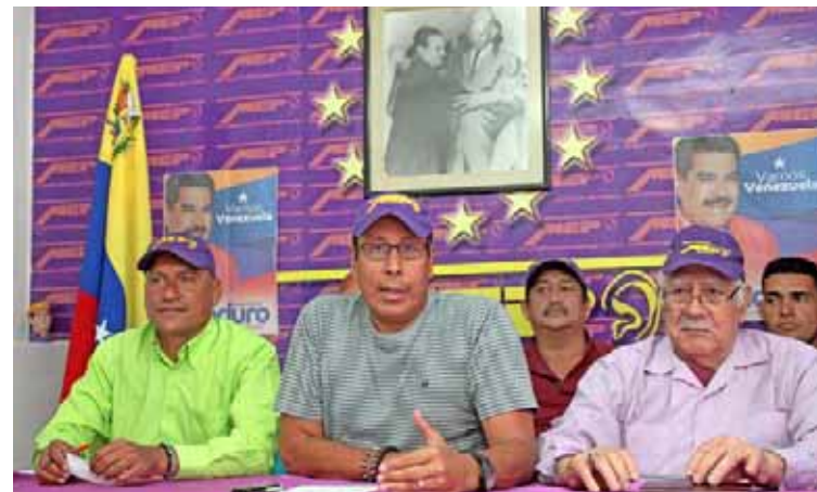
MEP: el suceso es parte de “un gran show”

En otro orden de ideas, el MEP, en la voz de Giménez, ratificó su postura ante los anuncios de tipo económico realizados por el presidente Nicolás Maduro, con las que apoya cualquier medida que contribuya a recuperar el poder adquisitivo del pueblo. No obstante, sostuvo que “el aumento del salario mínimo como medida única no resuel-