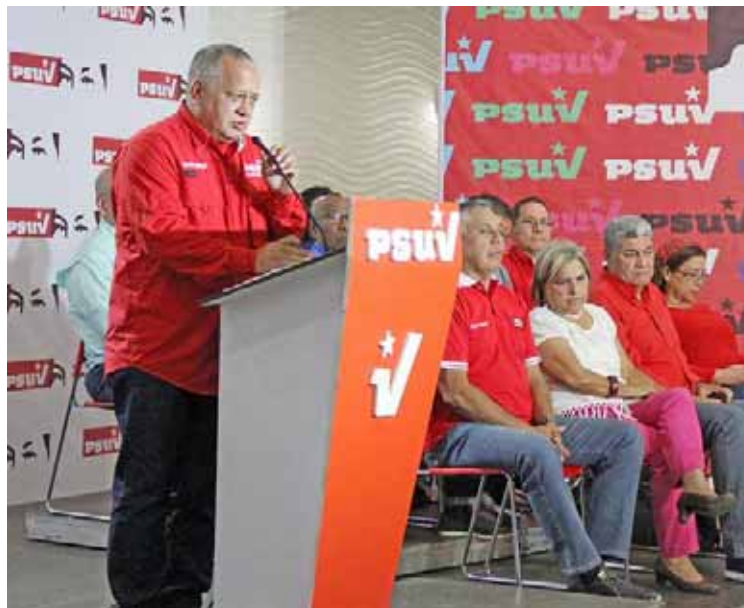
El PSUV invitó al pueblo a participar en los ejercicios militares

El dirigente revolucionario, también conmemoró los dos años de la creación y puesta en marcha del Carnet de la Patria, como mecanismo para combatir la guerra económica a la que