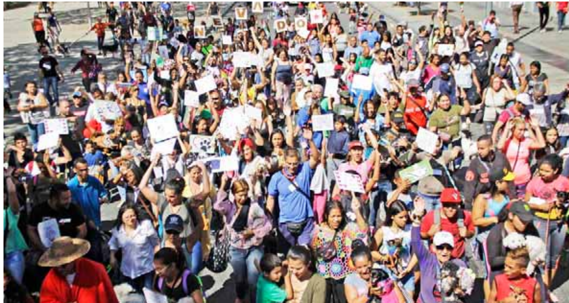
La caminata familiar tuvo una participación superior a los 400 animales

Explicó que las coordinaciones regionales realizan los operativos de atención médica ve-