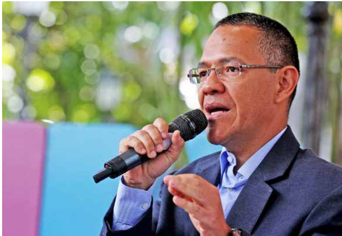
El ministro Ernesto Villegas afirmó que Europa debe encargarse resolver sus problemas

“No hacen falta plazos ni siete días ni una hora ni 15 segundos, ahora mismo se puede establecer un diálogo político en Venezuela, si hubiese la vo-