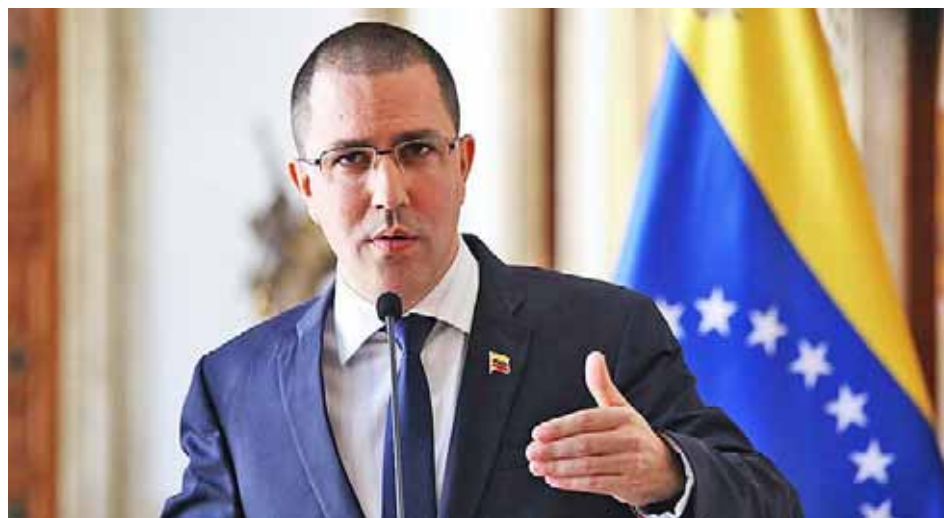
Ministro de Exteriores condenó injerencia de Sánchez

También señaló a RT Noticias que el Gobierno Bolivariana está en comunicación constante con la oposición venezolana. Dijo que aunque no se haya dado un diálogo para solventar la crisis política, “siempre estamos conversando”.