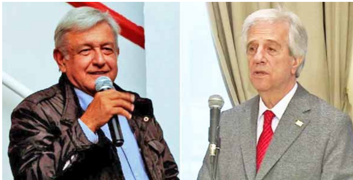
López Obrador y Tabaré Vázquez están dispuestos a interceder por el diálogo

“Los gobiernos de Uruguay y México, en virtud de la posición neutral que ambos han adoptado frente a Venezuela, han decidido organizar una conferencia