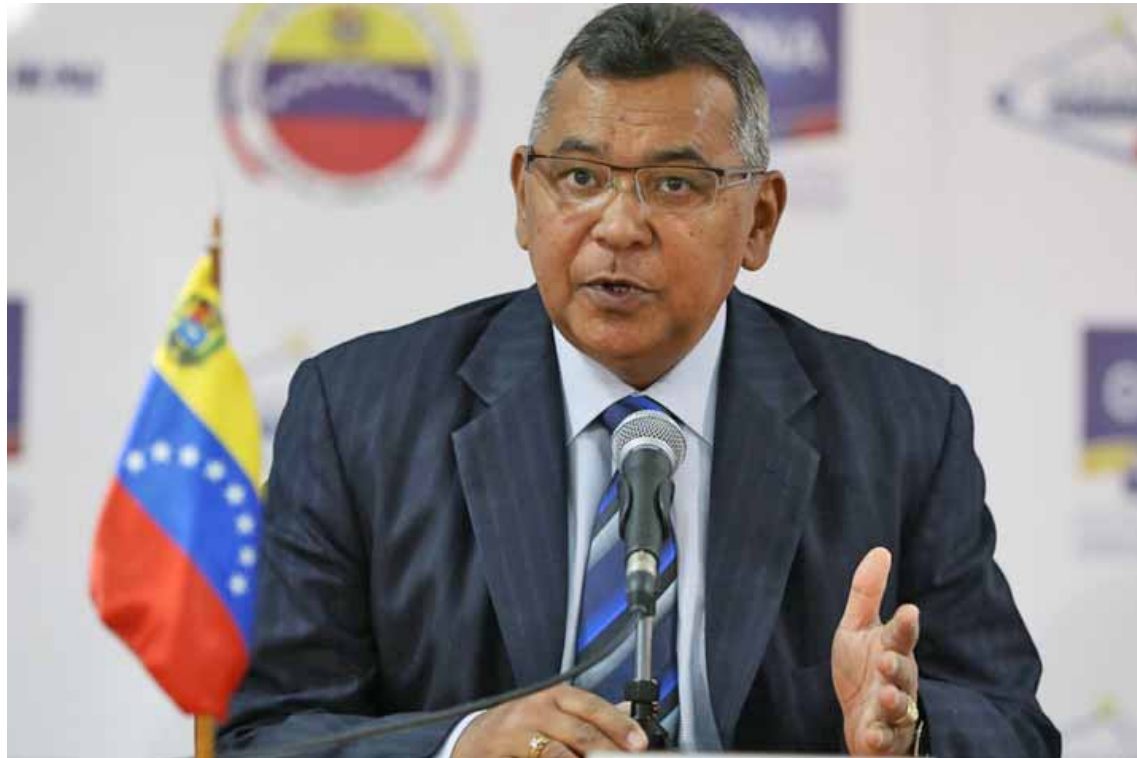
Ministro Reverol destacó que se busca masificar la prevención de la población

Así lo dio a conocer, durante el inicio operativo de la Misión Venezuela Bella, presidida por el Jefe de Estado, Nicolás Maduro Moros, en Caracas; y aseguró que en el transcurso del año se irán incorporando 300