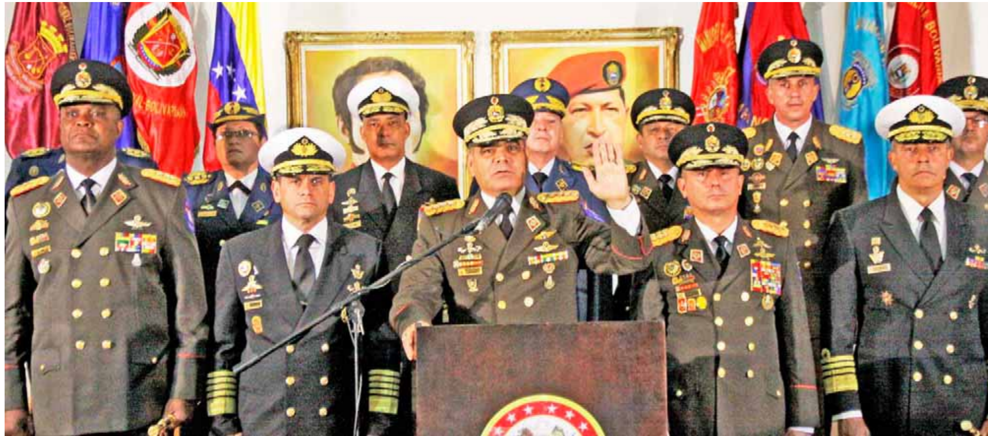
Revolucionarios perciben el legado de Hugo Chávez en el patriotismo del alto mando militar

Un grupo de entrevistados por el Correo del Orinoco concuerdan en que la defensa de la patria es tarea de todos los venezolanos, por eso destacan la unión cívico-militar como herramienta estratégica para repeler cualquier intervención militar extranjera