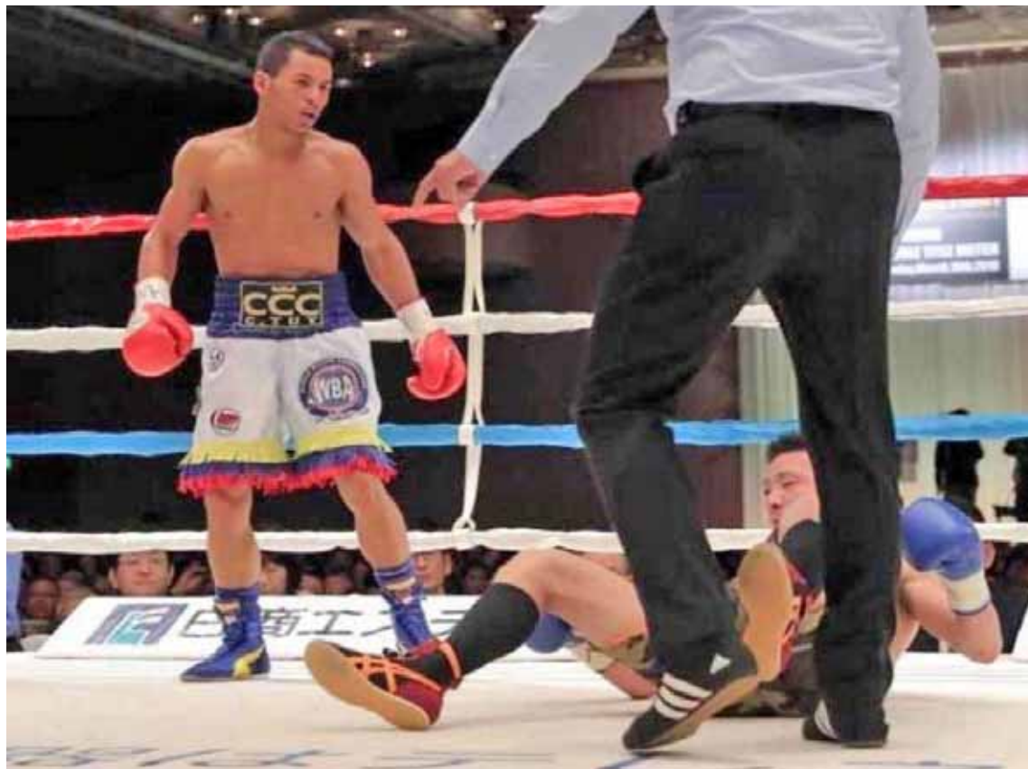
“Triple C” está invicto en 21 refriegas

En la actualidad su registro es de, en 21 victorias, (17 KO) y un empate. Recibió este 2019 en familia, pero no ha descuidado los entrenamientos: “Estoy trotando, haciendo defensa y saco, pero no guantearé hasta que no esté cerca de una defensa. Considero que puedo hacer más peleas en minimosca. Eso sí, cuando considere que no puedo hacer más defensas, subiré al mosca. Ser campeón del mundo es algo muy grande. Lo he logrado con tanto sacrificio, tanto trabajo con mi equipo.