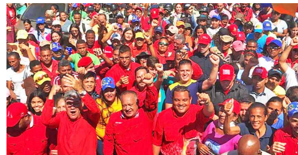
Concentración del pueblo de Falcón

“La Unión Europea cree que Venezuela es una colonia y nos dieron ocho días para convocar nuevas elecciones, el plazo se vence el sábado 2 de febrero. ¿Qué va a pasar si Nicolás Maduro no llama a elecciones el sábado? ¿Qué van a hacer, se van a ir para Miraflores?”