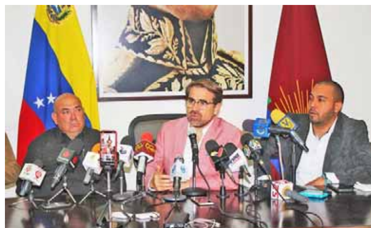
Lacava reiteró que aquí no habrá golpe de Estado

"Un grupo de delincuentes, de cínicos, que tiene eco en las comunidades se presta para este tipo de cosas, utilizando a los niños y a los jóvenes para tal fin (...). ¿Hasta dónde quieren llegar? Esa no puede ser la