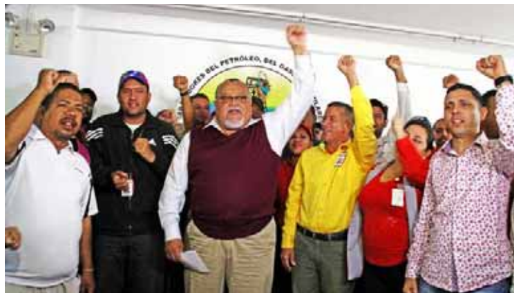
Los petroleros repudian el injerencismo y afirman que esta guerra será derrotada

“Tengan la plena seguridad que nosotros en el tema de la