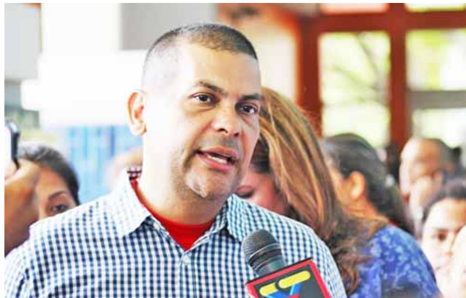
Prieto recalcó que es el momento de ponerse al frente en defensa de la soberanía

El mandatario regional, Omar Prieto, aseguró que ante una eventual invasión, Cabimas será el primer municipio afectado por tener los pozos petroleros