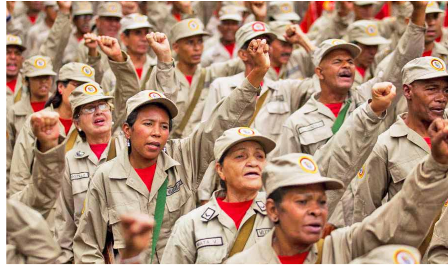
“La unión cívico-militar es la respuesta contra las intenciones del imperio”

“El pueblo y la FANB están unidos por la defensa de la soberanía y de los derechos de todos los venezolanos. Nosotras y nosotros, a través del voto, hemos elegido, hemos apoyado y seguiremos apoyando al presidente electo por el soberano, a Nicolás Maduro Moros”, asegura esta miliciana de la parroquia El Recreo, quien invita al pueblo a mantenerse movilizado, consciente de la coyuntura política, pero sobre todo a “ser patriotas”