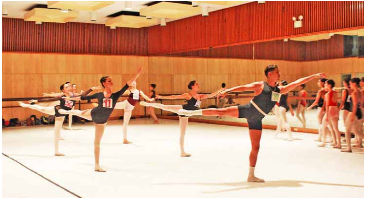
Realizarán audiciones en Barquisimeto, Puerto La Cruz y Distrito Capital

De tal manera que, en vista de las dificultades inherentes a la creación de cuerpos artísticos profesionales y semiprofesionales en el interior del país y para buscar la manera de desarrollar todo ese talento artístico que se inicia en la danza más allá de Caracas, tiene lugar la creación de este nuevo equipo.