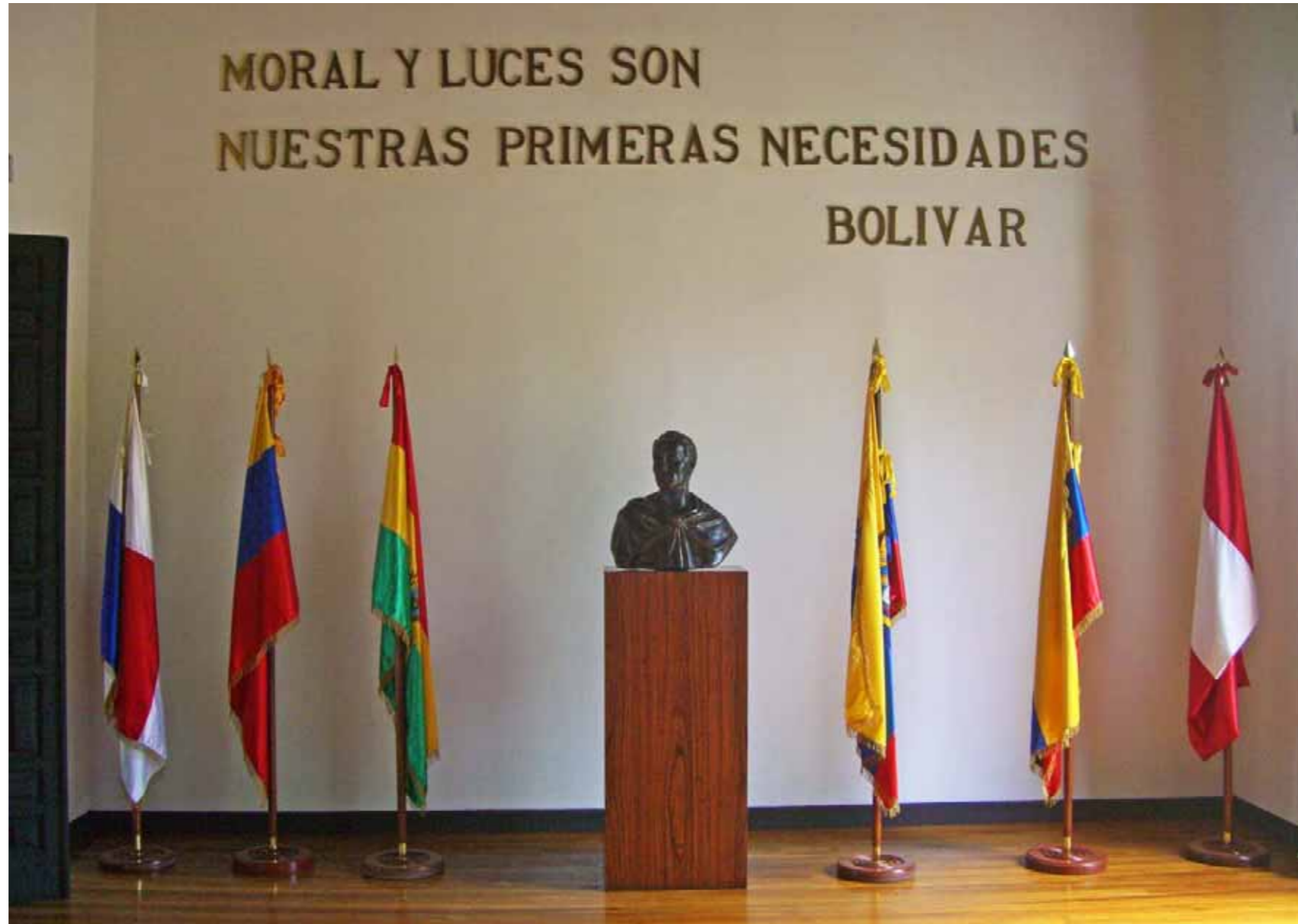
Salón de sesiones del Congreso de Angostura

En su referencia al discurso, Augusto Mijares, en su obra El Libertador , indica "...El principio fundamental en que insiste con energía es que Venezuela no puede seguir imitando a los legisladores del Norte, ni menos aún conservar la Constitución de 1811, que a la dispersión del régimen federal unía la debilidad del Ejecutivo colegiado. Pero no se atreve a fijar esos principios, poco gratos a su auditorio, sin acumular primero acerbas observaciones sobre nuestros antecedentes políticos, y, en general, sobre la versatilidad de todos los pueblos y lo difícil que