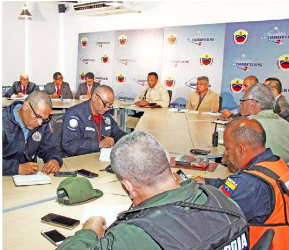
Relanzamiento de la Gran Misión Transporte Venezuela