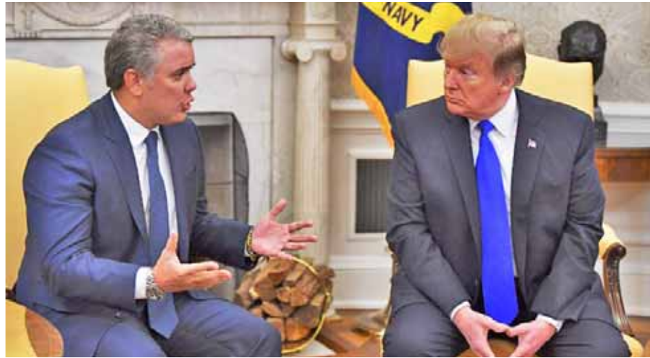
En 2017, Trump amenazó con no certificar Colombia en la lucha antidrogas

“Estamos trabajando juntos para que Colombia erradique algo de lo que están cultivando en Colombia.