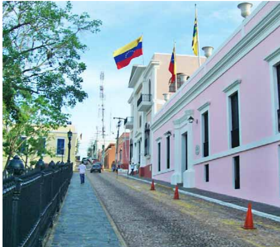
Casa sede del Congreso

ha sido estabilizar en algunos de ellos la libertad... En oposición a la Carta de Jamaica, en la cual había dicho que la América era un mundo "en cierto modo viejo en los usos de la sociedad civil", ahora afirma que "uncido el pueblo americano al triple yugo de la ignorancia, de la tiranía y del vicio, no hemos podido adquirir ni saber, ni poder, ni virtud". Posibilidades aterradoras pasan ante sus ojos: "Un pueblo ignorante -clama- es un instrumento ciego de su propia destrucción: la ambición, la intriga, abusan de la credulidad y de la inexperiencia de hombre ajenos a todo conocimiento político, económico o civil: adoptan como realidades las que son puras ilusiones; toman la licencia por la libertad, la traición por el patriotismo, la venganza por la justicia. Semejante a un robusto ciego que instigado por el sentimiento de sus fuerzas, marcha con la seguridad del hombre