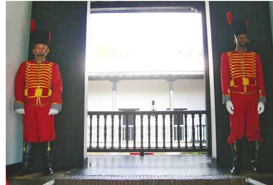
Entrada a la casa sede del Congreso de Angostura en Ciudad Bolívar

En el recorrido del texto se evidencia la inquietud de Bolívar sobre el carácter de las or-