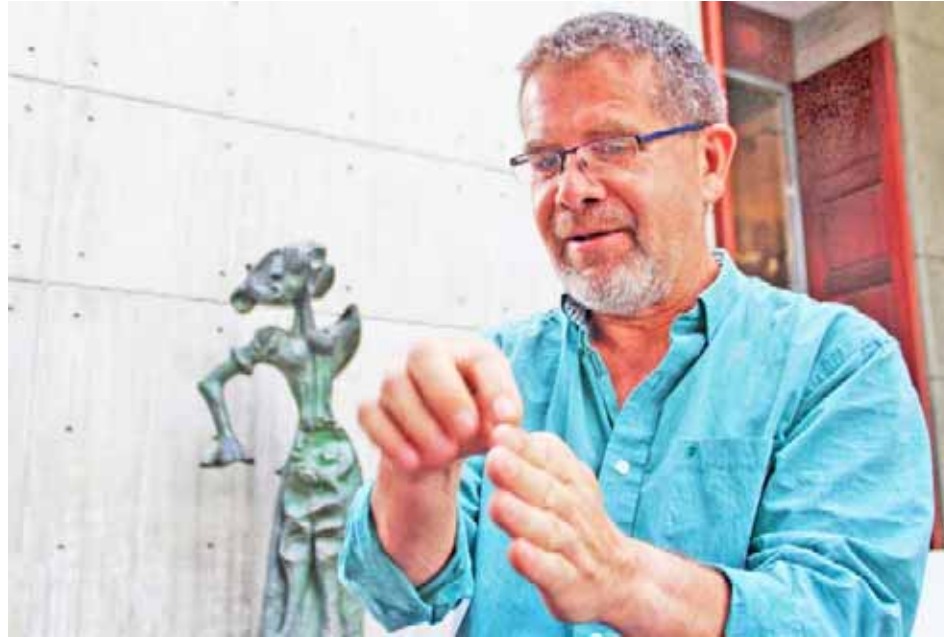
La escritor recibió también el Premio Apacuana de Dramaturgia Nacional 2017

De acuerdo con una nota de prensa, estos reconocimientos corresponden al trabajo desarrollado por ambos venezolanos con la obra Cariaquito mora'o ,