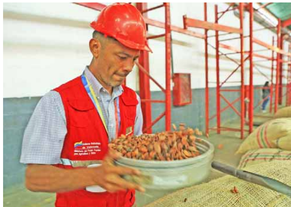
Gobernador Héctor Rodríguez

La entidad también es una de las principales productoras de flores, las cuales actualmente se venden a Rusia, entre otras naciones