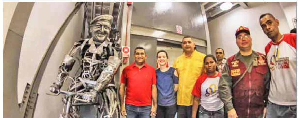
Base de Misiones atenderá a cuatro parroquias maracaiberas

T/ Yajaira Iglesias Maracaibo