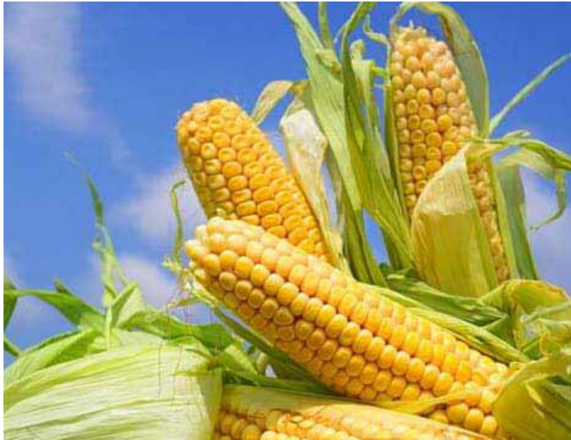
400 mil sacos de semillas están retenidos en México y 500 mil en Argentina

Según nota de prensa publicada por la referida institución, del total retenido, 400