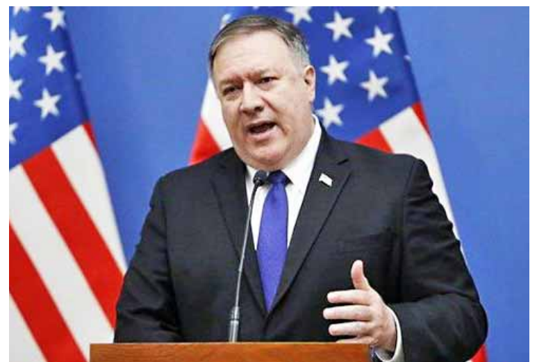
Mike Pompeo está recorriendo Medio Oriente

Las instituciones alcanzadas por las sanciones participaban en los programas estatales de la Organización de Innovación e Investigación para la Defensa de Irán, a la que el Gobierno de Donald Trump señala por, supuestamente, haber trabajado en el desarrollo de "armas