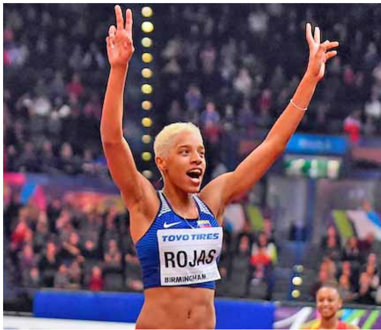
Yulimar aspira a superar de nuevo la barrera de los 15 metros

“Y eso que salto con solo 11 impulsos porque estoy modificando la carrera. Ya verán cuando salte con 13”, señaló recientemente Yulimar Rojas, quien espera mejores logros en venideras justa “y lograr superar la barrera de los 15 metros”.