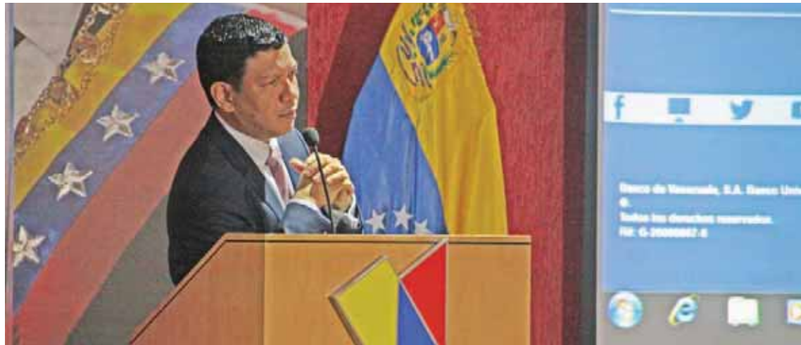
Otra alternativa interesante para usuarios del BDV

Morales destacó que Trámites en línea BDV es un portal que simplifica los recaudos para que los clientes puedan autogestio-