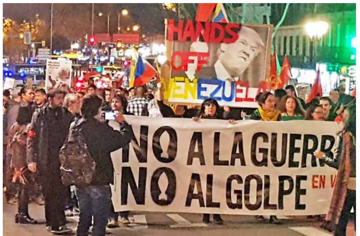
La lucha sigue en Madrid Miles de personas abarrotaron las calles en las cercanías de la concurrida estación de tren de Atocha, ubicada en Madrid, España, en solidaridad con el Gobierno del presidente de la República Bolivariana de Venezuela, Nicolás Maduro, y contra la intervención militar y la guerra.