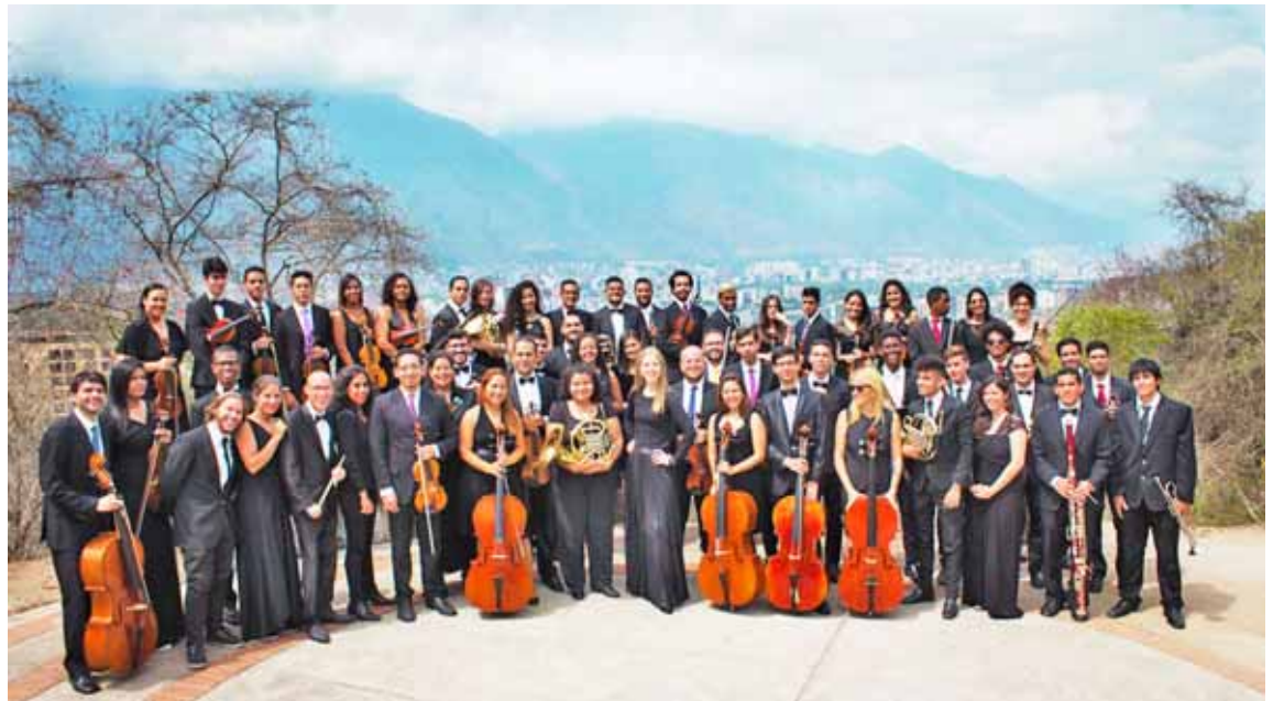
Las dos funciones serán los días 2 y 3 de marzo