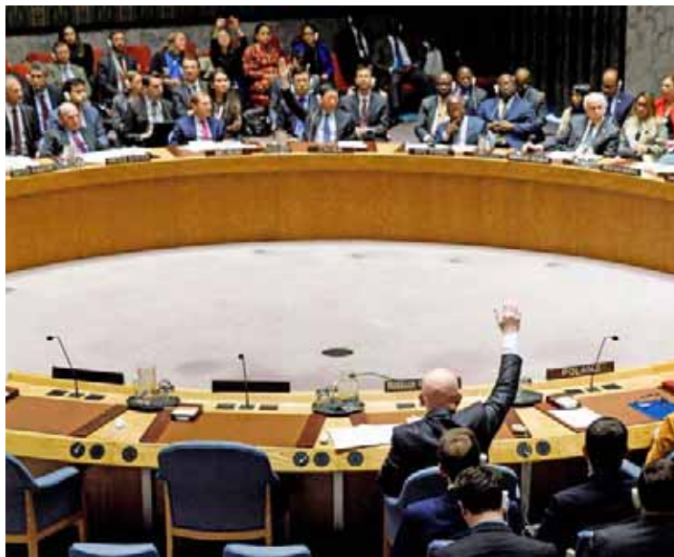
Rusia propuso una solución pacífica basada en el diálogo

Esta votación se realizó luego de que el pasado martes se celebrara la segunda sesión extraordinaria convocada por Estados Unidos para discutir la situación política de Venezuela, y en la cual se reiteró el rechazo de la mayoría a una intervención militar en la nación suramericana.