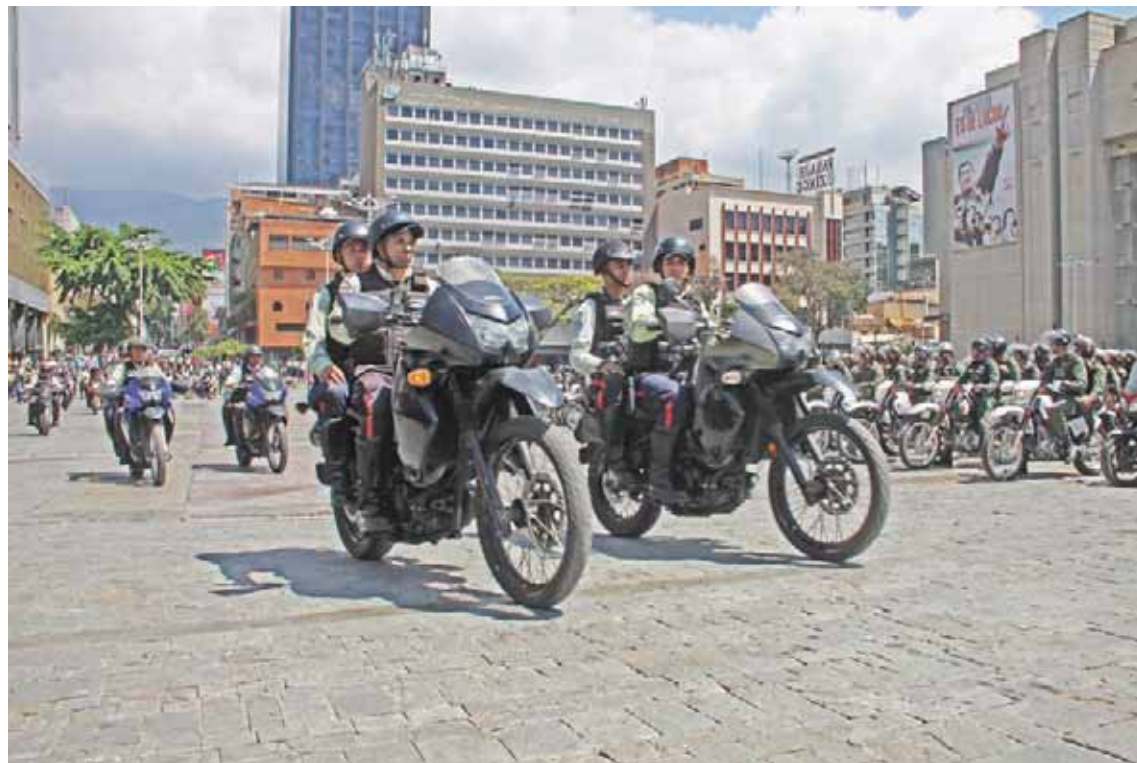
Más de 900 unidades móviles han sido habilitadas para Caracas

La alcaldesa de Caracas, señaló que se han habilitado más de 900 unidades móviles entre patrullas, motocicletas, grúas, ambulancias, vehículos de rescate y siniestros, bicicletas y