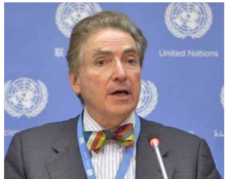
Maurice de Zayas acusó a EEUU de cinismo al ser torturador y salvador de Venezuela

“Cuando estuve en Venezuela entre noviembre y di-