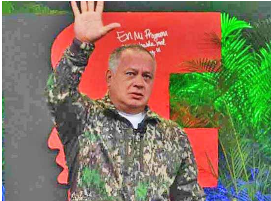
La seguridad de Guaidó está a cargo de personal del sector opositor, señaló Cabello

Sostuvo en su programa que el Grupo de Lima alertó sobre el peligro que corre la vida del opositor venezolano en una reunión con el vicepresidente de Estados Unidos, Mike Pence, realizada en Colombia. "Le están aplicando una sentencia de muerte a Juan Guaidó para culpar al Gobierno Bolivariano", afirmó.