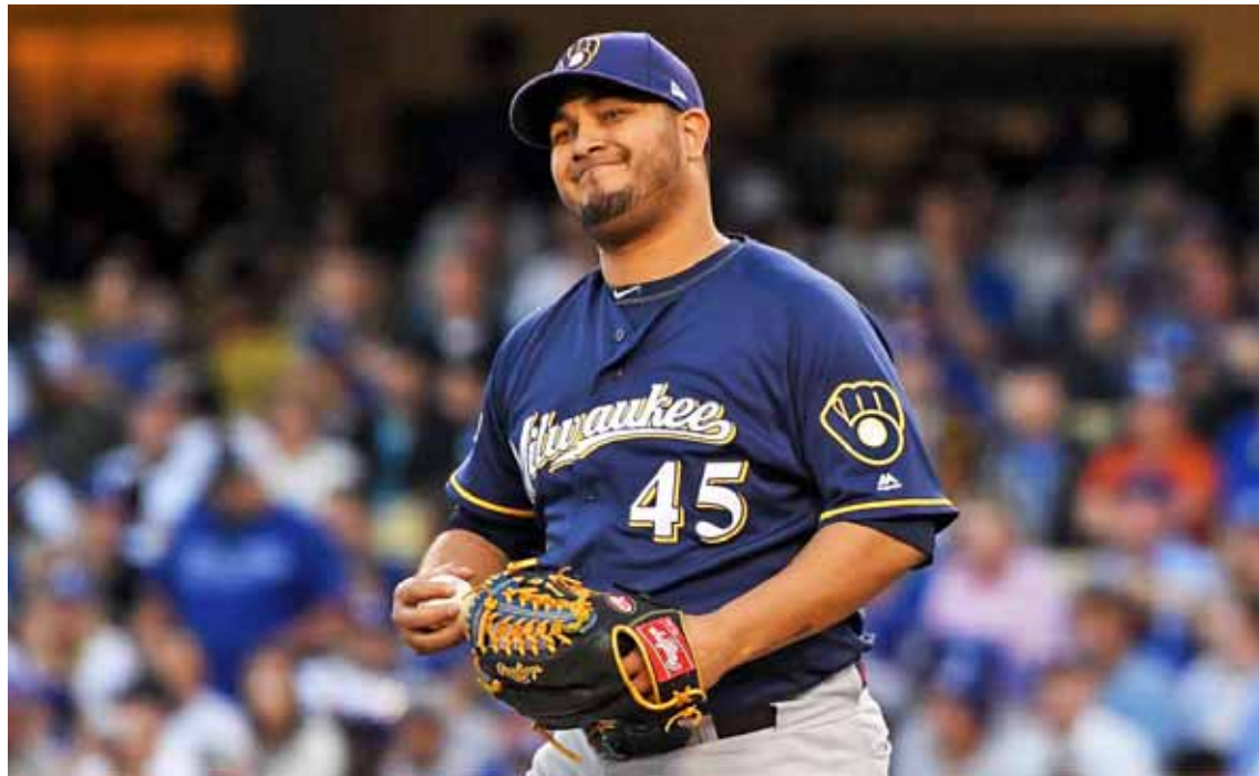
El zuliano ha mostrado consistencia en los últimos años

Dejó atrás el empate para venezolanos que tenía con el zurdo Johan Santana, quien lo consiguió con Mellizos (2007) y Mets (2008). Lo curioso también es que de esta manera Chacín empató con un grupo en las Ma-