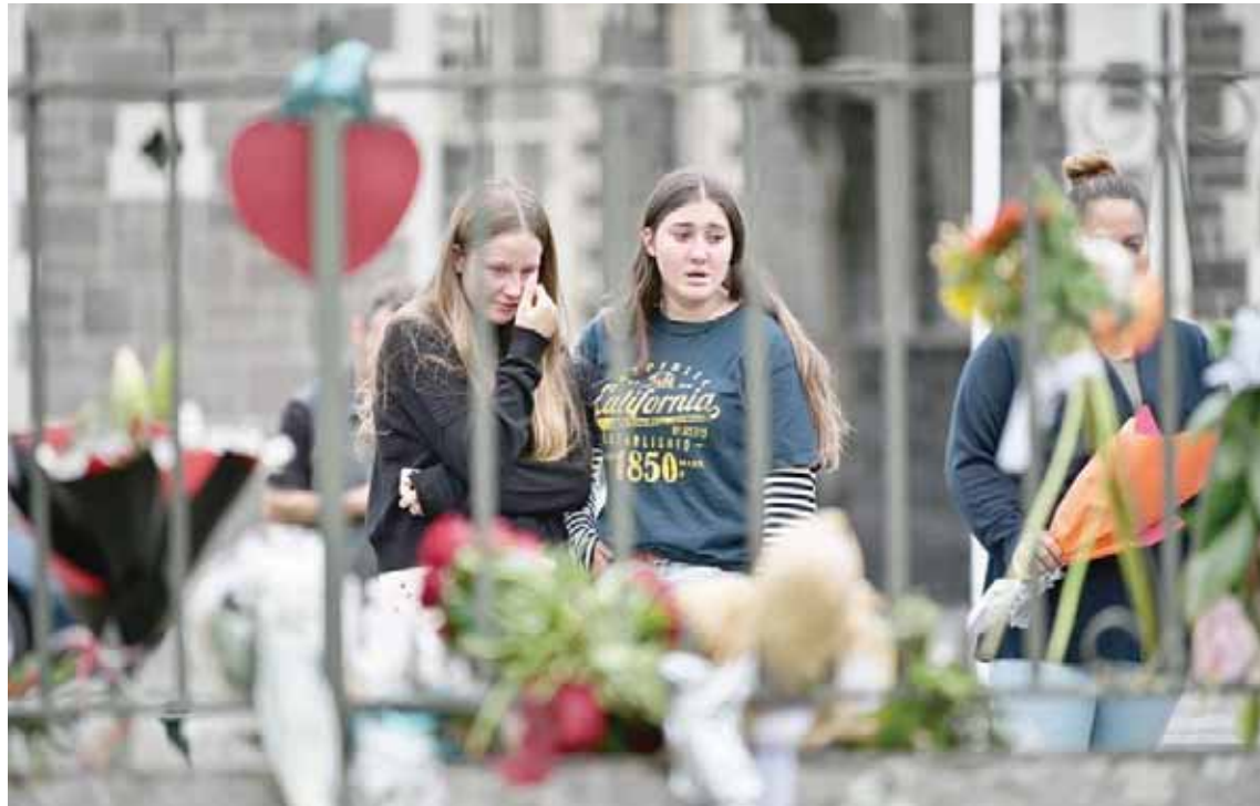
El abominable acontecimiento ha generado múltiples manifestaciones de solidaridad

En el principal centro para las familias de las víctimas de los ataques a las mezquitas de Christchurch, musulmanes de todos los orígenes se abrazan, esconden sus lágrimas e intercambian noticias de sus allegados.