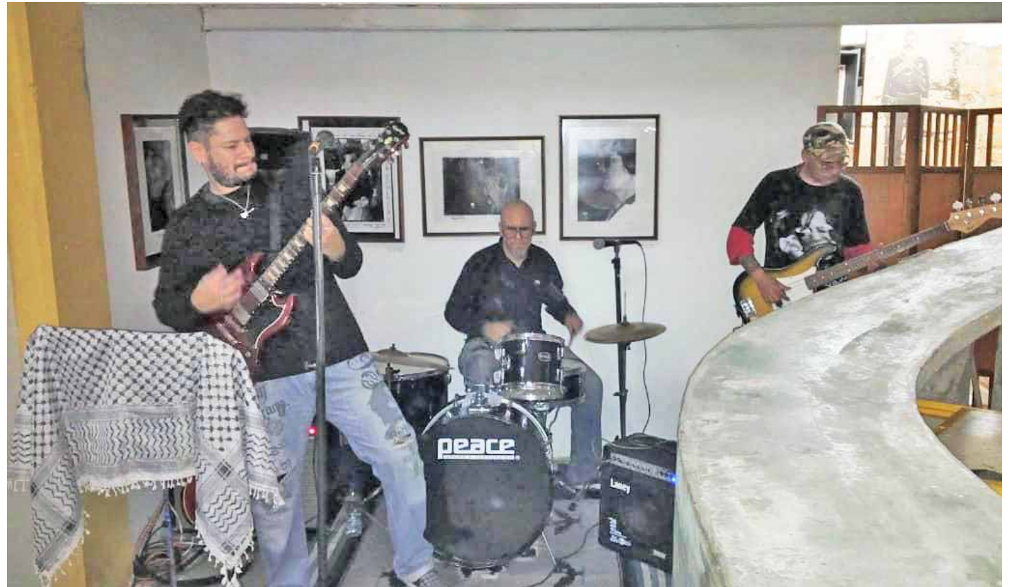
Interpretaron unos 13 temas

El toque de estos seres influenciados por The Cure, Sentimiento Muerto, Dermis Tatú, Kortatu, la Polla Records, La Misma Gente y Soda Stereo, por citar solo algunas agrupaciones, comenzó a las seis y cuarto de la tarde y terminó