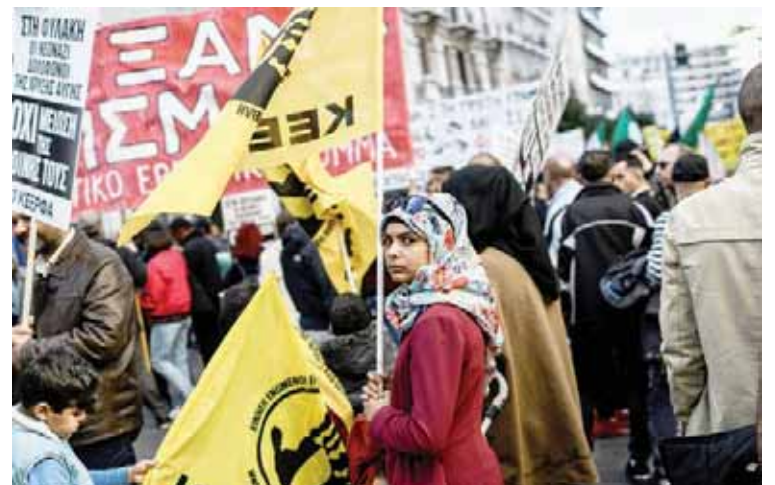
La manifestación se programó incluso antes de la masacre en Nueva Zelanda

En 2018, unos 48.000 refugiados o inmigrantes llegaron a Grecia, de los cuales 32.000 lo hicieron a través de las islas del mar Egeo cercanas a las costas turcas.