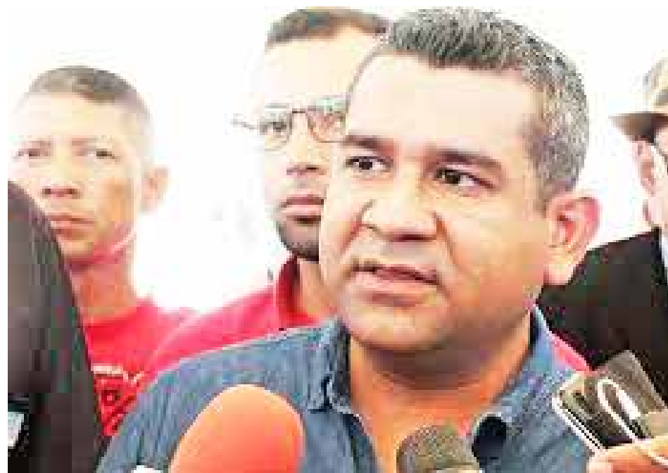
PC determinará cuáles establecimientos gozarán del beneficio

“La idea es que puedan recuperarse y hacer las inversiones necesarias para que doten sus inventarios y así mantengan su operatividad”, detalló.