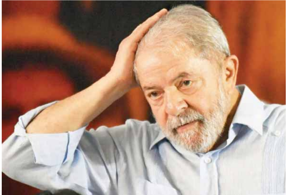
La misiva fue leída este sábado ante los asistentes al Encuentro Nacional Lula Libre

Según Lula, solo este mes, con la revelación de que los fiscales que lo acusaron llegaron a un acuerdo con el Gobierno de Estados Unidos para recibir 2.500 millones de reales (657,9 millones de dólares) de la petrolera brasileña Petrobras, se supo lo que había detrás de todo el proceso.