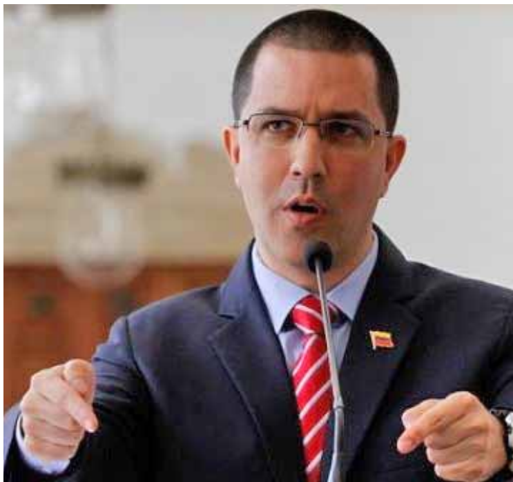
Arreaza: Estados Unidos pretende caricaturizar su política exterior

El diplomático venezolano se preguntó: ¿Esta caricaturización de la política representará los valores del pueblo estadounidense?, por lo que instó al Gobierno de Estados Unidos a sacar sus manos de Venezuela, esta aseveración la realizaría