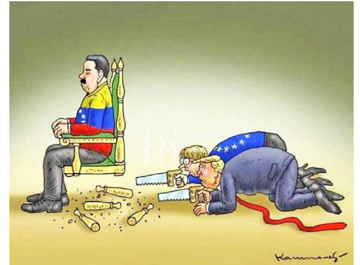
Viñeta cortesía del canciller Jorge Arreaza publicada en su Twitter