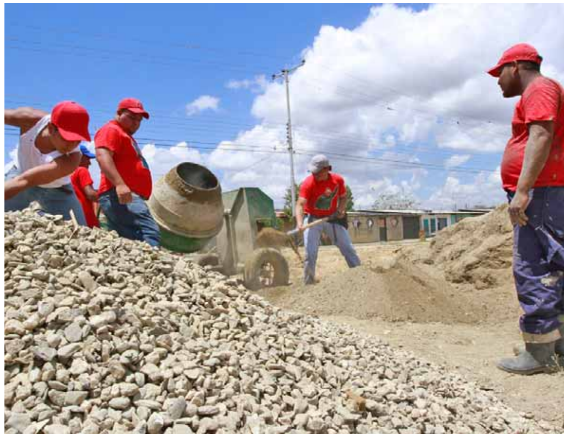
El sector construcción mueve muchos empleos en todo el país

Tienen como objetivo reactivar las obras paralizadas por la guerra económica