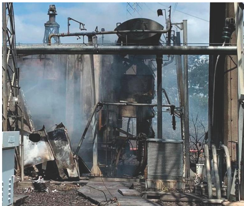
El sabotaje al servicio eléctrico lo atribuyen a “falta de mantenimiento”

Un diario estadounidense como El Nuevo Herald, de poca solvencia ética y moral, se hizo eco de este informe divulgado en el IESA por una comisión del Centro de Orientación en Energía (Coener). Y afirmó: “La negligencia, la falta de mantenimiento y un abandono