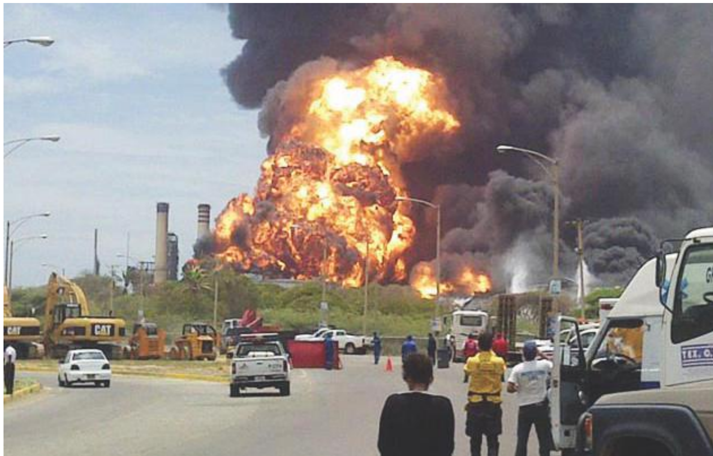
El incendio de la refinera de Paraguaná fue presentado por técnicos de la oposición como resultado de falla humana o impericia

En un intercambio cómplice, a los países de derecha y al Grupo de Lima se les presenta como la “comunidad internacional”, incluyendo a organismos como la OEA, con Luis Almagro a la cabeza; el sabotaje a los servicios públicos se encubre con “falta de mantenimiento”, de inversión, de carencia de dotación por el personal obrero o de incapacidad gerencial. En el plano electoral le echan la culpa de las veinte y tantas derrotas al “ventajismo del Gobierno” y a la parcialidad del CNE, sobre todo de Tibisay Lucena.