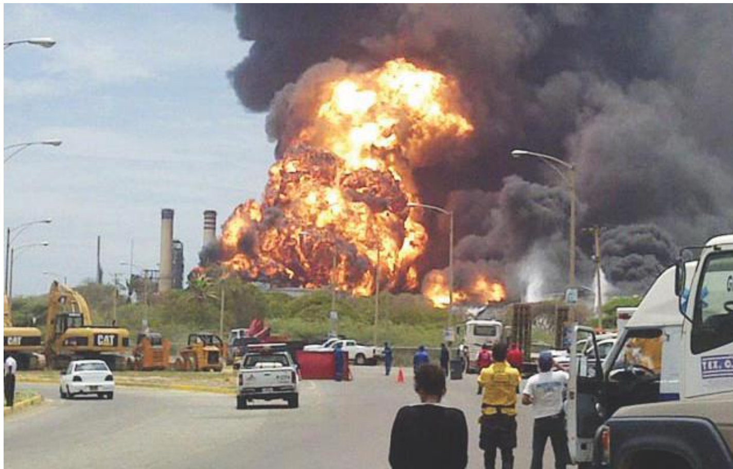
El incendio de la refinera de Paraguaná fue presentado por técnicos de la oposición como resultado de falla humana o impericia

En un intercambio cómplice, a los países de derecha y al Grupo de Lima se les presenta como la “comunidad internacional”, incluyendo a organismos como la OEA, con Luis Almagro a la cabeza; el sabotaje a los servicios públicos se encubre con “falta de mantenimiento”, de inversión, de carencia de dotación por el personal obrero o de incapacidad gerencial. En el plano electoral le echan la culpa de las veinte y tantas derrotas al “ventajismo del Gobierno” y a la parcialidad del CNE, sobre todo de Tibisay Lucena.