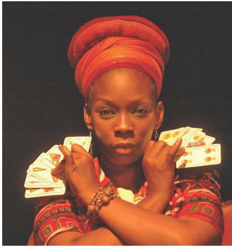
El autor ganó el Premio Apacuana 2017

Esta tercera edición del evento que convoca a artistas latinos de los circuitos alternativos de teatro de la llamada Gran Manzana, es una produc-