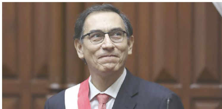
Un 48% de los consultados consideran que en su gestión hay corrupción

Asimismo, el mayor porcentaje de desaprobación, 51%, está en el sur del país, donde se concentró una larga protesta contra la mina Las Bambas en los últimos dos meses, mientras que su aprobación se concentra en el norte y centro del Perú con 47%.