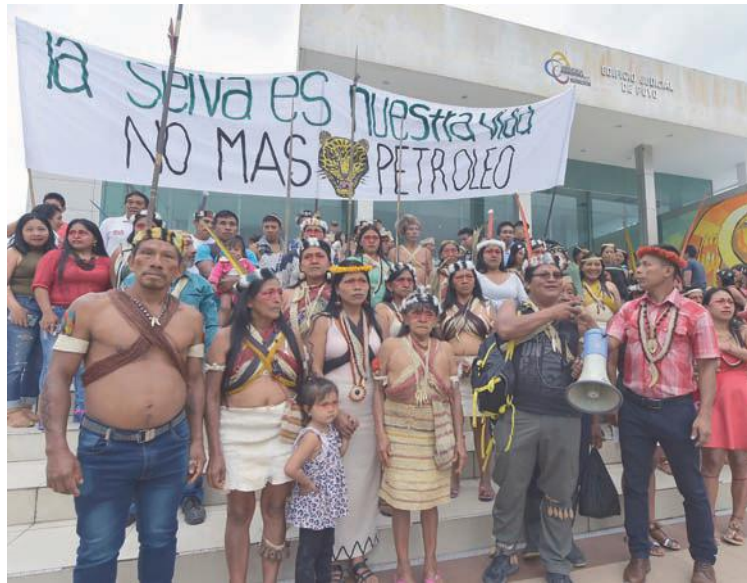
Los pobladores no recibieron información completa sobre la explotación de su zona

El proceso contra los ministerios de Energía y Recursos Naturales No Renovables y de Ambiente busca mantener libre de actividades petroleras unas 180.000 hectáreas de territorio ancestral waorani en la parte norte de Pastaza, cuya capital es Puyo.