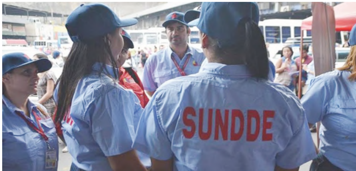
Los funcionarios visitarán ocho terminales en el estado Miranda

En Twitter, la Sundde el organismo recalcó que entre los