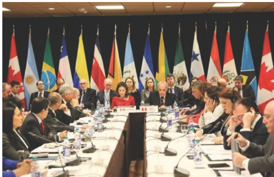
Se refieren al Grupo de Lima como la “comunidad internacional”

En el caso de los 150 paramilitares colombianos introducidos en el país para asesinar a Hugo Chávez, en mayo del 2004, el binomio prensa-oposición política apeló al sarcasmo y a la ironía, camufló el grave delito con el velo irónico de “paracachitos”, mientras que el intento de asesinato de Nicolás Maduro y su gabinete, en agosto del año pasado fue descalificado como un “montaje del régimen”. Y un individuo como Oscar Pérez, el hombre que disparó desde un helicóptero contra un jardín de infancia y tiroteó desde el