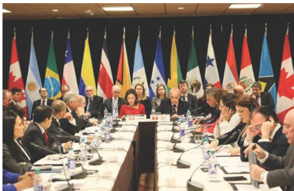
Se refieren al Grupo de Lima como la “comunidad internacional”