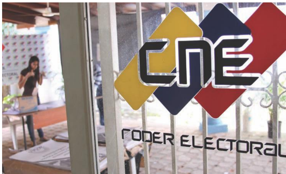
Para la derecha criolla, sus fracasos electorales son culpa del CNE

“Eramos felices y no lo sabíamos”, repiten por las redes sociales quienes pretenden hacer ver que el pasado “puntofijista”, caracterizado por el saqueo y la entrega de nuestros recursos a la potencia del Norte, del “cuánto hay pa’eso”, del agotamiento del modelo político y económico que explotó con “el Caracazo” en 1989 y la rebelión del 4 de febrero de 1992, no son sino invenciones del réeeegimen, asegurando que “el modelo socialista fracasó”.