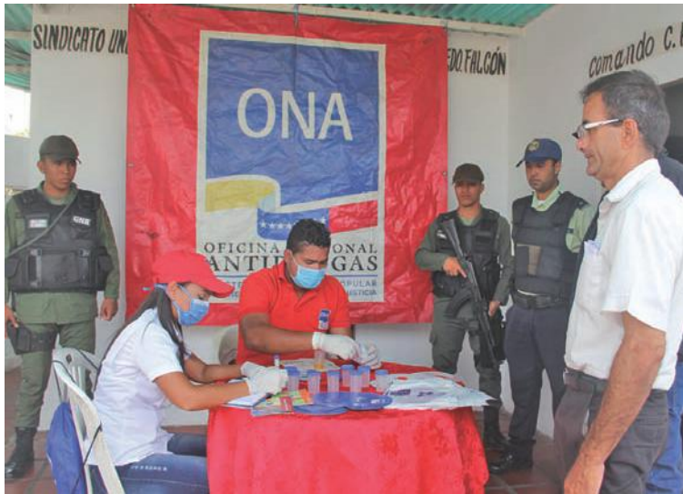
La ONA trabaja con el objetivo de prevenir siniestros y accidentes de tránsito

Fueron instalados 204 puntos de control e información con el fin de realizar labores preventivas