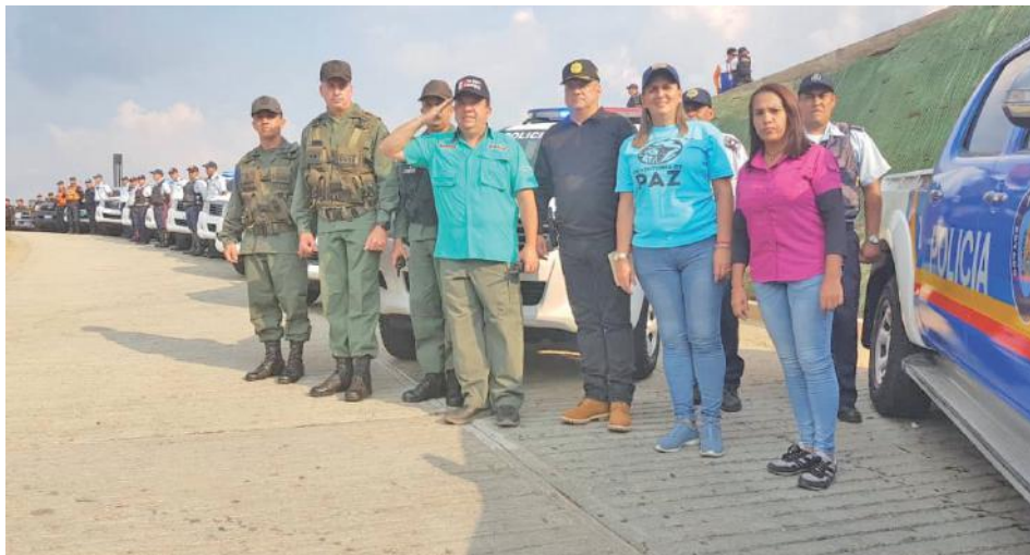
La FANB y la PNB están activas para el resguardo de la ciudadanía