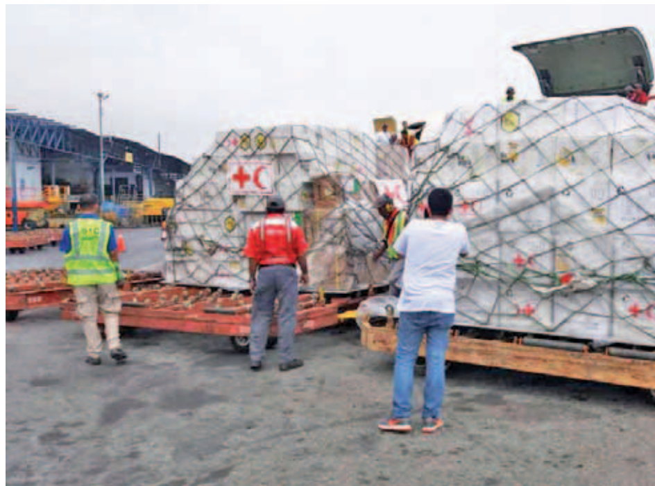
“Estamos preparados para atender cualquier contingencia producto de la guerra económica”

La información la dio a conocer el ministro del Poder Popular para la Salud, Carlos Alvarado, en su cuenta Twitter: @AlvaradoC_MPPS, en la que publicó: “Siguiendo instrucciones del Presidente @NicolasMaduro, acompañamos a la Federación Internacional de la Cruz Roja y la Media Luna Roja en el recibimiento de 24 toneladas de medicamentos y plantas eléctricas”.