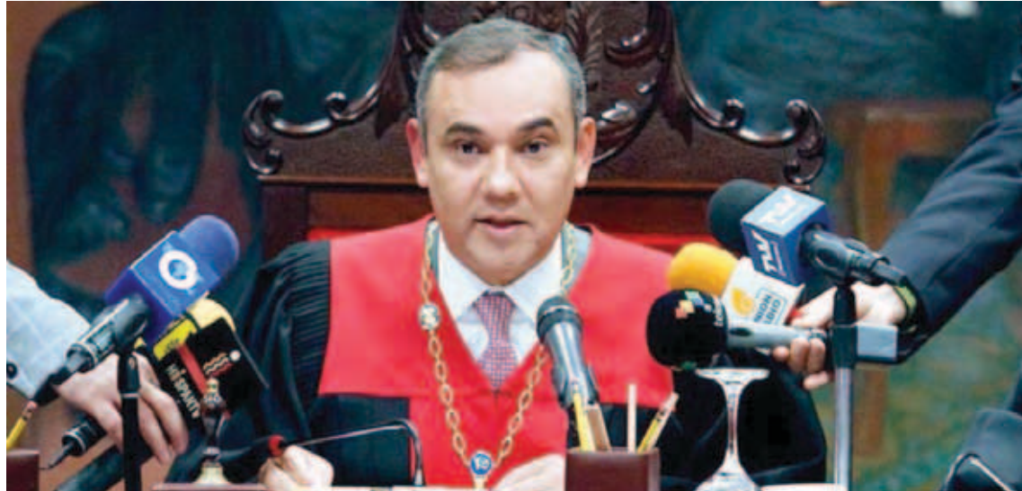
Para el magistrado, Canadá es uno de los brazos ejecutores de la política estadounidense