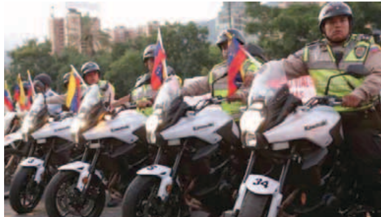
Más de 18 mil funcionarios atienden el estado Miranda

Más de 18 mil funcionarios se encuentran desplegados en el estado Miranda, como parte del Dispositivo Semana Santa Segura 2019, así lo informó el viceministro de Política Interior y Seguridad Jurídica, Hanthony