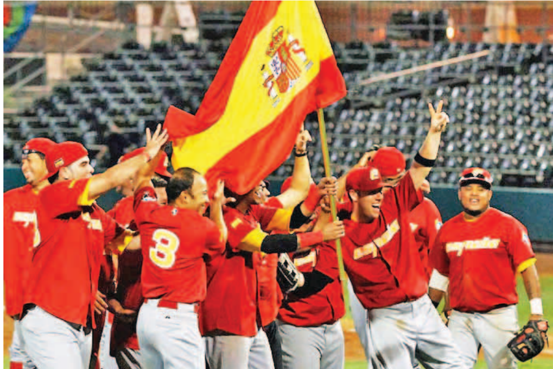
España aspira a calificar para el Clásico Mundial

España participará en el Campeonato de Europa que se celebrará en Alemania, del 7 al 15 de septiembre, y, en caso de finalizar entre los cinco primeros, asistirá al Preolímpico Europa/África, que se disputará del 18 al 23 de septiembre,