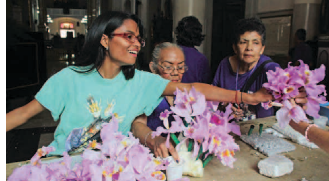
De todas las parroquias llevan orquídeas para adornar la talla de Cristo

Dijo al equipo del Correo del Orinoco , que también hay que ver la imagen del Nazareno, de Cristo cargando la cruz, camino al calvario “es una imagen que siempre ha sido muy querida por el fiel venezolano y latinoamericano, porque refleja a Cristo asumiendo sobre sus espaldas