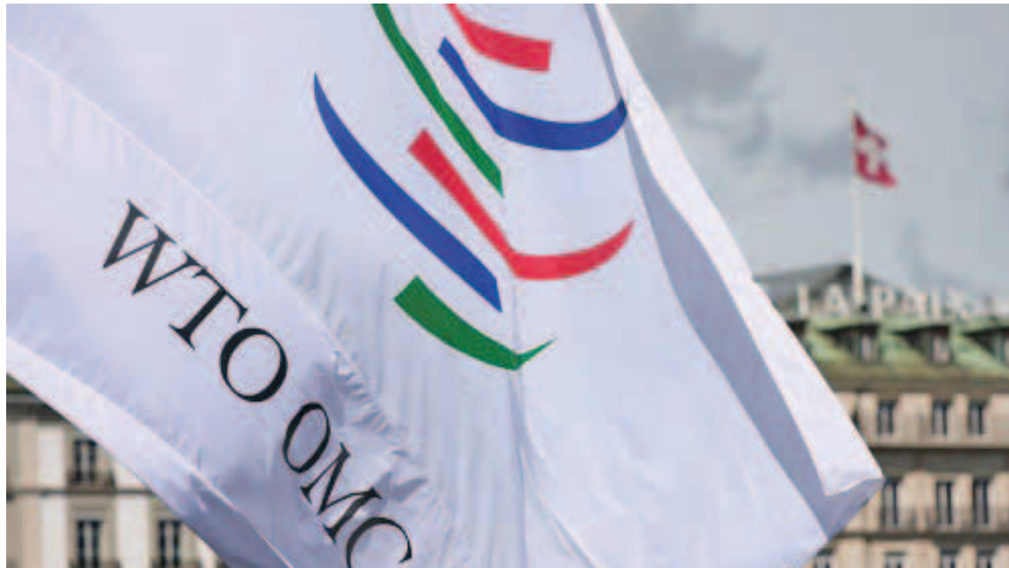
Organización Mundial de Comercio (OMC)

A través de un comunicado, la cancillería venezolana