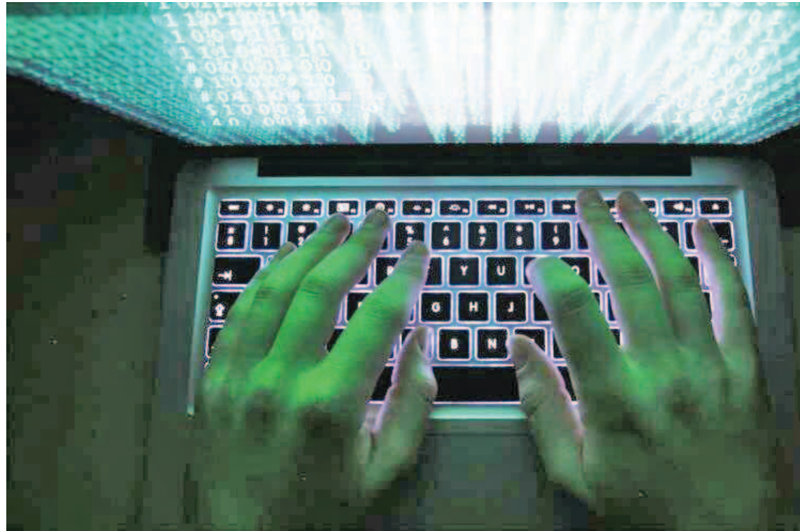
Los hackers han sido implacables con Moreno

“A raíz de que empezamos a tener estos ataques, hubo llamadas de algunos otros