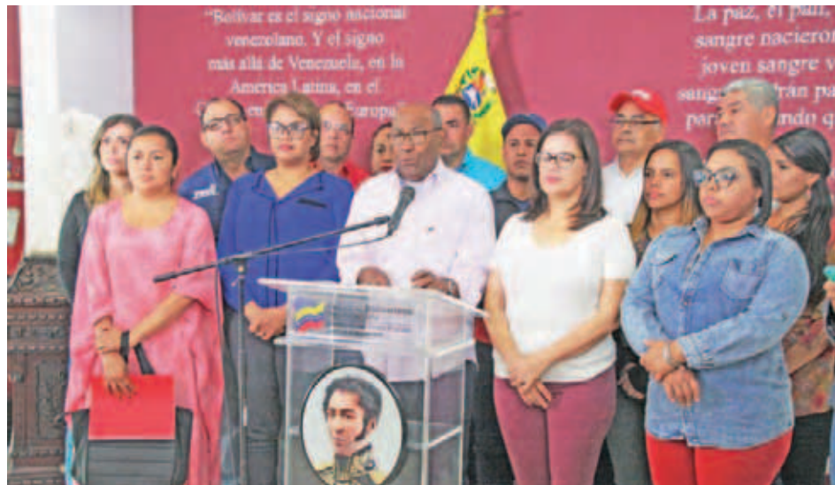
“Maduro hace esfuerzos extraordinarios para cumplir al 100% la seguridad social”

La información la dio ayer el vicepresidente Sectorial para el Socialismo Social y Territorial, Aristóbulo Iztúriz al culminar la reunión semanal del gabinete para el Área Social, quien aseveró que dicho dato es de suma importancia, ya que “aún en medio del asedio, de los ataques, del golpe de Estado que está en desarrollo, el presidente Nicolás Maduro hace esfuerzos extraordinarios por dar cumplimiento al ciento por ciento de la seguridad social como está establecido en nuestra Constitución bolivariana”, enfatizó.