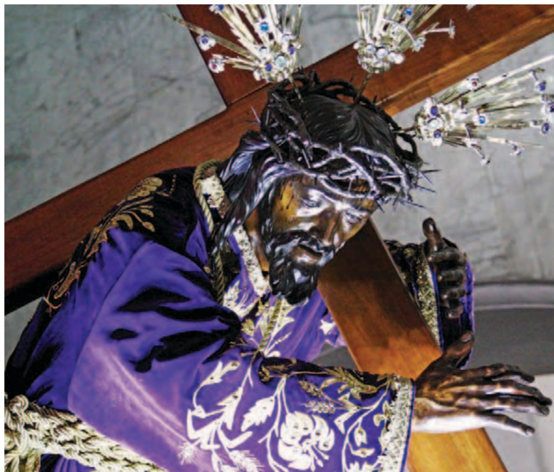
Fieles visitan la imagen del Nazareno de San Pablo a pagar promesas y pedir por la paz en Venezuela

Es el Nazareno de San Pablo una de las devociones religiosas más populares y arraigadas del país, que agrupa el mayor número de fieles, cuya fe se acrecienta cada día, por lo cual en las calles y avenidas de Caracas es común observar, el Miércoles Santo, a un gran número de creyentes provenientes de distintas parroquias y regiones de Venezuela con túnicas u otras vestimentas moradas que acuden de manera multitudinaria a la basílica de Santa Teresa, ubicada en el centro de la ciudad, para venerar a la emblemática imagen y pagar promesas por los favores recibidos.