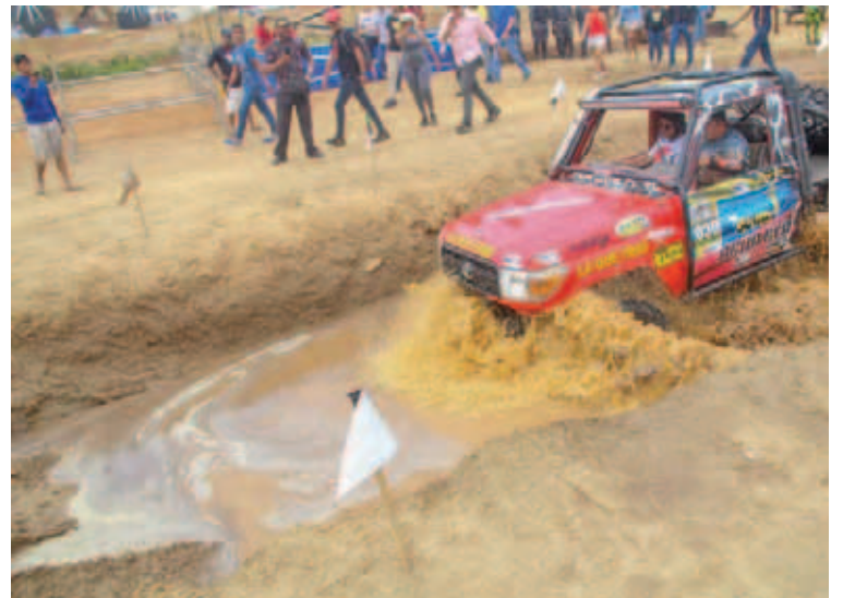
Los seguidores de los deportes extremos tienen su sitio

Según Germán Otero, presidente de la Fundación Festivales Carabobo Te Quiero, se trata de una tradición en