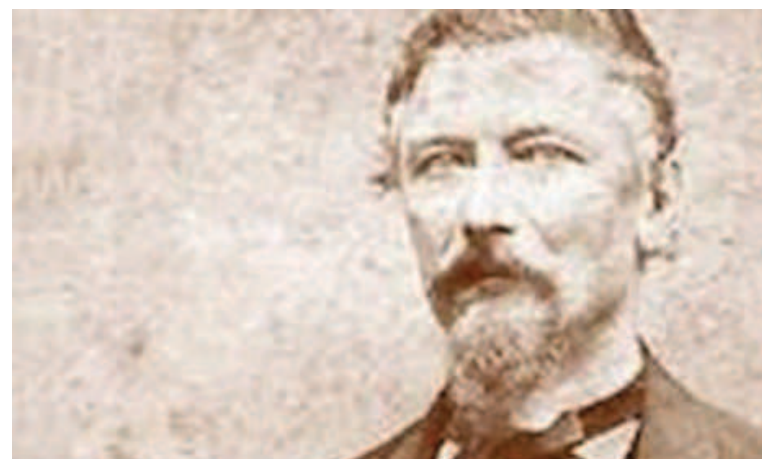
El texto plasma una de las leyendas caraqueñas más interesantes y espeluznantes

La fusión entre Venezuela y Alemania que muestra Knoche: