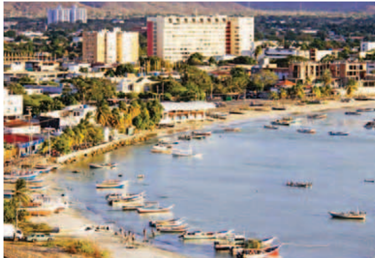
Se debe apoyar al turismo en Venezuela

Además, es generador de empleos directos e indirectos, así como un dinamizador del comercio, bienes y servicios, por ello, la institución financiera apoya con financiamiento