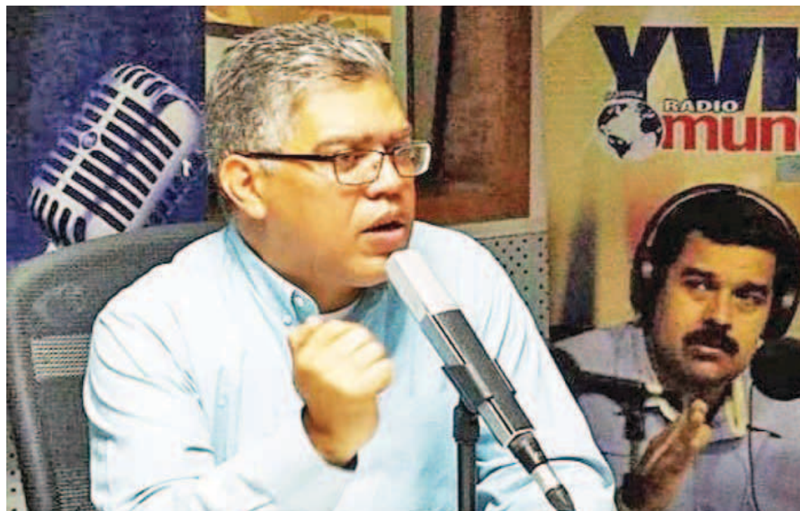
“Es un paso hacia la independencia y la liberación definitiva del país”, afirmó Jaua

Aseveró que Venezuela con la salida de la OEA da un paso hacia la independencia plena, “es un paso hacia la independencia, hacia la liberación defi-