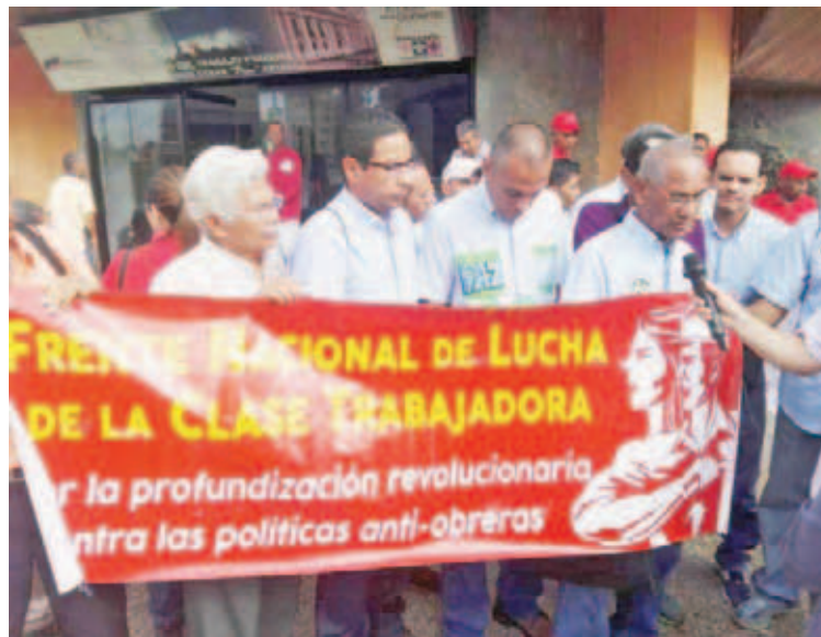
Los obreros piden la aplicación de la Ley de Consejos de Trabajadores