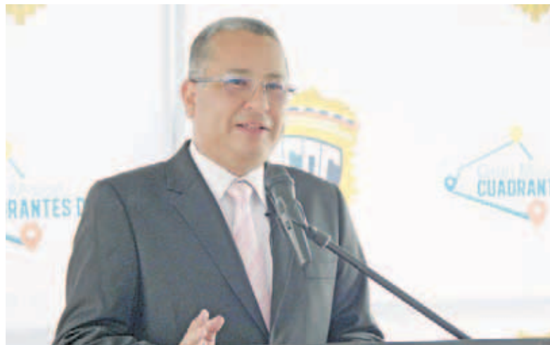
Cicpc desarticuló banda dedicada al hurto de material estratégico de Cantv

T/ Deivis Benítez Caracas