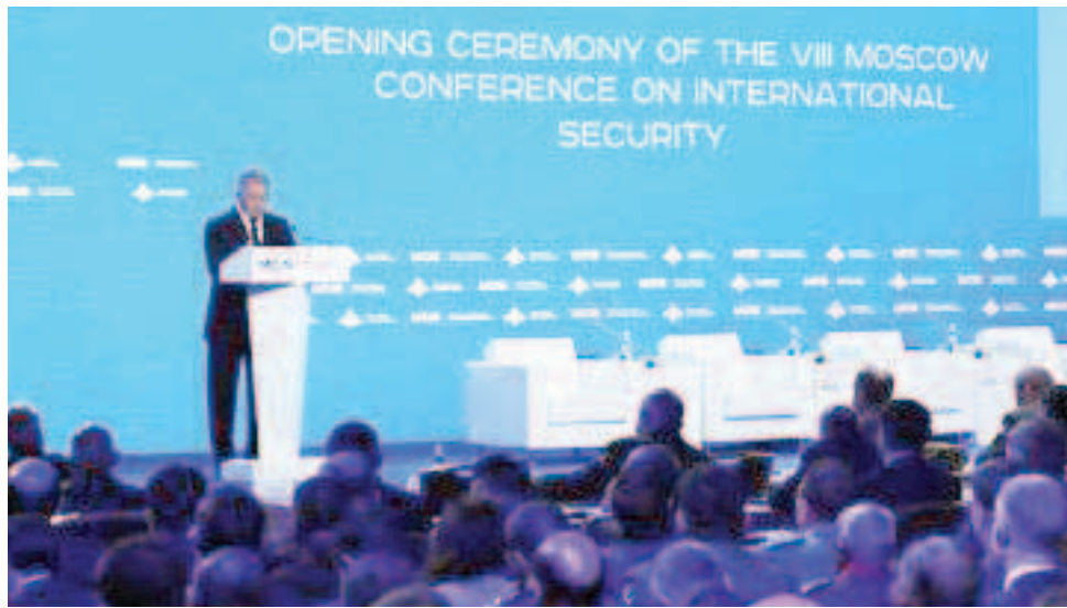
Ministro de Defensa de Rusia en conferencia en Moscú

Rusia fortalecerá las relaciones bilaterales con los países suramericanos para