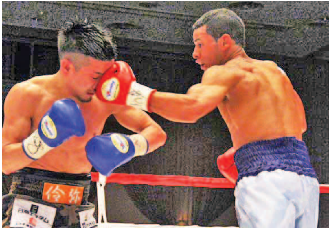
El caraqueño está invicto con 21 laureles

“Pude desarrollar mi estrategia para este pleito, considerando que mi oponente es un boxeador poco ortodoxo, que va siempre hacia adelante. Estaba bien preparado y gracias a Dios todo me salió como esperaba”,