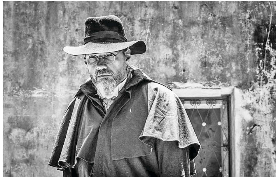
La Guerra Federal envuelve parte de la historia sobre el galeno europeo