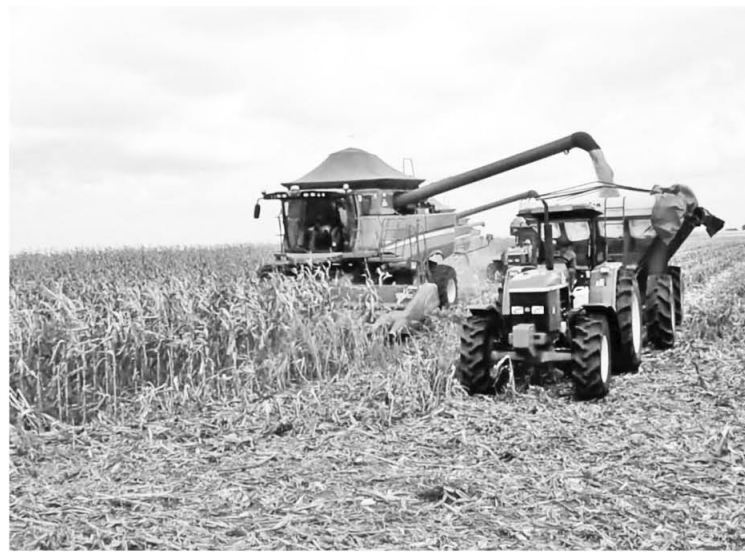
Productores privados incrementan la actividad agrícola

La harina Doña Goya, de la cual se producen unos cinco millones de kilos mensualmente, ha sido el producto insignia de esta empresa. Un 60 por ciento se distribuye por medio de los CLAP. Matos informó que la exportarían a China.