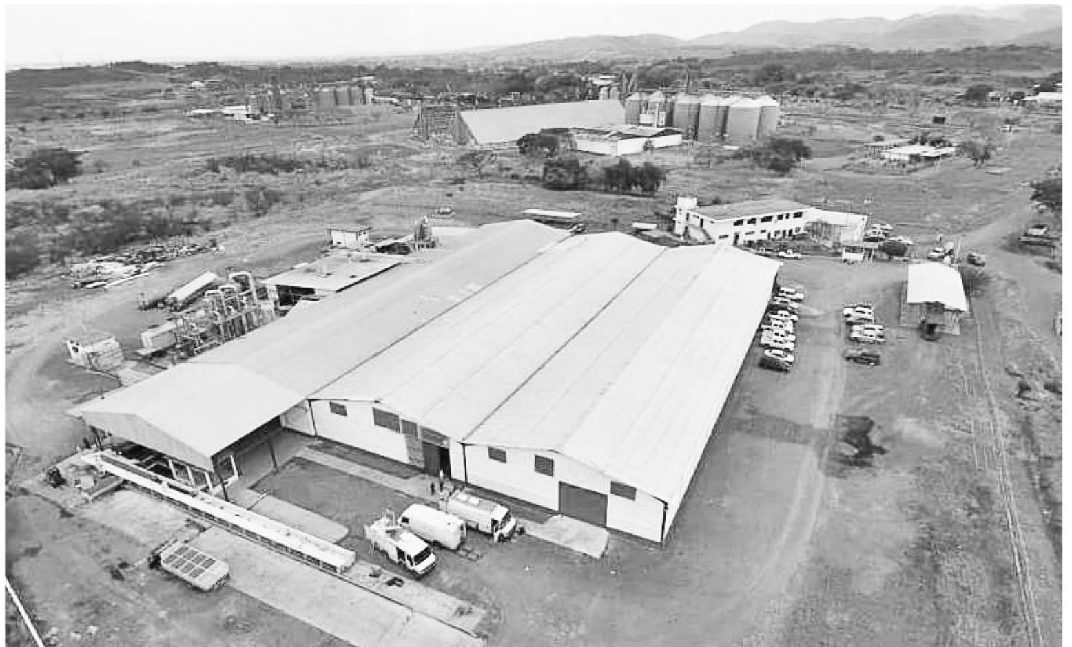
En Guárico se inauguró una planta de pasta de tomate y de elaboración de compotas

En otra intervención delineó ciertos parámetros de la visión de desarrollo: Venezuela está