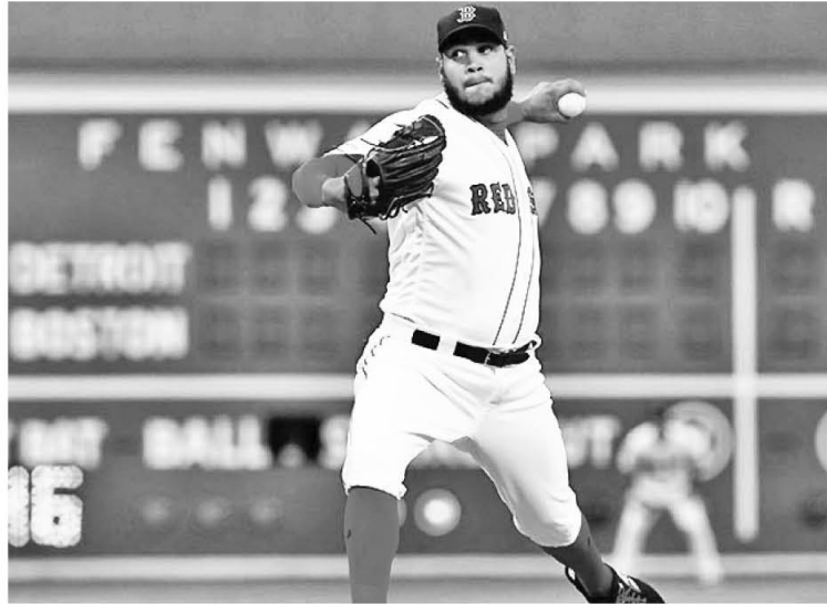
El zurdo estrenó su nueva slider ante los bengalíes

Sin embargo, y después de su presentación más dominante de la campaña, en el triunfo de Medias Rojas de Boston 11-4 ante Tigres de Detroit el miércoles por la noche, el zurdo le dio crédito por la efectividad de ese envío quebrado a Dustin Pedroia, el segunda base de los patirrojos,