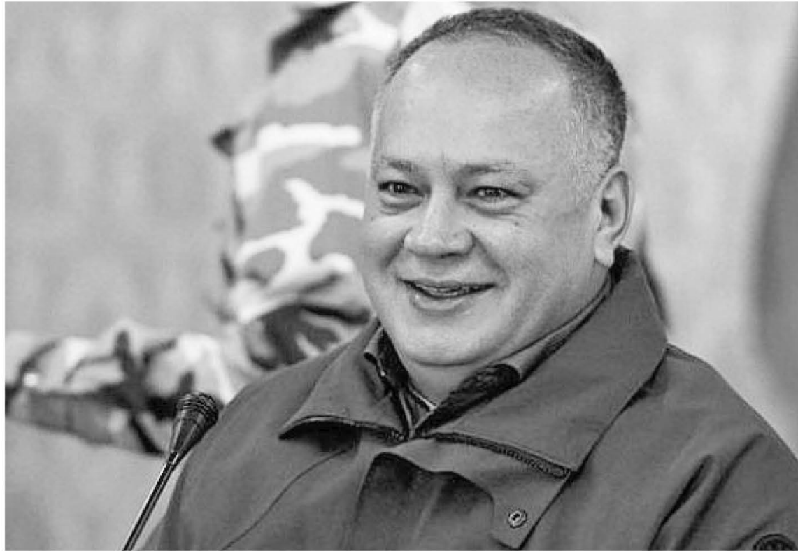
Diosdado Cabello señaló que el pueblo continuará en las calles

La población venezolana está preparada para hacerle frente a los ataques imperiales debido al nivel de conciencia que adquirió desde la llegada al poder del comandante Hugo Chávez, dijo el primer vicepresidente del PSUV