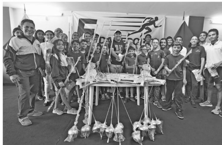
La dotación incluyó guantes, caretas, hojas de espada

El integrante del gabinete estatal aseveró que el primer mandatario de Carabobo, Rafael Lacava, apoya el deporte y reconoce los logros de quienes día a día se esfuerzan por dejar en lo más alto el nombre de todos los carabobeños.