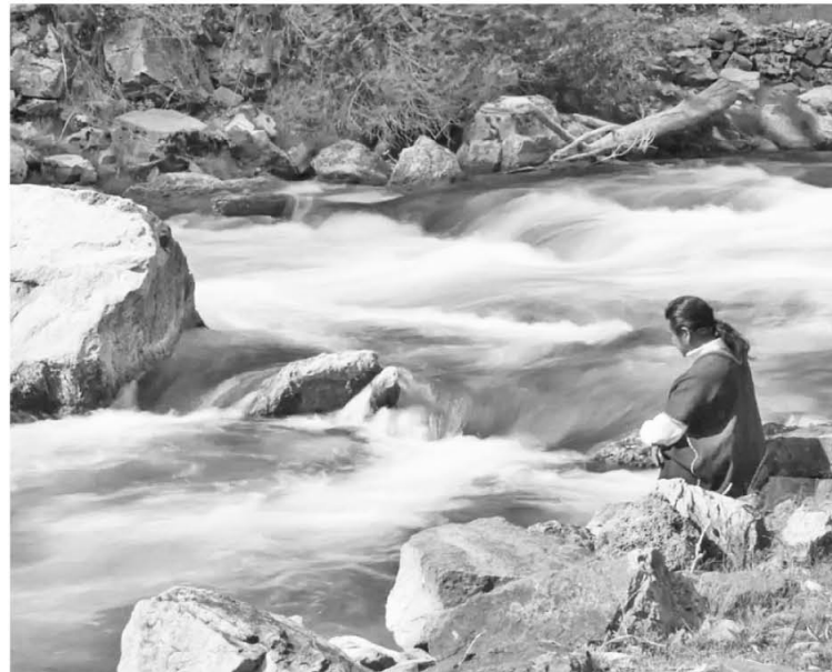
La selección oficial se conocerá en septiembre y los ganadores en noviembre

Según una nota de prensa para estimular la inscripción de trabajos en este evento audiovisual internacional, el evento