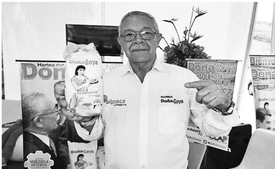
La harina Doña Goya se elabora en los llanos venezolanos

construyendo un nuevo modelo socialista-productivo con la expansión de las fuerzas productivas nacionales y con la inmensa riqueza natural y de trabajo que ofrece el territorio nacional.