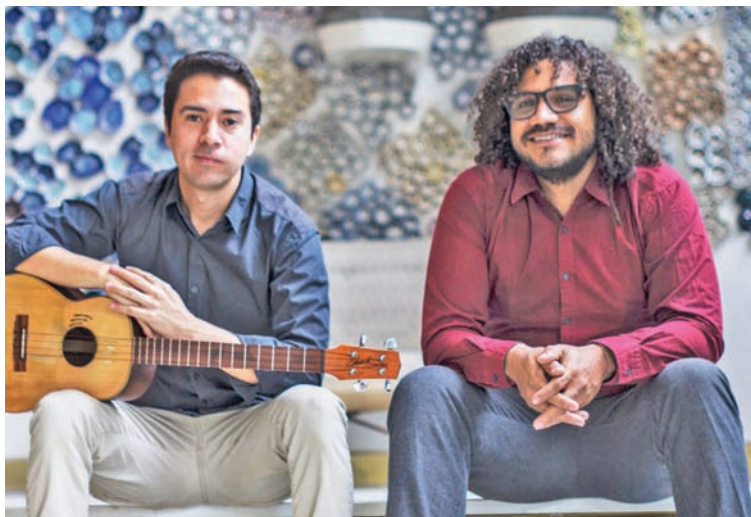
Ofrecerá temas nuevos que se incluirán en una segunda producción discográfica

T/ Redacción CO F/ Cortesía Y.A. Caracas