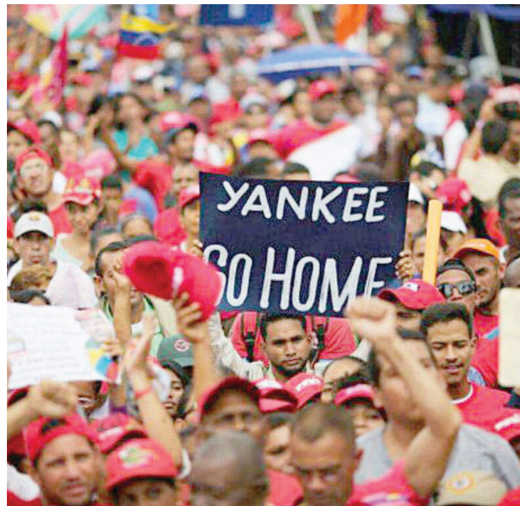
La concentración comenzará a las 10:00 de la mañana en la plaza Morelos