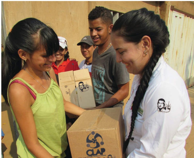
Comunidades continúan recibiendo el beneficio alimentario

Gobierno regional trabaja de manera articulada con alcaldías y consejos comunales para llevar el beneficio al pueblo