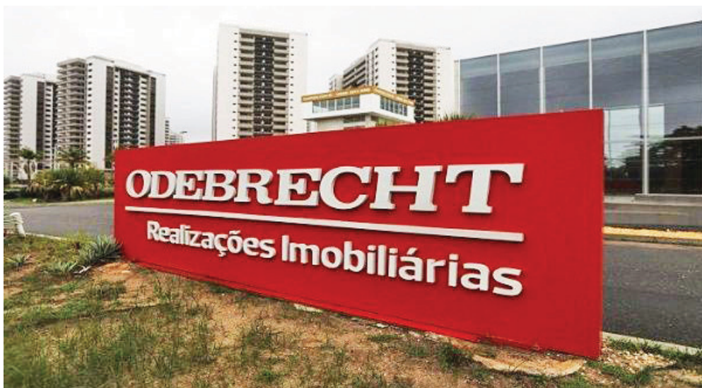
La red inició operaciones en 2011