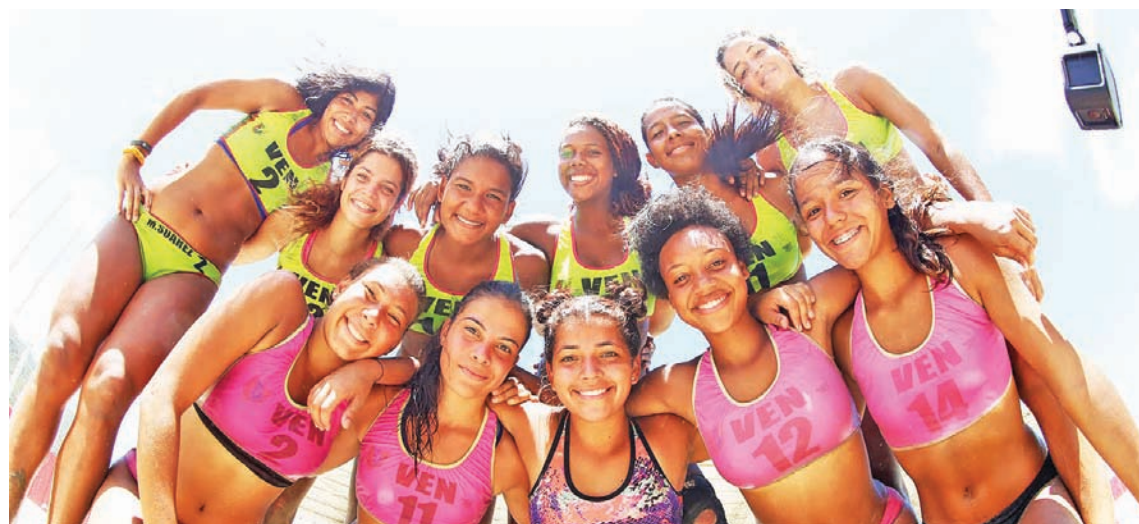
El voleibol playero estará presente en Lima 2019