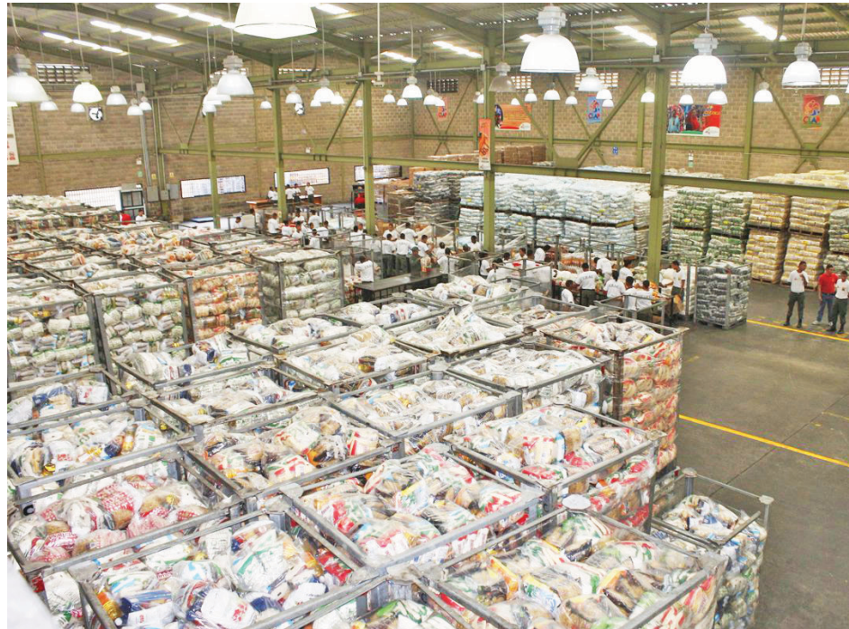
Los hechos hablan sobre los esfuerzos del presidente Nicolás Maduro