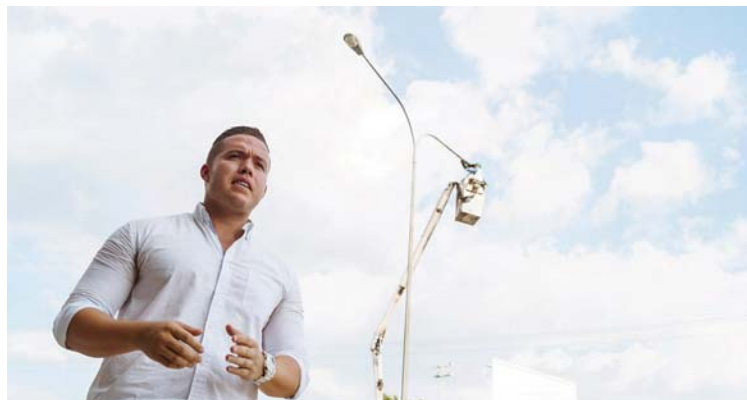
El mandatario de la localidad aseguró que continuará el plan de mejoras

“Hemos decidido celebrar con trabajo y más trabajo, por lo que en la avenida 190, con Fundanagua e Hidrocentro y el