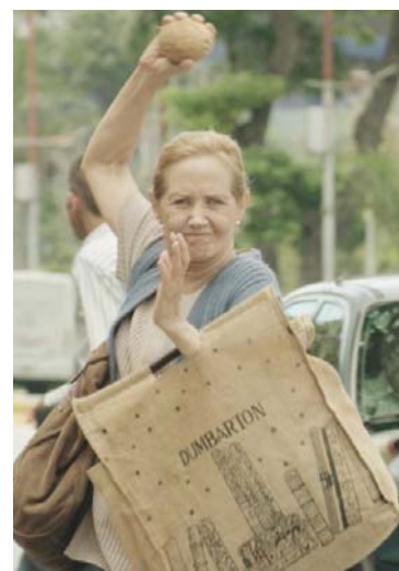
Parque Central iniciará la muestra