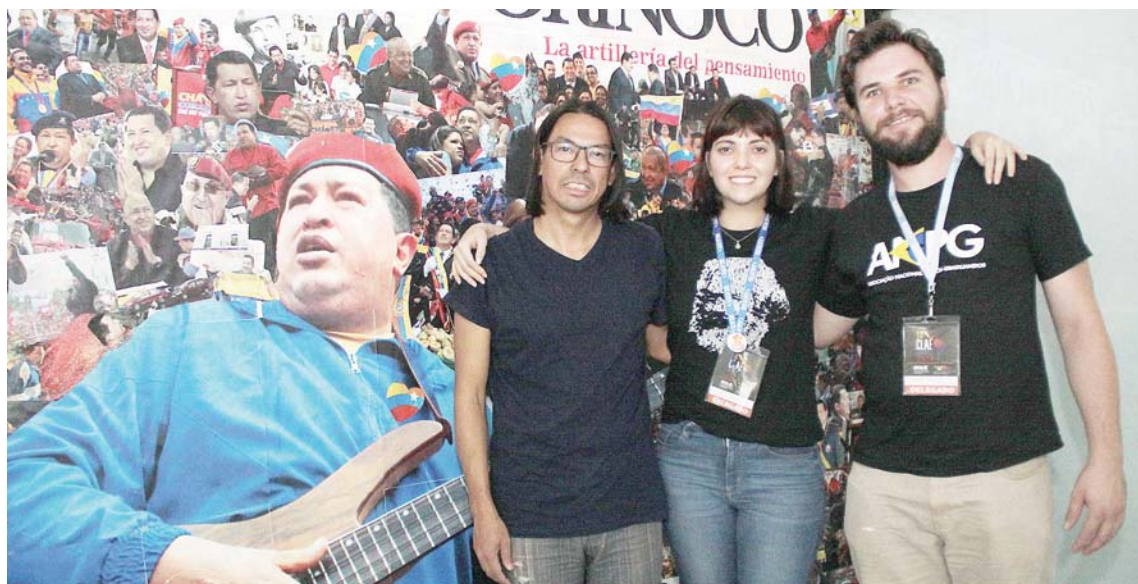
Estudiantes llaman a los venezolanos a defender las conquistas en materia educativa

Durante una visita a la sede del Correo del Orinoco, aseguraron que el pueblo brasileño vive actualmente “una situación muy complicada” por la postura proimperialista y lacaya a favor del Gobierno de Estados Unidos (EEUU) del presidente Jair Bolsonaro.