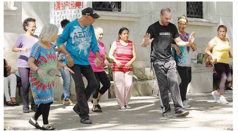
La programación será desde las 2, aproximadamente hasta las 6 de la tarde

Tres años de riguroso trabajo musical realizó el maestro Khan para la materializar Aquellos Cuatro .