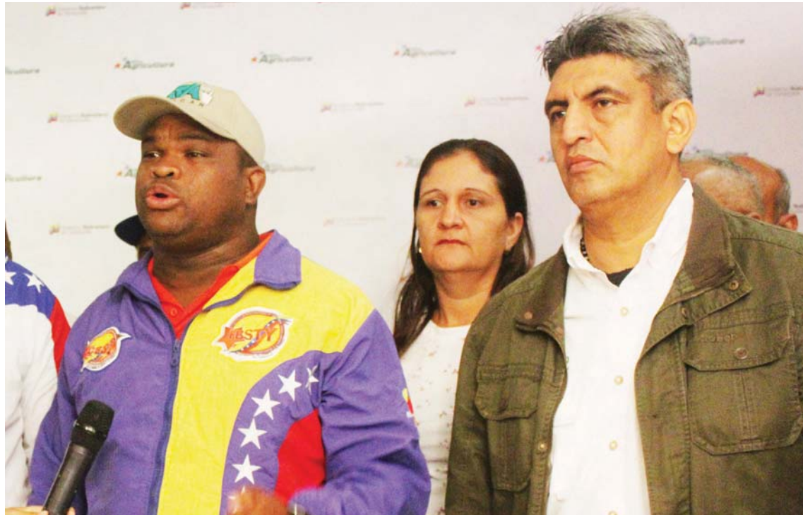
La reunión fue bastante productiva

Kassen reiteró que la propuesta presentada al titular del Ministerio del Poder Popular para la Agricultura Productiva y Tierras forma parte de un modelo de gestión humanista