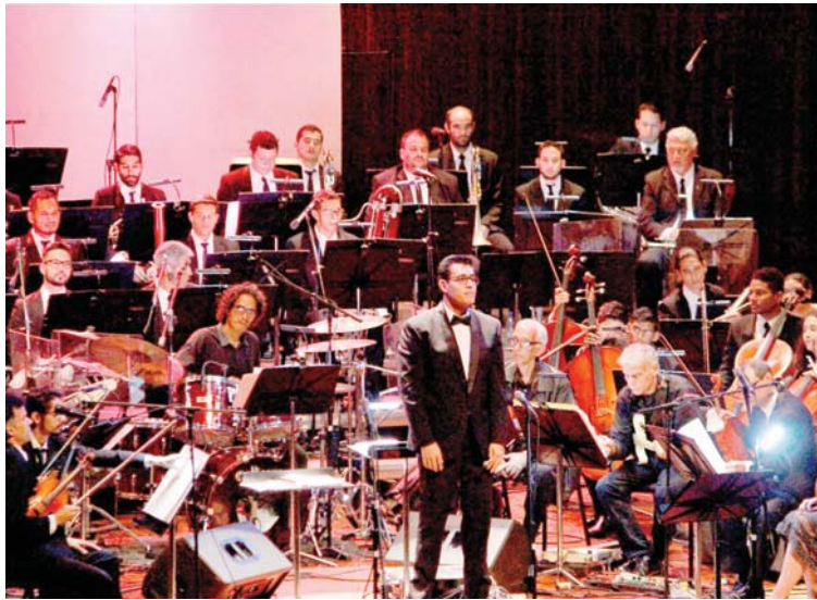
La obra sinfónica, estrenada el año pasado, regresa a petición del público

Orquesta Sinfónica de Venezuela estará bajo la batuta de Jesús Uzcátegui con arreglos de Antonio Khan