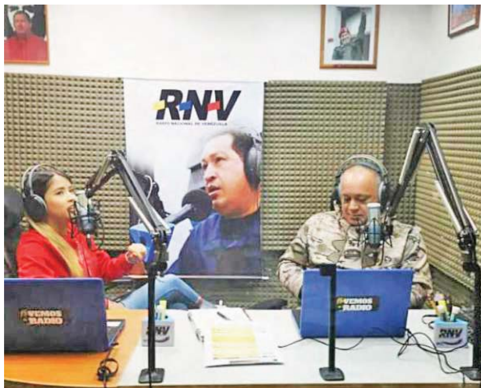
Más temprano que tarde se tomarán acciones, aseguró Diosdado Cabello

“El capitalismo nos tiene destrozados”, dijo el líder de la tolda roja luego de conversar vía telefónica con un agricultor, y expresó el desagrado que vive “cada vez que uno se entera que una mujer o un hombre que trabaja la tierra con las uñas, con esfuerzo, viene un vivo a quitarle lo que ese campesino ha producido con trabajo y sacrificio”. Al respecto reiteró que las comunas deben producir