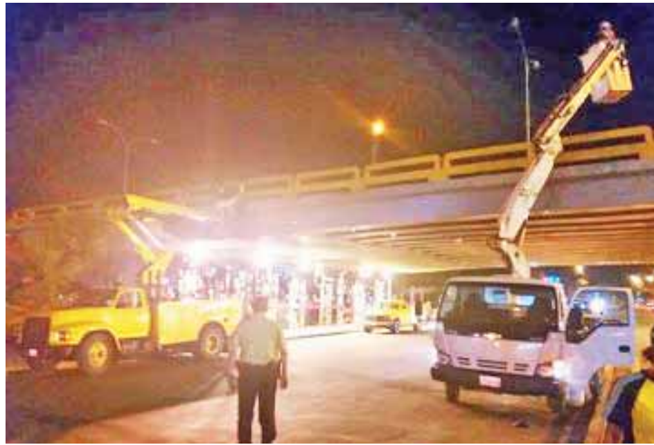
El distribuidor es uno de los más transitados de la ciudad

La Misión Venezuela Bella escogió, entre otras plazas, para su primera avanzada a Valencia, por lo que los trabajos de remozamiento en estas avenidas in-