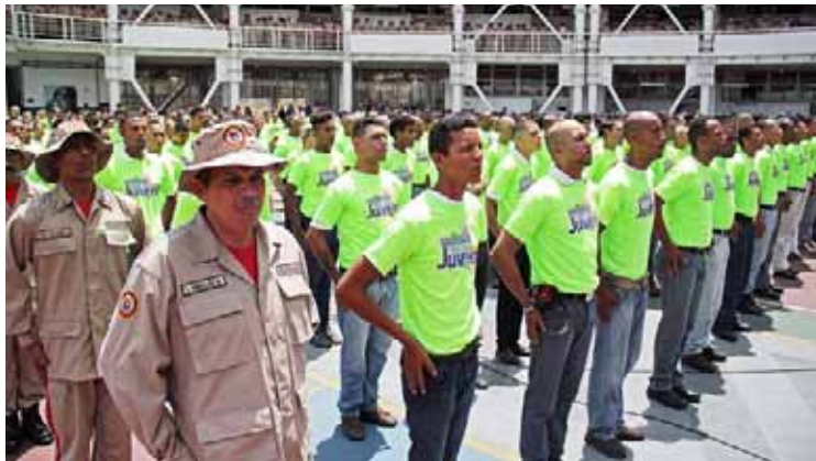
Integrantes de la Milicia Nacional Bolivariana y el Plan Chamba Juvenil serán los pioneros

“Hemos cumplido la primera parte en menos de 35 días, en