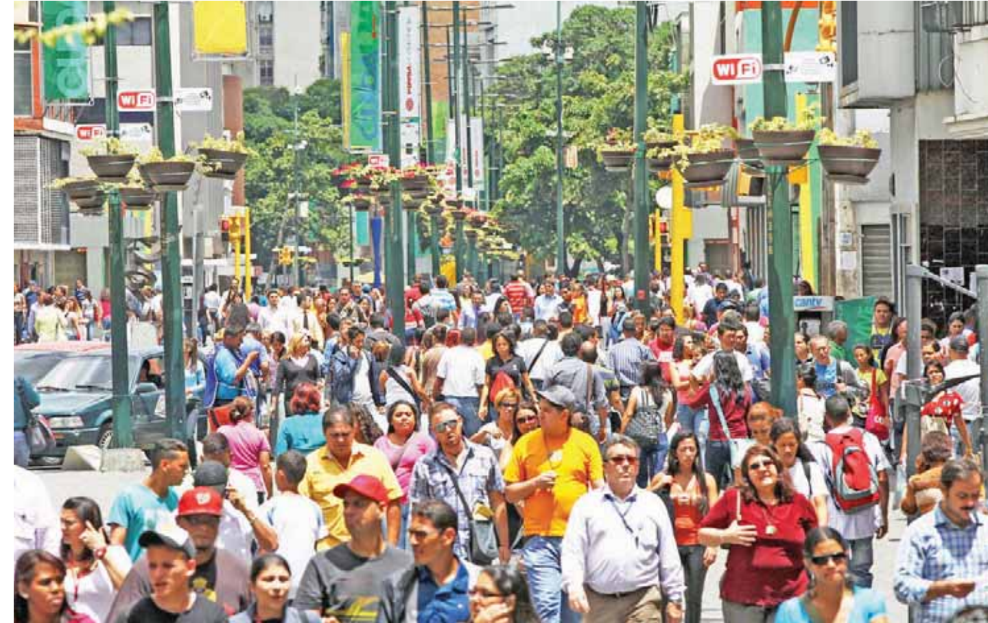
La población confía en que el diálogo traerá paz y bienestar a Venezuela

Y añadió: “Ojalá que en este diálogo en Noruega se llegue a sacar algo”. Indicó que ojalá que se pudiera hablar con esa gente, “pero en realidad no van a tener decisiones, porque lamentablemente los que los mandan son los gringos, y la oposición venezolana no se manda”. Destacó que sería sano que naciera una oposición de verdad, “pero creo que van a pasar muchos lustros para que haya una oposición en el país que sea constructora de país,