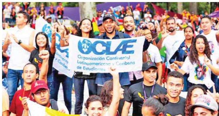
Juventud nuestroamericana consciente de su batalla por el derecho al futuro

En el tuit, expresó: “Por estos días tuvo lugar en Venezuela el 18° Congreso Oclae, espacio de