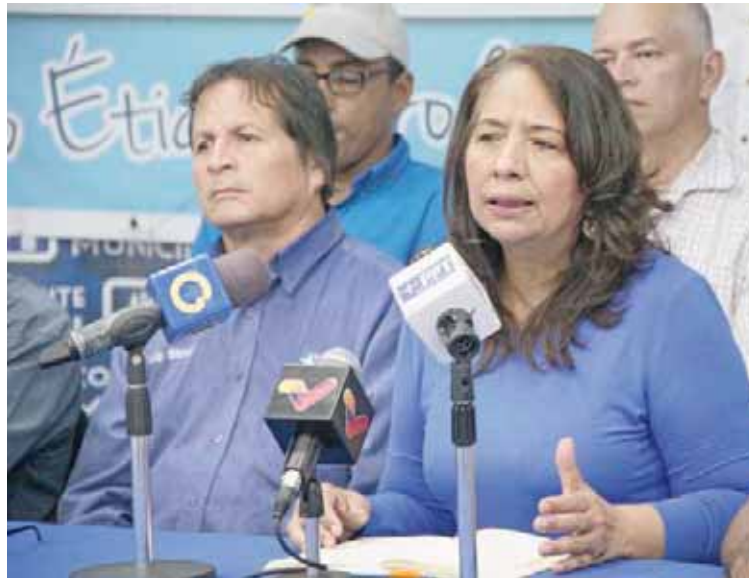
El PPT llama a revisar la concesión de las gasolineras

T/ Romer Viera Rivas Caracas