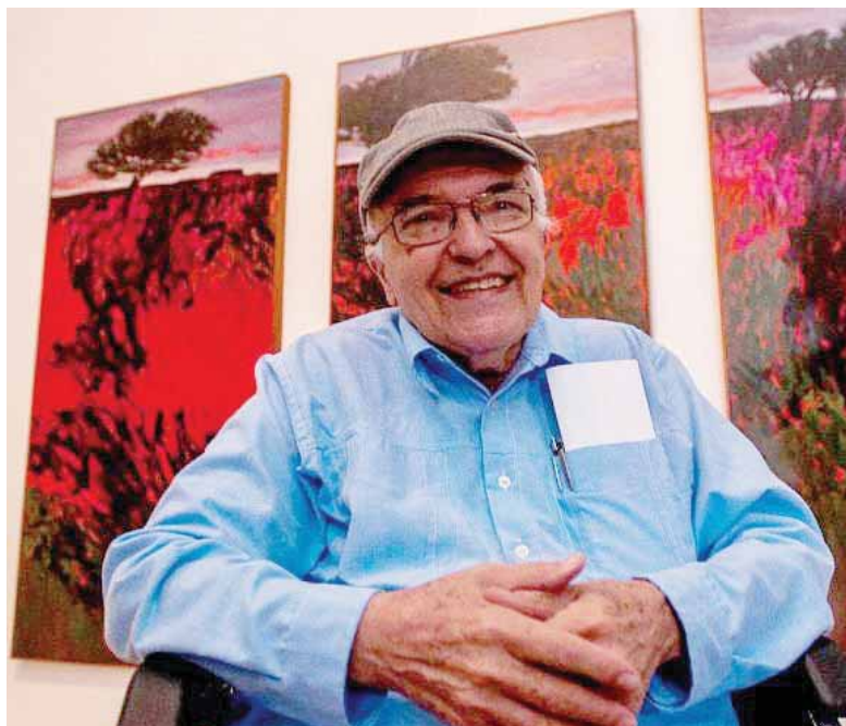
La muestra incluye unas 48 piezas