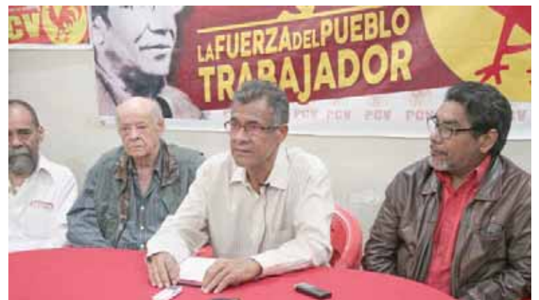
PCV denuncia supuesta participación de representantes de instituciones del Estado

Agregó que algunas empresas intentan romper las relaciones laborales mediante