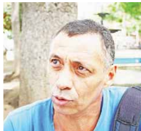
Juan Carlos Games