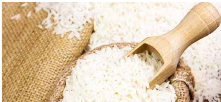
El financiamiento incluye la entrega de insumos agrícolas