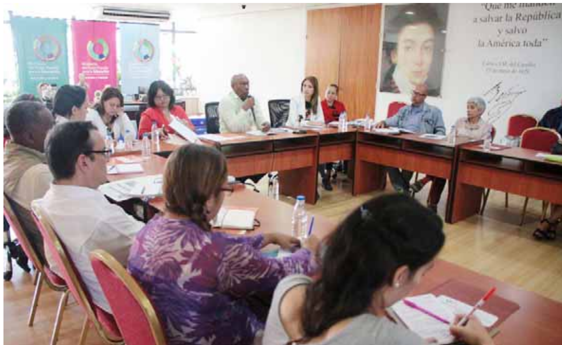
Vamos hacia una educación humanista donde lo esencial sea el ser humano, dijo Aristóbulo Istúriz

Caracas