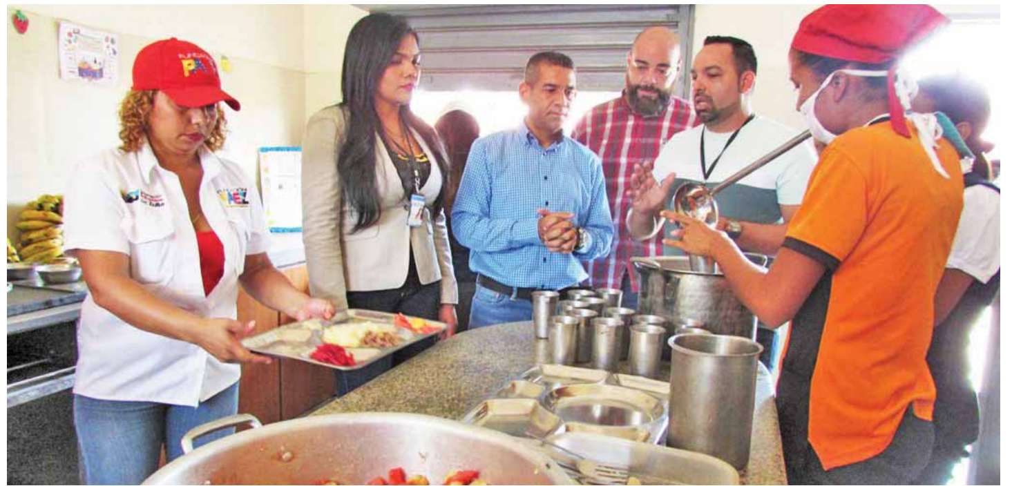
Escolares reciben alimentación balanceada

“Mientras el imperio norteamericano y sus lacayos continúan acentuando el asedio económico a la patria grande de Bolívar y Chávez, el Gobierno Bolivariano de nuestro presidente Nicolás Maduro sigue efectuando esfuerzos para garantizar una alimentación balanceada, sana y constante, ante la doble moral de quienes se creen los dueños del mundo, ante sus sanciones y pretensiones injerencistas la voluntad noble de la Venezuela bolivariana demuestra con determinación continuar