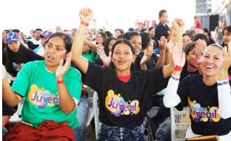
Chamba juvenil estimula la participación de los jóvenes en la producción nacional

De igual manera, Infante extendió la invitación a todos los jóvenes empresarios y emprendedores que quieran sumarse a esta capacitación que se realiza