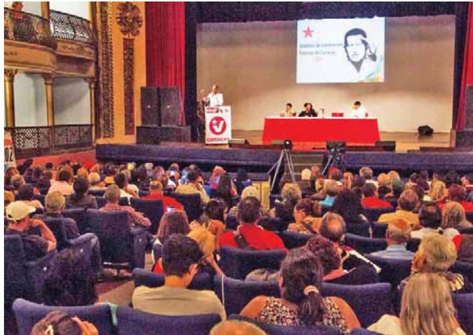
Se abordarán seis tipos de públicos

Rodríguez aseguró que son cinco las prioridades actuales del Gobierno Bolivariano: fortalecimiento de la democracia protagónica, del área social, construcción de una nueva economía, perfeccionamiento de los métodos