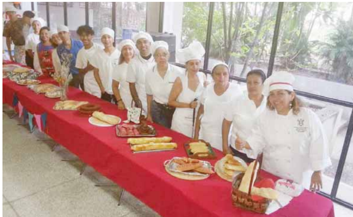
El Inces ha atendido a 20 mil personas en la entidad

Esta propuesta es una opción para las comunidades que en