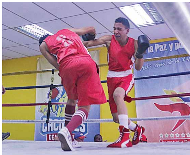
La nueva sangre suelta bien las manos

“Tenemos los nombres de los atletas que van a hacer la generación de relevo con miras a la selección nacional. Destacamos