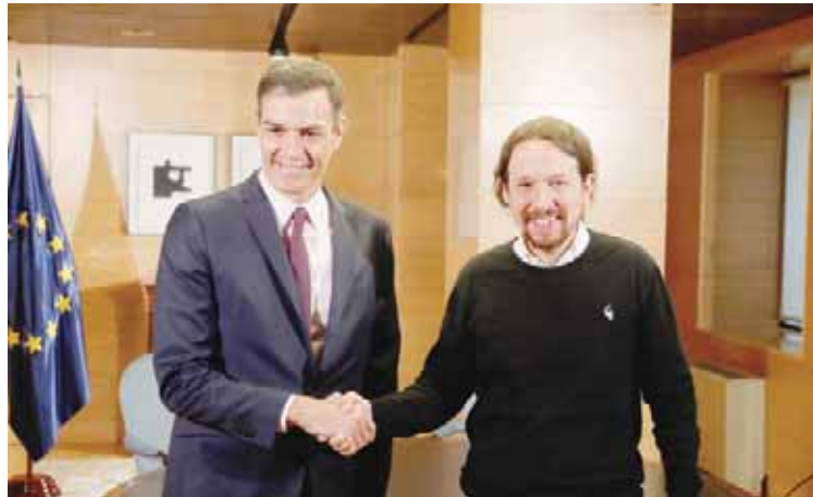
El presidente de Gobierno en funciones y el líder de Podemos luego de la reunión

“Para nosotros, un gobierno conjunto es un gobierno conjunto”. El secretario general de Podemos, Pablo Iglesias, ha arrancado de Pedro Sánchez la voluntad de acuerdo para un “gobierno plural”, “un gobierno progresista” que recoja las sensibilidades progresistas que los votantes expresaron en las urnas, confirmaba minutos después Adriana Lastra, portavoz del PSOE. El líder de Unidas Podemos ha subrayado su predisposición a ser el socio preferen-