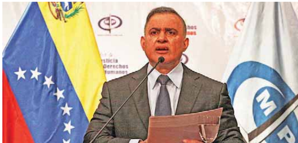
Ministerio público ha recibido 3.656 casos de corrupción

Tarek William Saab manifestó que en la audiencia preliminar se han desarrollado nueve sesiones en las que el Ministerio Público ha presentado 18 acusaciones y se han librado 15 órdenes de aprehensión. “Muchos de ellos se encuentran protegidos en Colombia y Estados Unidos”, dijo. De igual manera, por el caso del intento de golpe de Estado, el fiscal general de la República precisó que hay 34 personas investigadas, de las cuales 17 fueron detenidas e imputadas.