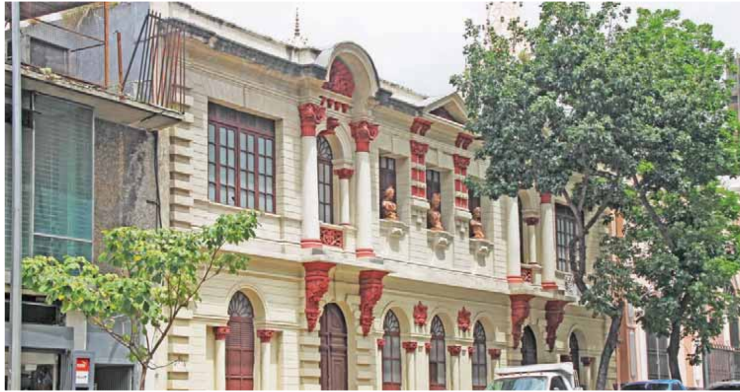
Escuela Superior de Música José Ángel Lamas en la avenida Urdaneta

Desde hace cinco años el profesorado, el estudiantado y demás personal de esta venerable institución, desempeña sus labores en medio de las incomodidades de un sótano de la Biblioteca Nacional, a la espera de la paralizada remodelación de su antigua sede. La Lamas es la más antigua escuela de música del país y la de mayor prestigio y renombre