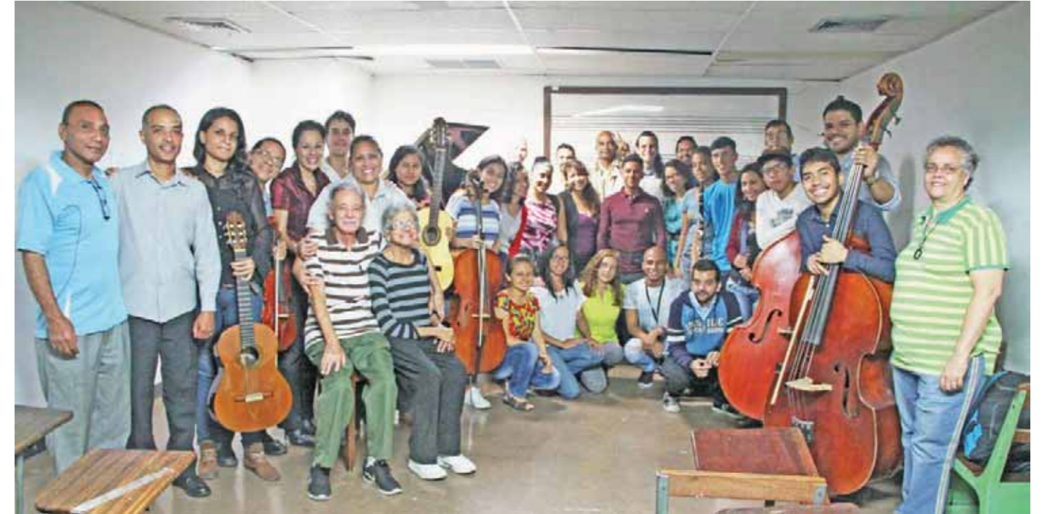
Estudiantes y profesores de la escuela

Expresa el maestro Igarza que el presidente de la República Luis Herrera Campins quiso convertir la escuela Lamas en un conservatorio moderno, pero vino la cuestión de los títulos universitarios, y las cosas se complicaron. Luego, con la remodelación de la sede, se encontraron restos de interés arqueológico, y los trabajos se paralizaron.