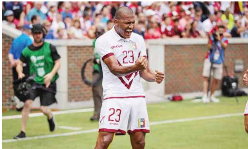
El olfato goleador es innato para el oriundo de la zona caraqueña de Catia

Con apenas 29 años puede aumentar la marca en esta Copa América 2019