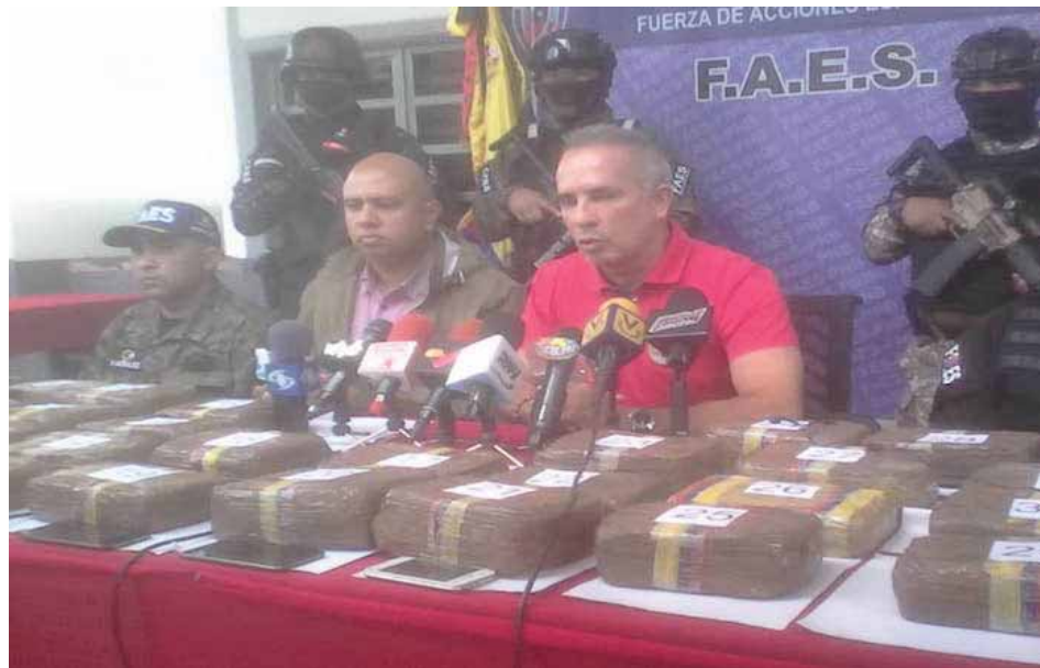
Hasta la fecha se han incautado tres mil kilos de cocaína en la frontera

Indicó que como parte de la lucha contra el narcotráfico el Gobierno de la República Bolivariana de Venezuela rea-