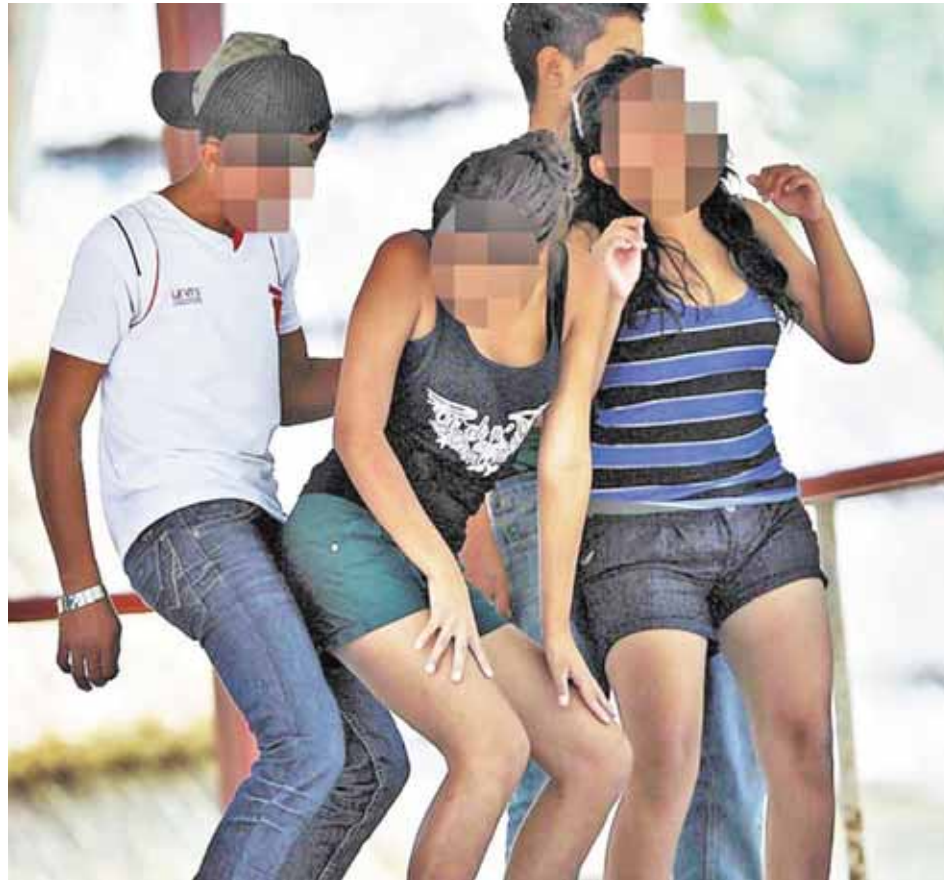
El análisis fue reseñado por el portal comunidad-biologica.com

Estos mensajes negativos, dice el análisis, tienen especial impacto en adolescentes y jóvenes, el grupo social más vulnerable frente a este tipo de música, ya que en esta etapa vital es frecuente dejarse llevar por los estímulos externos repetitivos, mientras que se desautoriza