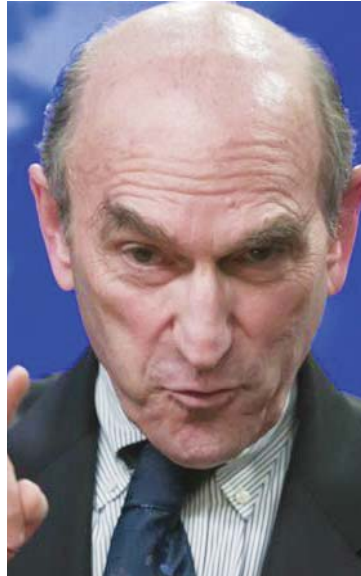
Elliott Abrams ocultó información al Senado norteamericano sobre la matanza de El Mozote

“Le vamos a enseñar al resto del país y el mundo que sí se pueden dar (medidas de) reparación, que no se habían hecho en el pasado porque, probablemente, no había la voluntad