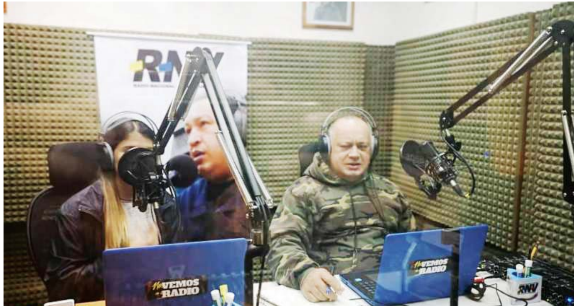
Al parecer, la olla de corrupción opositora fue destapada por María Corina, comentó Cabello

En su programa Nos Vemos en la Radio, Cabello sostuvo