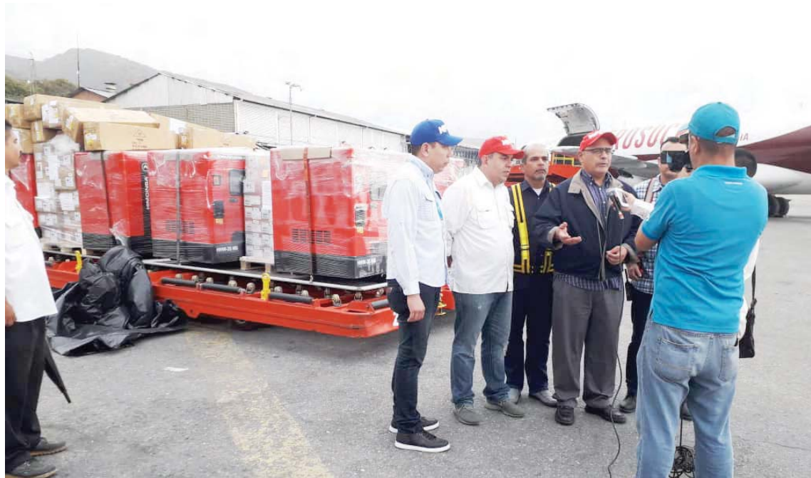
El país ha recibido por medio de la Cruz Roja 569 toneladas de medicamentos

El ministro del Poder Popular para la Salud, Carlos Alvarado, precisó que este