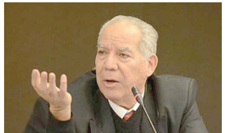
“No hay ningún país que esté cumpliendo al 100 por ciento con los derechos humanos”, afirmó

Saltrón aseveró que Venezuela es uno de los pocos países que establece en su Constitución Nacional derechos sociales y culturales, los cuales se cumplen progresivamente. Ex-