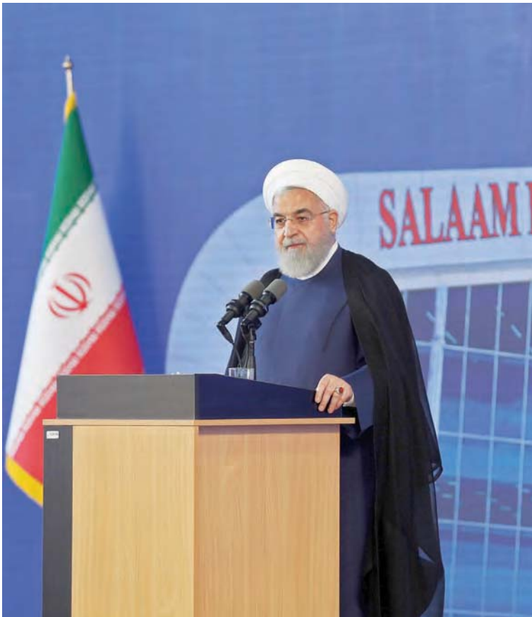
Rohani señaló que el pueblo de Irán mantendrá la esperanza y la espiritualidad

“Los enemigos nunca ganarán esta guerra contra la nación iraní”, afirmó Rohani, en un discurso durante la inauguración de una terminal en el Aeropuerto Internacional de Teherán