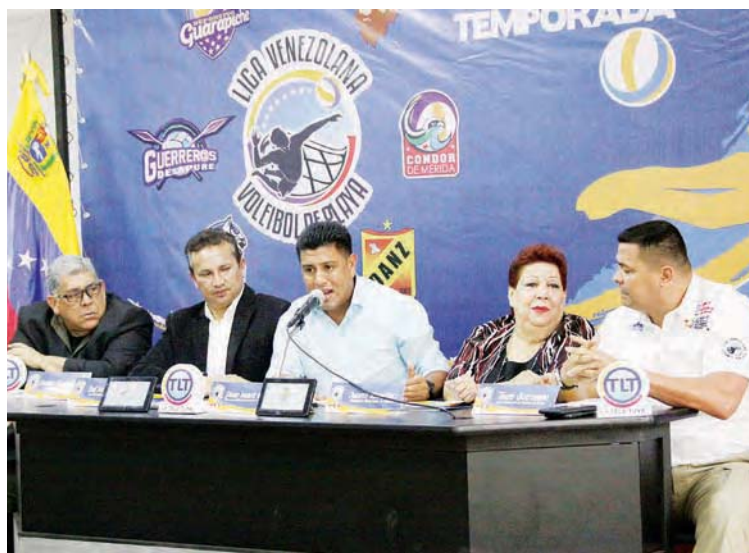
El deporte es una prioridad para el presidente Nicolás Maduro Moros

La justa contará con la participación de los equipos. Los seis clubes en pugna estarán divididos en dos grupos de la siguiente manera: Grupo Centro-Occidental: Guerrero de Apure, Llaneros de Guárico y Cándor de Mérida;