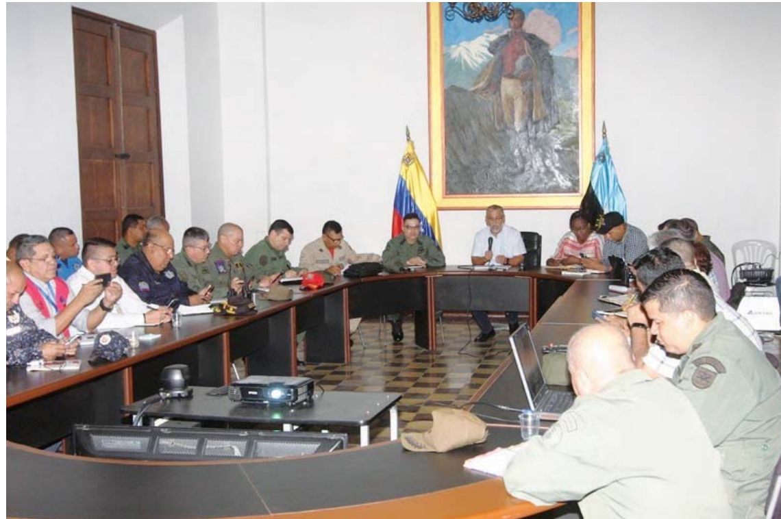
Autoridades intentan controlar las largas colas en las estaciones de servicio

Efectivos de la Fuerza Armada Nacional Bolivariana (FANB) y Polimaracaibo se encuentran desplegados en las estaciones de servicio de la capital zuliana para supervisar y