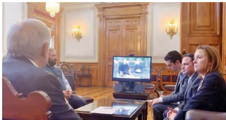
López Obrador solicita la colaboración de Facebook para democratizar Internet

“Si tú lo consideras interesante te invitamos a participar para poder hacer una sociedad. Sería algo extraordinario que