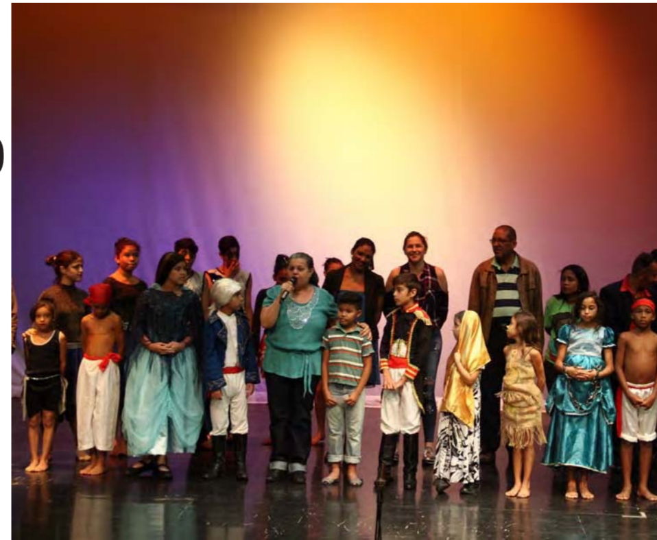
Fueron brillantes las actuaciones de los niños, niñas y jóvenes que en la escena