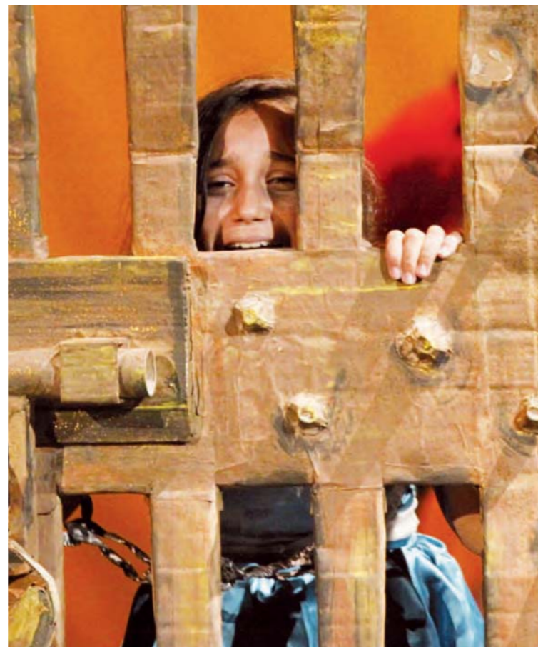
Niña enalteció el coraje y la dignidad Luisa Cáceres de Arismendi en su lucha por la libertad