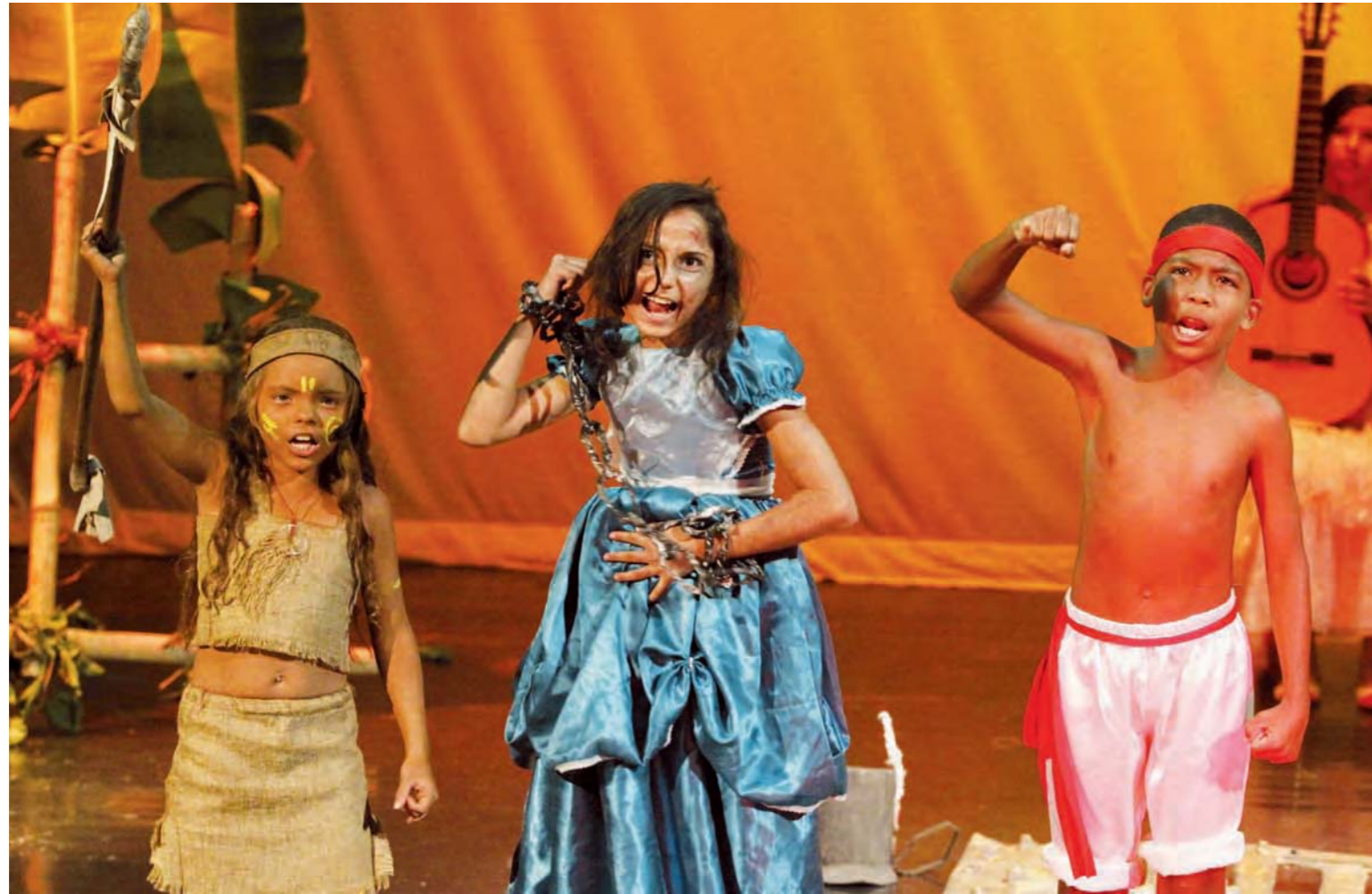
Dieciséis obras fueron escenificadas durante el II Festival Estudiantil de Teatro César Rengifo que se realizó en el contexto del Día Nacional del Teatro