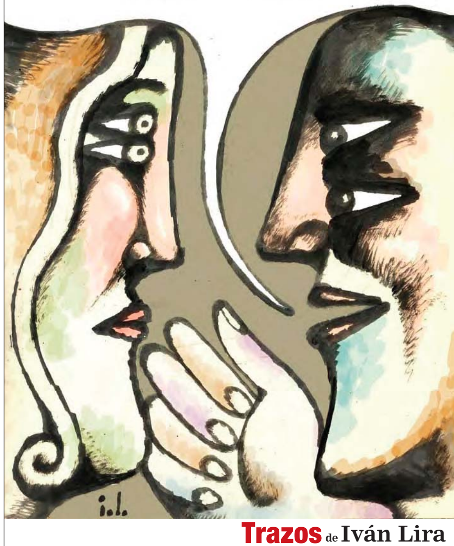
Trazos de Iván Lira