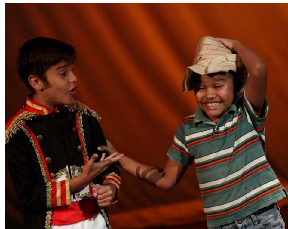
Bandera soy, fue la segunda obra en escena, donde fue recreado un sueño del comandante Hugo Chávez, en el cual conversa con Simón Bolívar