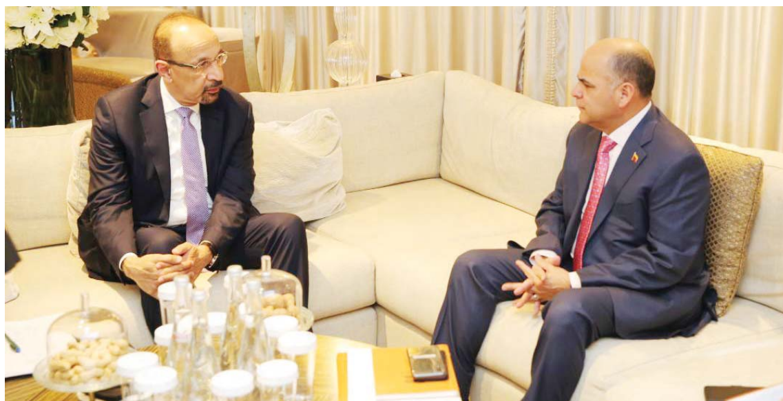
El ministro Quevedo preside la Conferencia Ministerial de la OPEP 2019

Los ministros de Venezuela y Arabia Saudita también evaluaron la posibilidad de extender la Declaración de Cooperación, firmada en diciembre 2016 y seguir fortaleciendo las decisiones para mantener la estabilidad del mercado petrolero con niveles de producción que atiendan la demanda y el nivel de inventario necesario