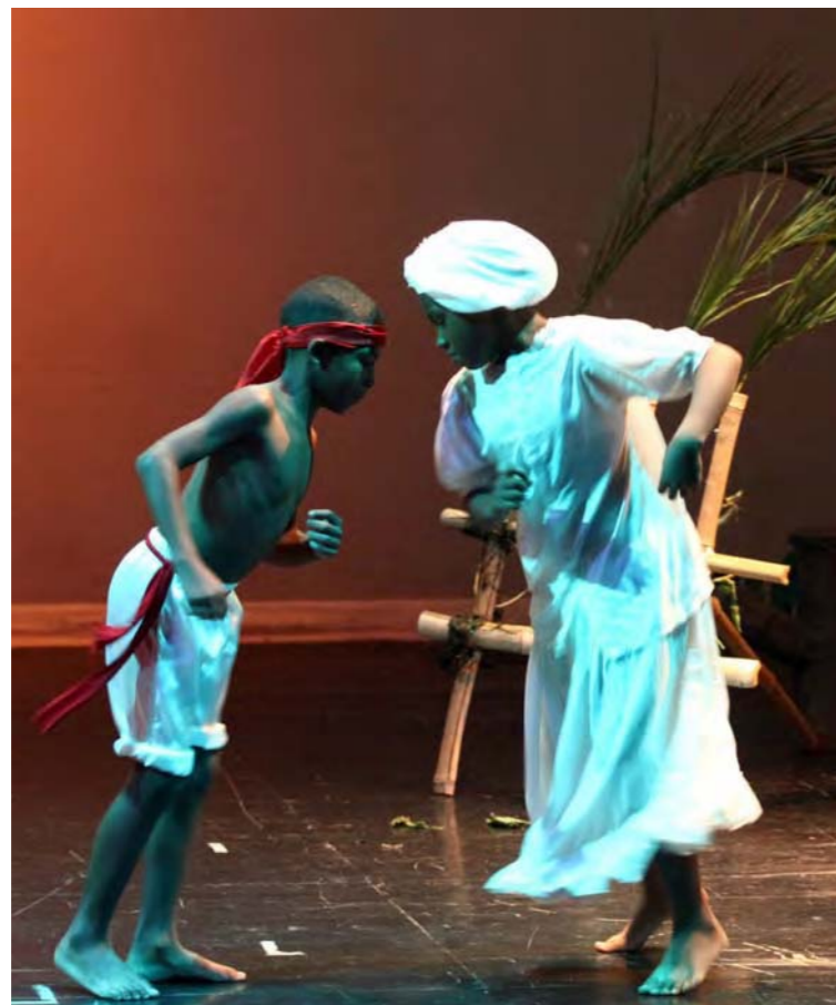
El tradicional baile de tambor formó parte de la escena, el cual recoge las reflexiones que compartían los esclavos sobre la opresión que vivían