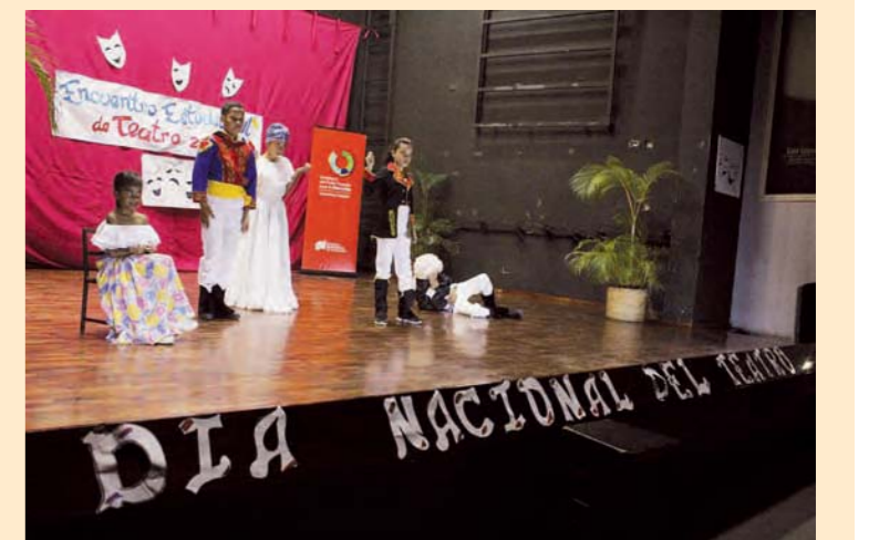
La historia fue tema central en las obras presentadas en Los Teques, para celebrar el Día del Teatro F/Prensa Gobernación de Miranda

Cabe destacar que tanto el personal administrativo, como los docentes de las escuelas, escenificaron la obra Madre solo hay una”, que llama a la reflexión.