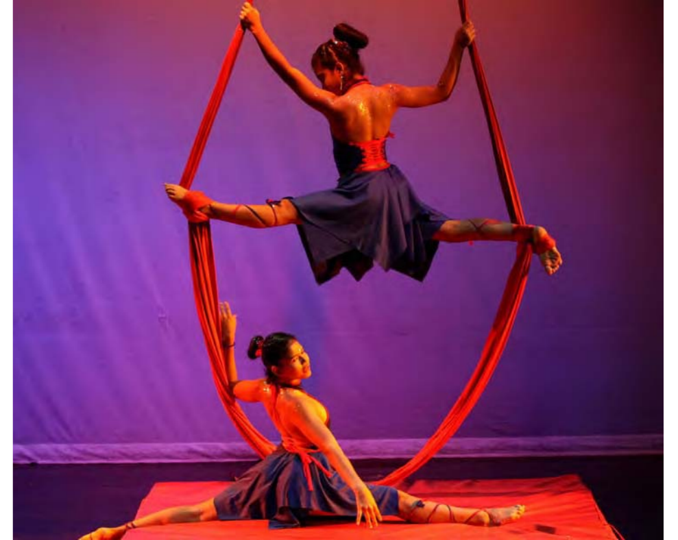
Estudiantes de la Escuela de Artes Visuales Cristóbal Rojas, de Caracas ofrecieron un extraordinario espectáculo de malabarismo y manejo de aros y cuerdas