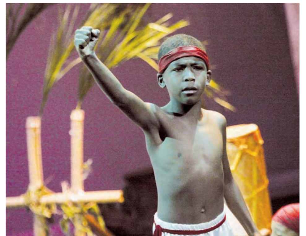
En esta gran gala de teatro fue destacada la interpretación de José Leonardo Chirinos, quien lideró el levantamiento de los negros contra el dominio español