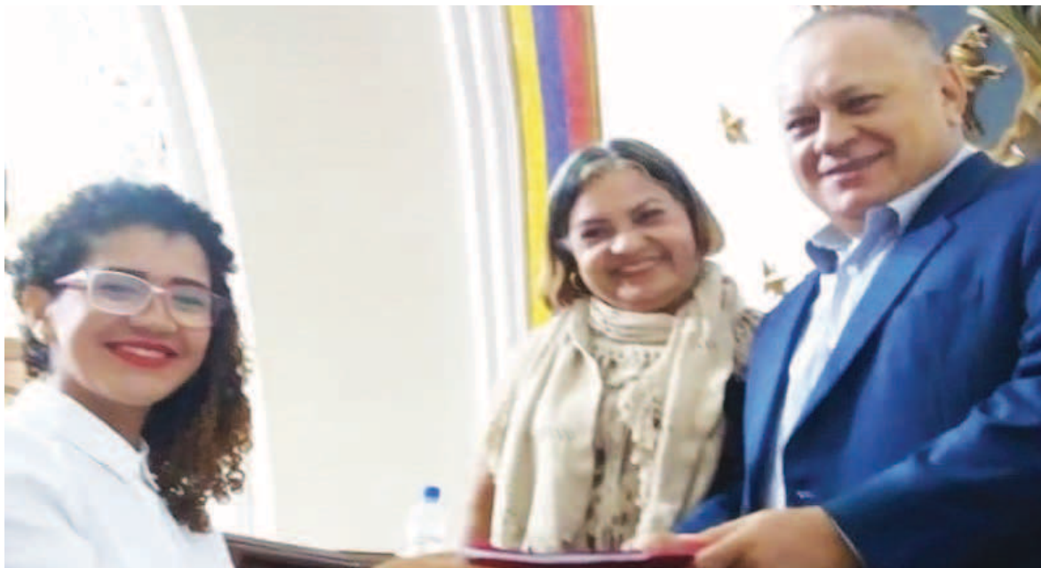
El documento fue redactado en la Comisión Permanente Constitucional de la ANC

Sobre la actividad, que se llevó a cabo en el Gimnasio Ver-