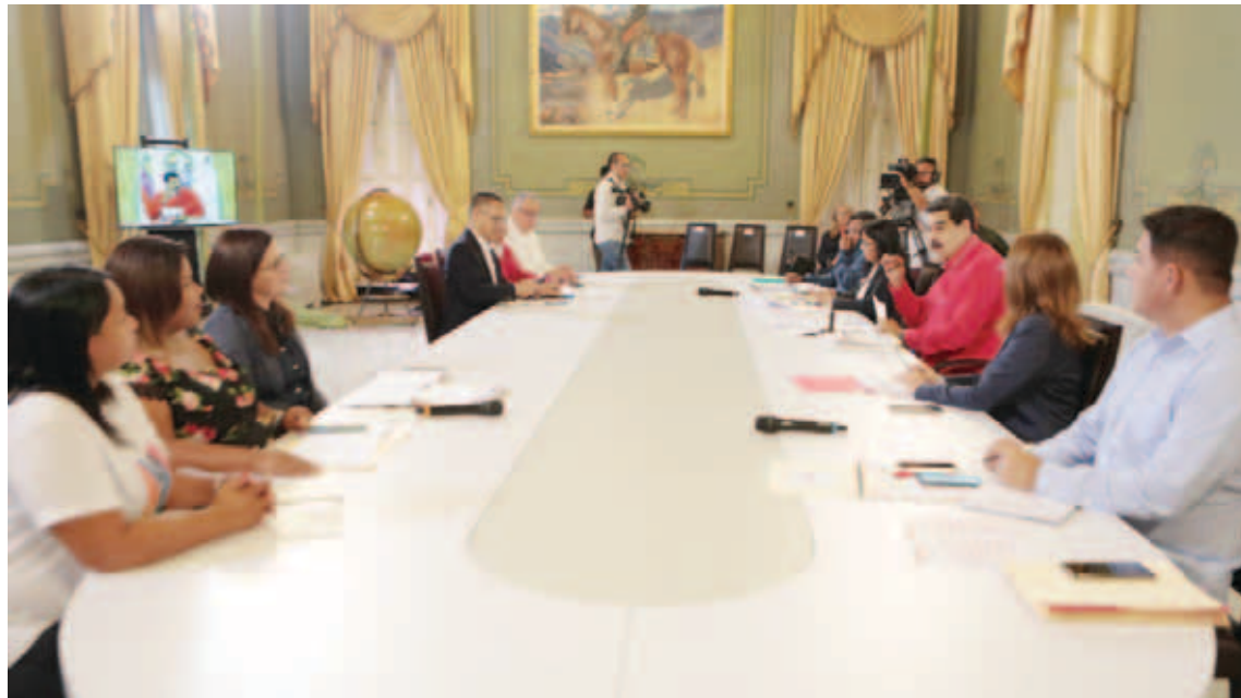
Más de una docena de edificaciones de diferentes lugares del país serán atendidas

Este presupuesto se orientará al mantenimiento, recuperación y restauración de infraestructura de valor patrimonial a escala nacional, de acuerdo