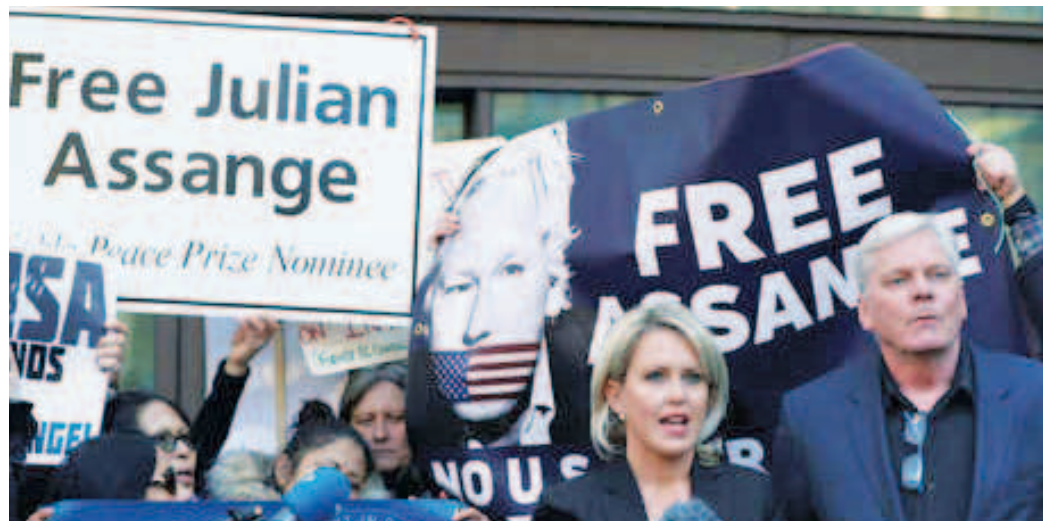
Le hicieron homenajes en 60 ciudades del mundo

El fundador de Wikileaks continúa a la espera de que se resuelva su proceso de extradición a Estados Unidos, país que sostiene contra él una acusación de espionaje y conspiración que podría acarrear una pena