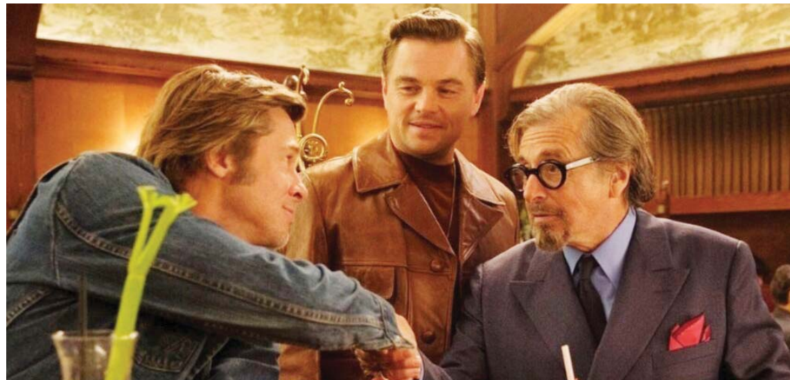
DiCaprio interpreta a un reconocido actor en la curva descendente de su carrera

Ya en 1997, con Jackie Brown , Tarantino rindió un homenaje a un género que tuvo su auge en la década de los 70 del siglo pasado, identificaron como Blaxploitation o filmes de explotación negra, caracterizado por el protagonismo de la comunidad afrodescendiente. Más adelan-