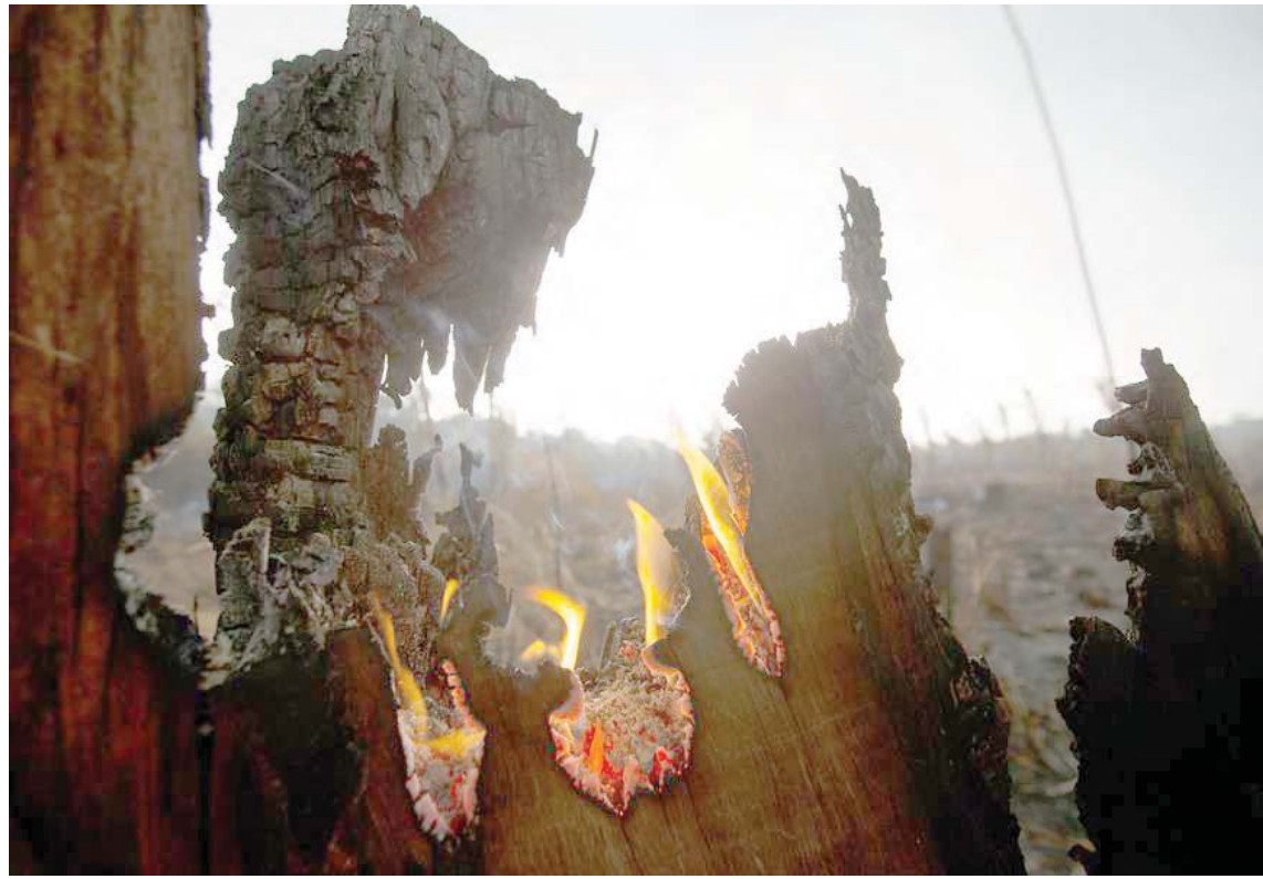
Es una emergencia de derechos humanos, dijo a la organización en defensa de las minorías

Mediante un comunicado explicaron que estos incendios forestales son considerados como una emergencia para el planeta, “y tienen razón, pero, es más una emergencia de derechos humanos para el millón de indígenas que han vivido de manera sostenible en estas tierras desde tiempos inmemoriales”.