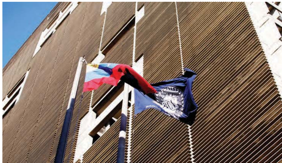
El BDV se acerca más a sus usuarios.

En esta primera fase, BDVenlínea empresas permite consultar el histórico de operaciones y la posición consolidada; realizar transferencias a cuentas propias, a terceros BDV, a terceros referen-