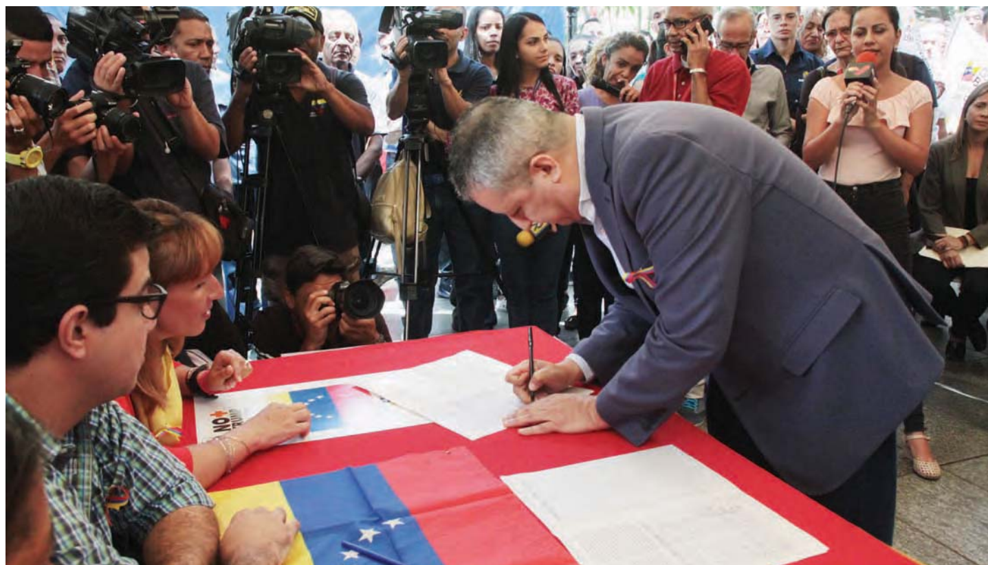
Venezuela tiene derecho a la autodeterminación, aseguró Contreras

El pueblo venezolano, aseguró, está firme y decidido “a no aceptar, como lo hemos hechos en otros tiempos, ninguna intervención, no habrá sanciones que