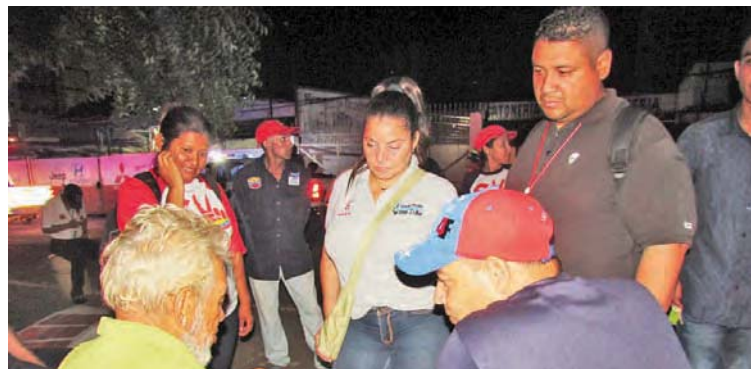
Se desplegarán por todas las parroquias de Maracaibo

T/ Redacción CO Caracas