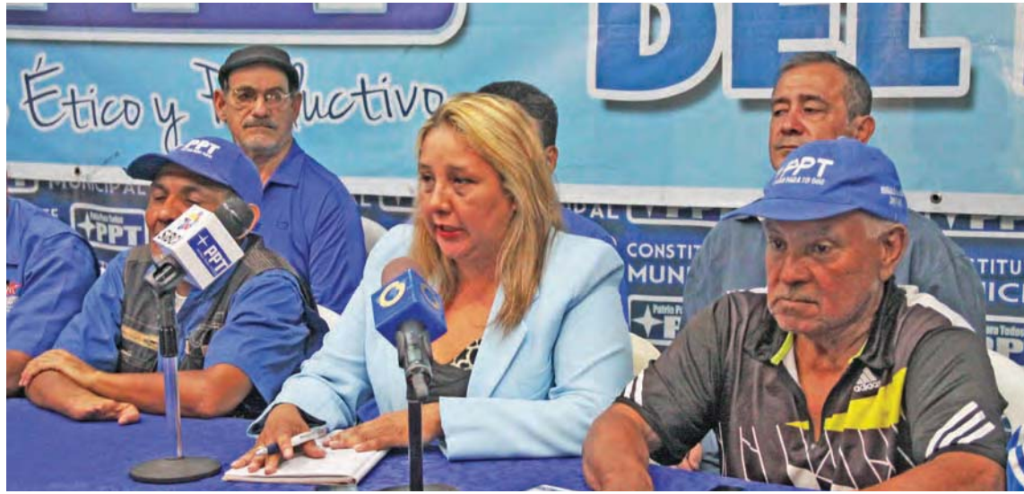
PPT considera que la reconversión monetario de 2019 dejó puntos pendientes