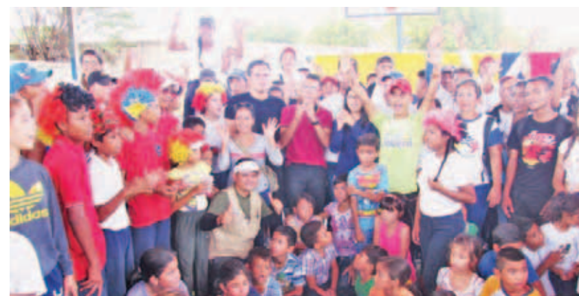
Niños y jóvenes disfrutarán de actividades recreativas y culturales

“Hoy nos encontramos en el municipio Maracaibo junto al equipo del Ministerio de Educación, la Juventud del Partido Socialista de Venezuela (Jpsuv), el Movimiento Nacional de Recreadores y los responsables de cada institución que integran las mesas del Buen Vivir, en el lanzamiento del Plan de Escuelas Abiertas por la Paz”, expresó el servidor público.