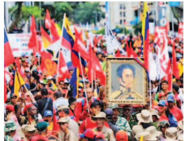
Juzgaron la política de Trump de violadora de los derechos humanos

“La arremetida de Trump no mide si afecta a un chavista o de oposición aquí dentro de Venezuela, en las comunidades. Trump, debes dejarnos gobernar y dejarnos vivir tranquilos, nuestros asuntos internos los resolveremos nosotros mismos, debes alejarte para el bien nuestro y de la humanidad”, reclamó.