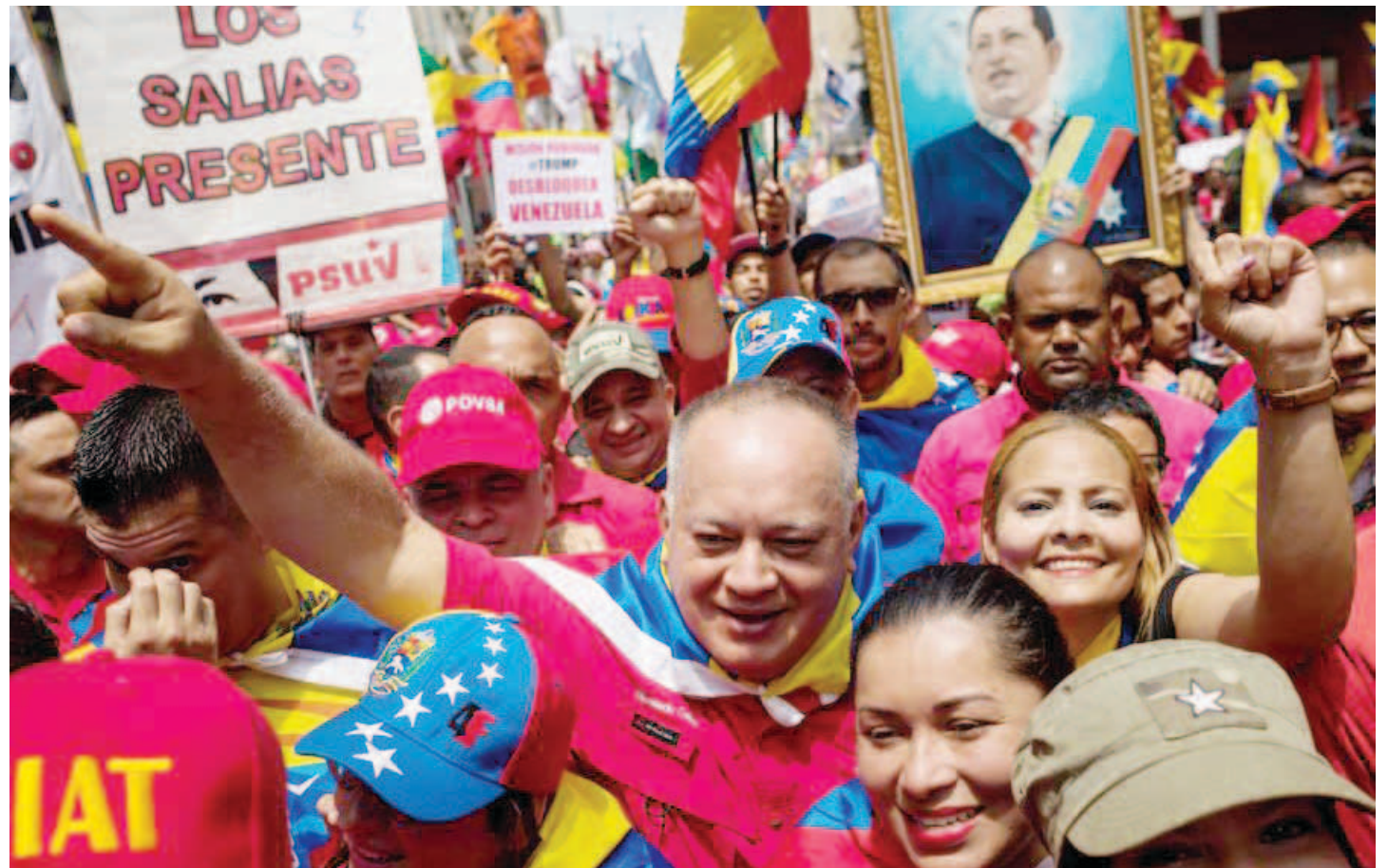
“No nos vamos a cansar de dialogar con quien sea y donde sea por la paz”, aseveró Cabello

Al referirse al sector opositor, Cabello, quien es el presidente de la Asamblea Nacional Constituyente (ANC), aseveró que con al emitir dicha orden,