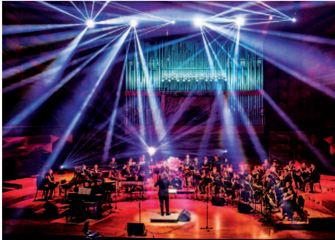
Las funciones serán los días 10, 11 y 12 de este mes, todas a las 4:00 de la tarde

De acuerdo con una nota de prensa, en cada una de las funciones habrá repertorios distintos, con la intención de mostrar la capacidad interpretativa y la