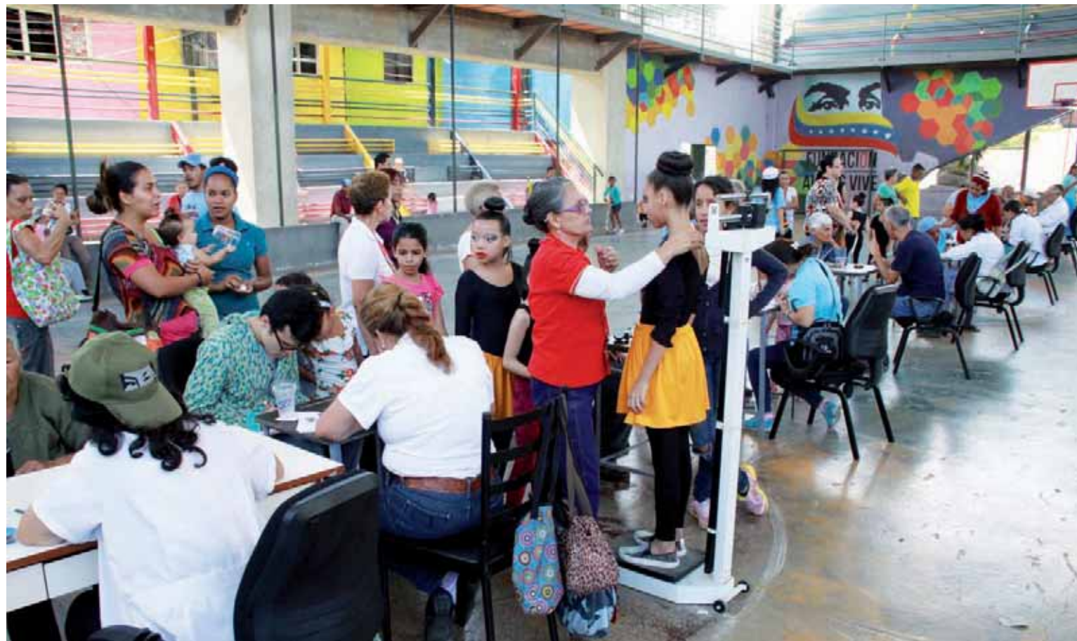
Medicinas y asistencia gratuita en diversas especialidades recibieron los habitantes del 23 de Enero

Habitantes de los bloques 26, 27 y 28 participaron en el operativo de salud que incluyó visita casa por casa y atención en odontología, pediatría, ginecología, vacunación y psiquiatría, entre otras áreas, además de la entrega de medicamentos de manera gratuita