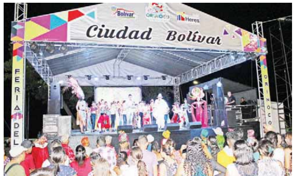
A casa llena Mirador Angostura en el primer día de la Feria del Orinoco 2019