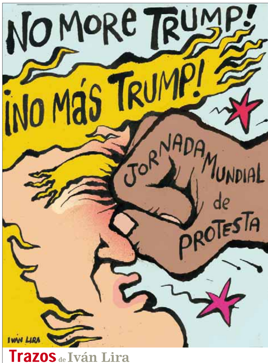
Trazos de Iván Lira