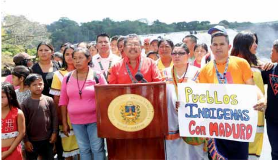
En las calles los indígenas de Guayana exigieron a Trump que derogue todas las sanciones contra Venezuela

T/ Elizabeth Pérez Madriz