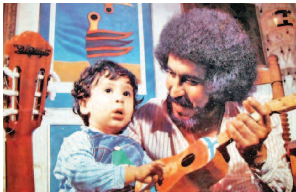
Al evento de apertura estarán invitados los familiares del Cantor del Pueblo

Mendoza informó que el día de la inauguración de la nueva ágora se espera