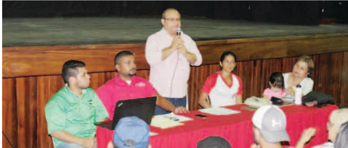
El Programa de Alimentación Escolar está garantizando la alimentación

Mencionó que a través de las Redes de Acción Social (RAS), se promoverán la articulación del poder popular, la militancia