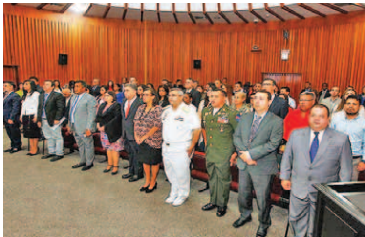
Participantes analizaron los elementos de la guerra multifactorial contra Venezuela

La actividad forma parte de las políticas de capacitación y formación académica de funcionarios y funcionarias judiciales, implementadas por el presidente del máximo tribu-