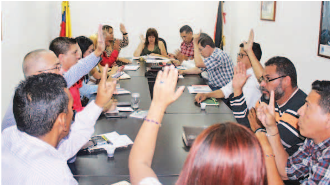
El PAE garantiza el alimento a niños y jóvenes de educación inicial, básica, media y de adultos

Más de 11.000 millones de bolívares aprobó el Consejo Legislativo de Miranda para el PAE, como parte de una política integral de atención y protección alimentaria que lleva a cabo el gobernador Héctor Rodríguez