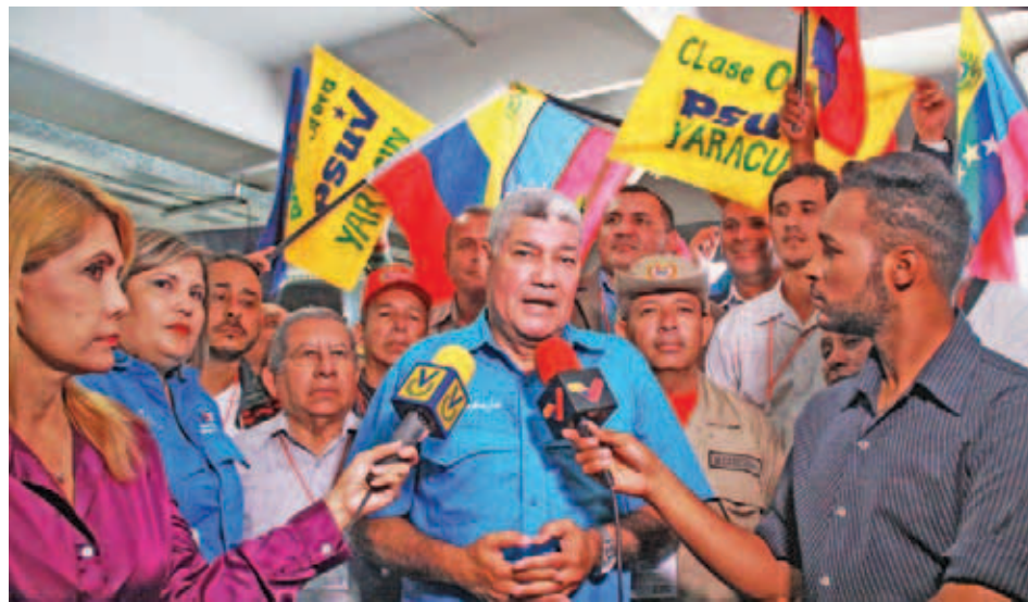
Piñate hizo una disertación muy detallada

En acto realizado en la Escuela de Planificación de La Rinconada, en Caracas, el también profesor de historia y ciencias sociales explicó lo que es un verdadero revolucionario. “Esta re-