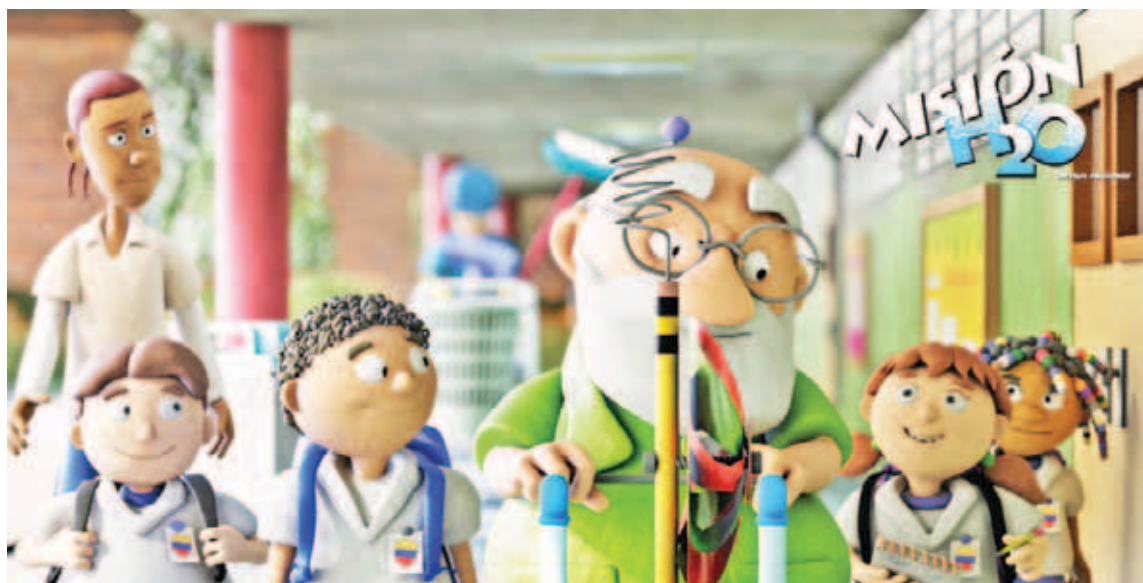
Es la primera obra nacional, larga, hecha con la técnica de animación 3D