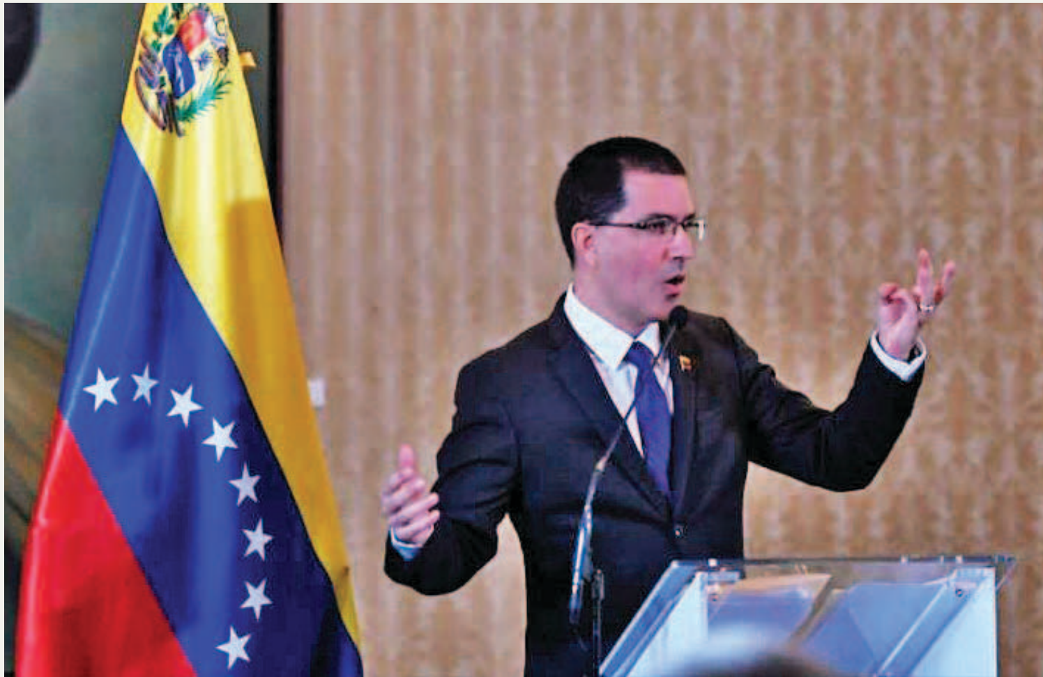
Canciller reafirmó la disposición de mantener la diplomacia de paz entre sus estrategias

El canciller venezolano Jorge Arreaza afirmó que la nación suramericana utilizará todos los medios multilaterales, políticos y económicos, con apego al Derecho internacional