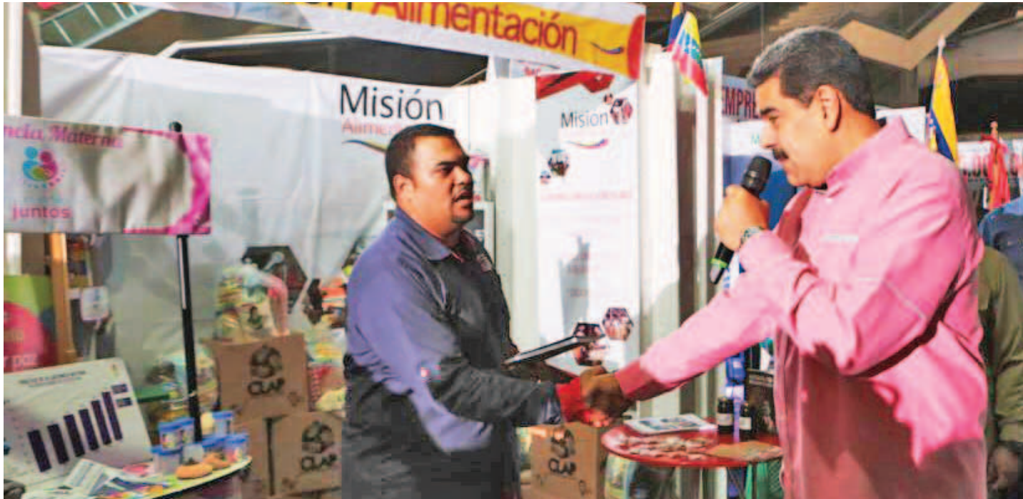
El Jefe del Estado recordó al artista Carlos Cruz-Diez y al prócer José de San Martín

El Mandatario Nacional afirmó que Venezuela se encuentra en un proceso de cambio, renovación y rectificación de todo el sistema que agrupa a estos planes sociales creados en revolución