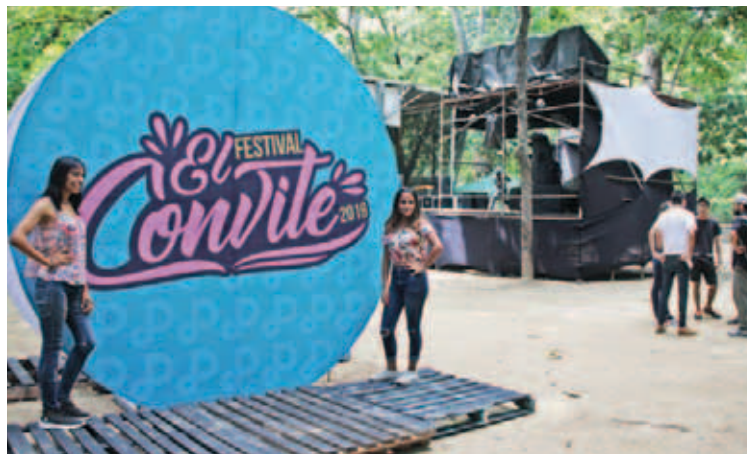
Música para todos los gustos, gastronomía y muchas diversiones en Los Caobos

Afirmó que esperan que asistan más de 60 mil personas, y explicó que eligieron este parque porque ha sido objeto de un proceso de recuperación integral. Godoy invitó al público en general a que no se pierda este evento, “y que apenas culmine nos preparemos para la edición