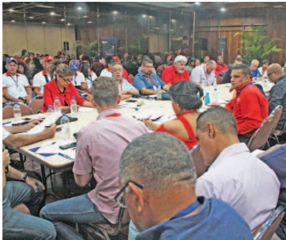
Los invitados llaman a la lucha organizada contra el imperialismo

Para el visitante, Venezuela lidera el llamado a los sectores en los que se agru-