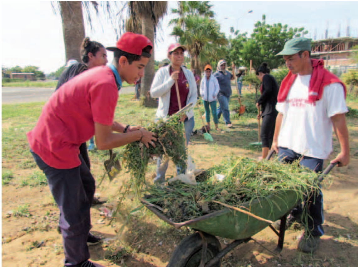
Misión Árbol se encargará de la reforestación del polideportivo

Junto al gobierno regional recuperarán las instalaciones eléctricas y la infraestructura