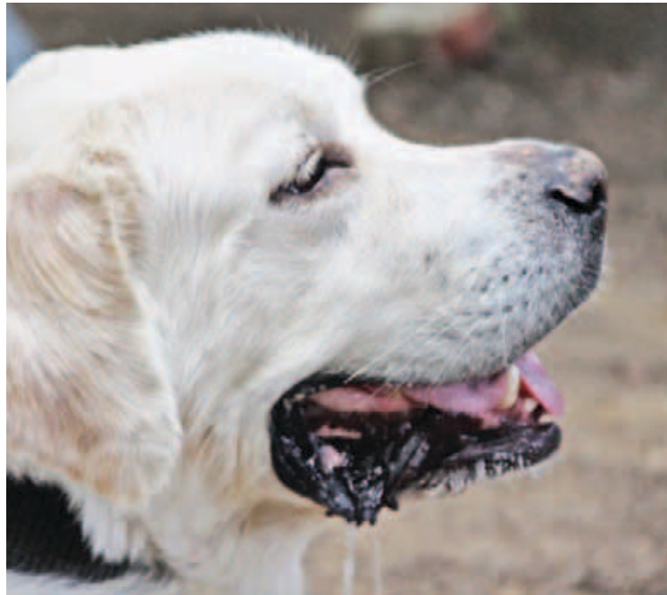
Presentarán a familias que tienen perros Mucuchíes

En el Parque Los Caobos, en un espacio temático dedicado al respeto a los animales integrado al Festival El Convite, los asistentes podrán conocer la historia del perro Nevado, que perteneció al Libertador Simón Bolívar y murió en la Batalla de Carabobo