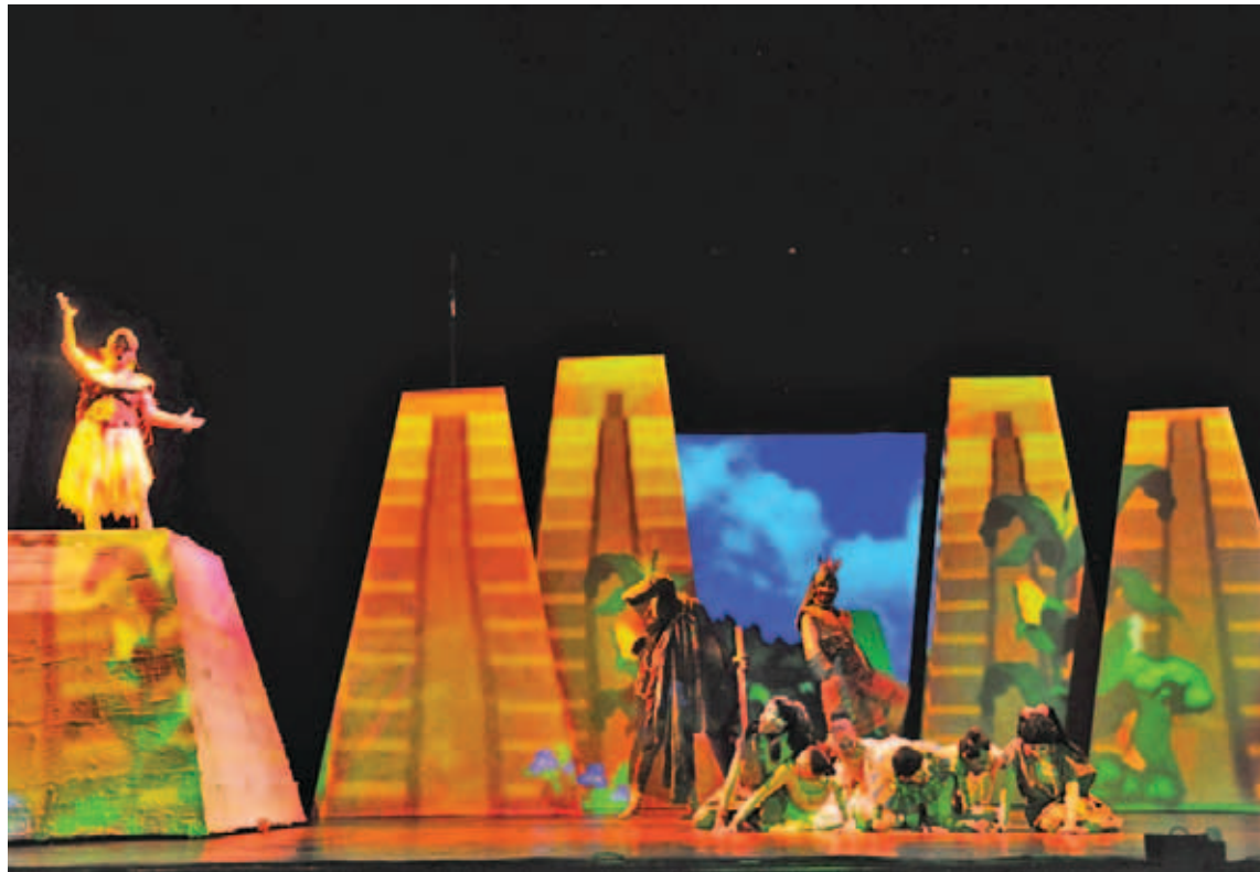
En el Teatro Alberto de Paz y Mateos está la pieza musical Popol Vuh.

• Teatro: En el Teatro Nacional culminará esta sábado y do-