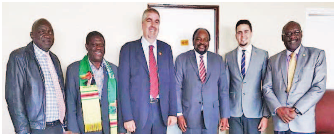
El viceministro expuso la situación política venezolana ocasionada por el bloqueo norteamericano

El viceministro sostuvo encuentros con Winston Chitando, ministro de Desarrollo Minero, Mabel Chinamano, presidenta del Senado, y Simbarashe Mumbengegwi, secretario de Relaciones Internacionales del