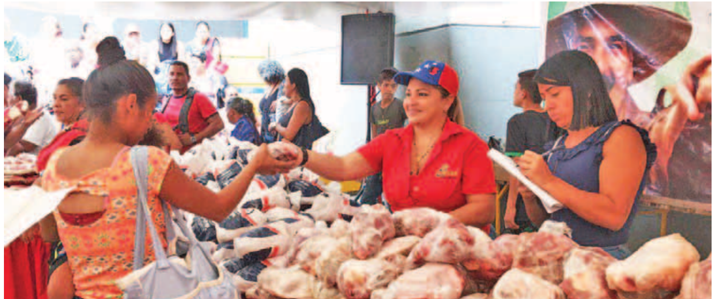
Pollo, huevo, carne, mortadela y pescado fueron algunos de los alimentos distribuidos

Asimismo, la vicepresidenta resaltó que los productos que se ofrecen en estas ferias son de producción nacional, por lo que se fortalece el aparato productivo