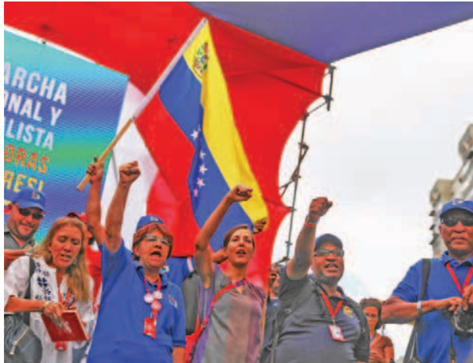
Voceros calificaron el encuentro como un momento histórico para la clase trabajadora