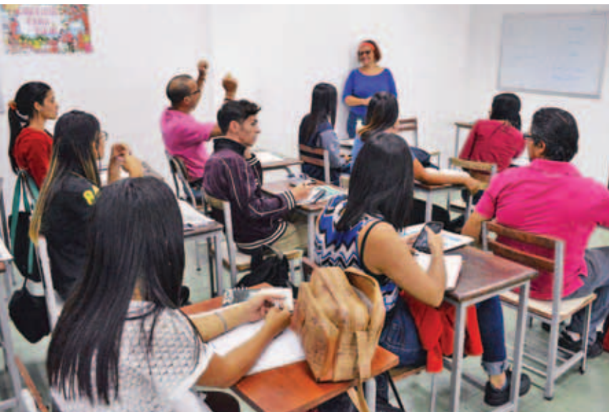
Taller para contar la noticia