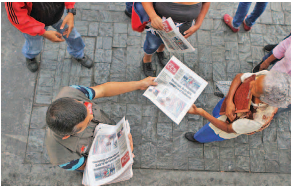
Más de 150 mil ejemplares diarios se llegaron a imprimir

“En el caso nuestro, desde el primer ejemplar decidimos no publicar noticias extraoficiales, esas que llevan el rótulo de supuestamente, se conoció, fuentes dignas de todo crédito. Decidimos no entrar en esa dinámica porque precisamente esa es una de las maneras fáciles de mentir. Por lo general, cuando lanzas una información extraoficial es una noticia falsa, o lo que llaman ahora “fake news”, que es más viejo que María Casta-