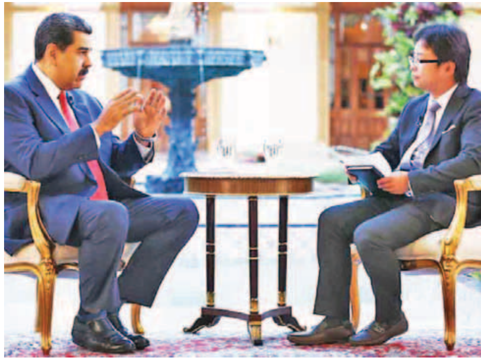
El Jefe del Estado sostuvo que China es un ejemplo para países que han decidido ser libres

La diplomática reveló las reuniones de varias autoridades estadounidenses (el vicepresidente del país, Mike Pence, el asesor de Seguridad Nacional, John