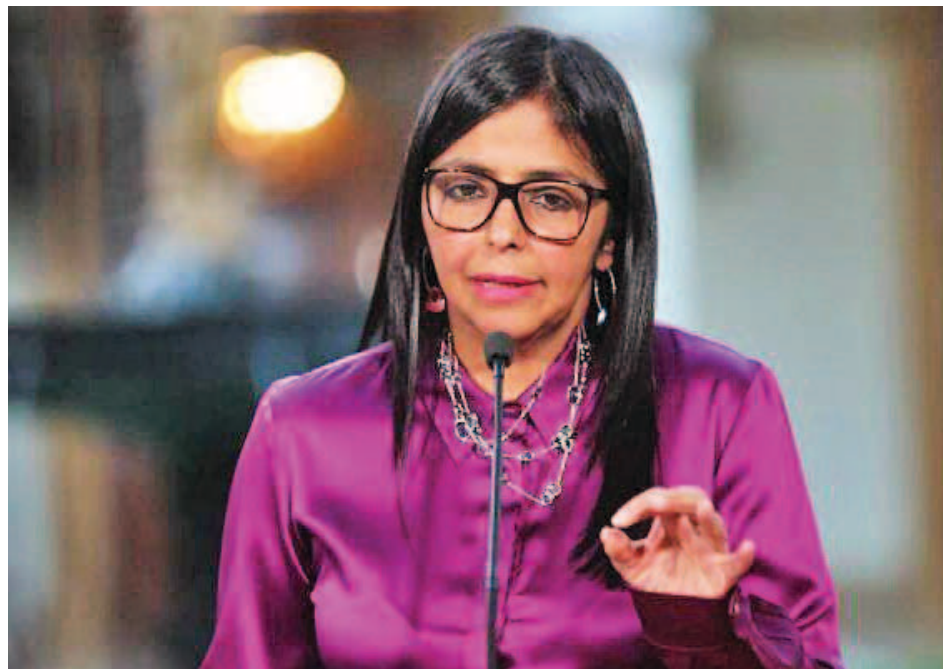
Venezuela alegará violación de la Resolución 1.373 del Consejo de Seguridad de la ONU

La información fue publicada en su cuenta de Twitter luego de las declaraciones ofrecidas por el vicepresidente sectorial de Comunicación, Turismo y Cultura, Jorge Rodríguez, en las cuales mostró pruebas sobre la existencia