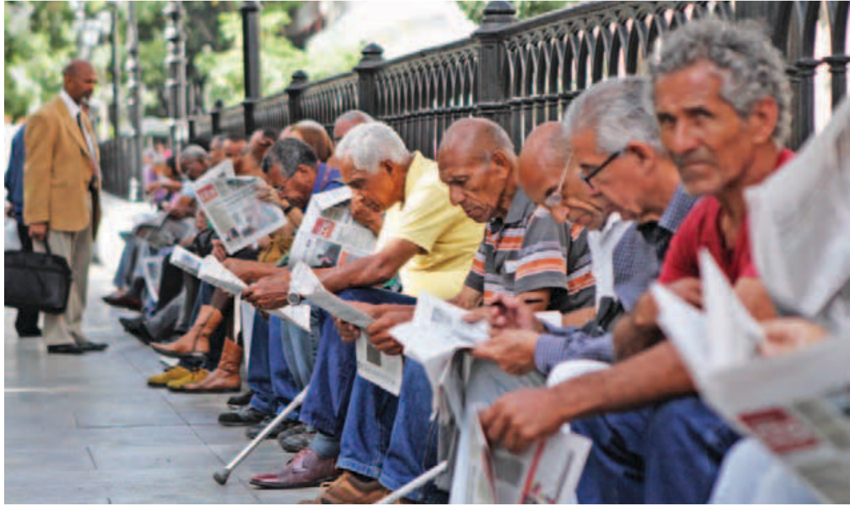
El periódico ha sido una lectura obligada para los caraqueños

La avidez con que los ejemplares eran recibidos a boca de las estaciones del metro, las largas colas en la plaza Bolívar y la afluencia de gente en los puntos de distribución,