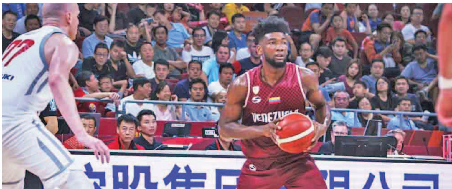
La selección nacional debe centrarse en defender más ante los africanos

Ahora Venezuela tiene 0-13 en partidos oficiales frente a selecciones europeas. Volviendo al careo de este lunes ante Costa de Marfil, el combinado nacional ya ha estudiado al elenco marfileño y conoce las ventajas y desventajas que tienen en