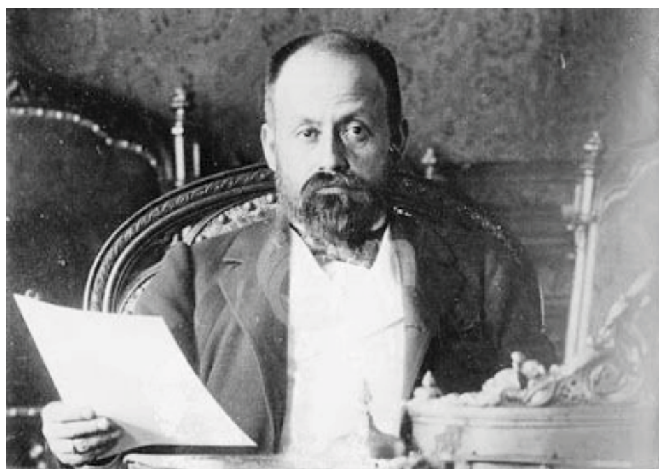
El presidente Cipriano Castro enfrentó el bloqueo naval de 1902-1903 impuesto por Inglaterra, Alemania e Italia

var en un célebre discurso la resolución definitiva de este conflicto en pro de los intereses venezolanos: