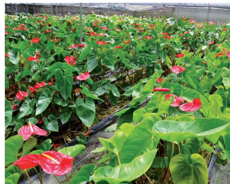
Las flores de Anthurium se producen en suelos mirandinos

En el estand que se ubicará en la feria se podrá apreciar la calidad y la belleza que tienen