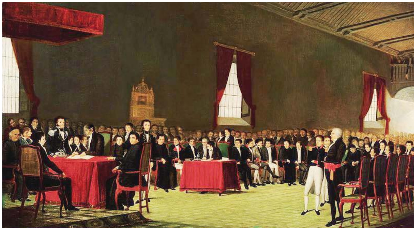
El 5 de julio de 1811 se firma la Declaración de Independencia de Venezuela del Imperio Español (Foto: Pintor Juan Lovera)

Se percibía ya una notable tensión en el proceso para llegar a la Declaración de Independencia en 1810-11 entre aquellos que proponían la libertad temporal como mecanismo de salvaguarda de las propiedades coloniales de Fernando VII. Su propuesta era poder devolver en un tiempo perentorio al Rey sus intereses ultramarinos. Como contra parte, desde la Sociedad Patriótica, ya clamaba Bolí-