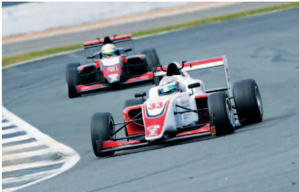
El piloto ha tenido una buena zafra en los motores este 2019