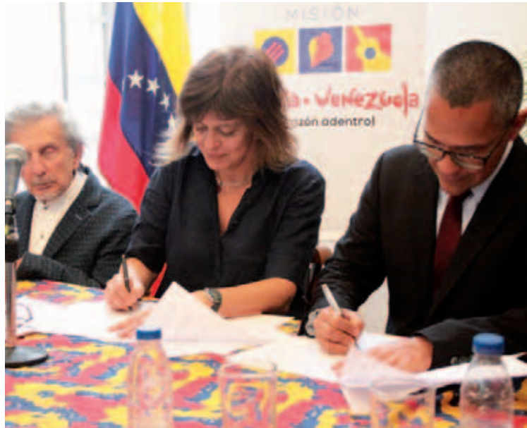
La cultura venezolana realiza importantes alianzas