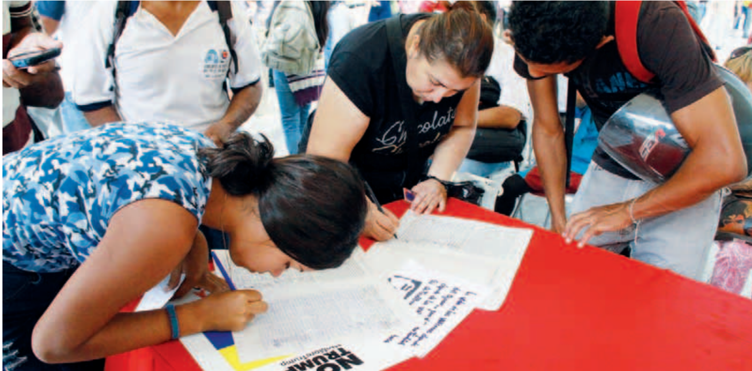
Llueva, trueno o relampaguee, el pueblo se moviliza para participar en la campaña

Desde todos los rincones del país y otras partes del mundo, se suman a la lucha contra el bloqueo y las sanciones estadounidense a los venezolanos