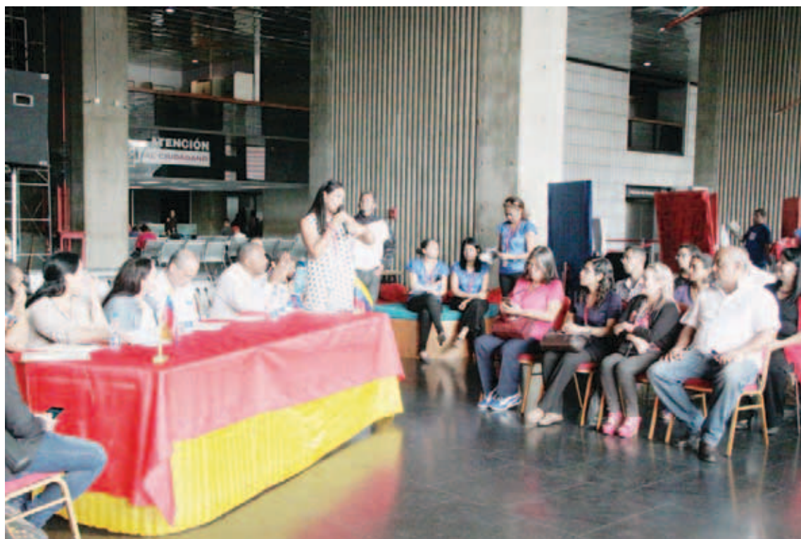
Inicia Plan de Masificación de las Artes y la Cultura por la Paz

En la cita participaron delegaciones del Movimiento César Rengifo, Fundamusical, Corazón Llanero, Corazón Salsero y Corazón Urbano, al igual que representantes de la Misión Cultura Corazón Adentro y de los gabinetes culturales de todas las regiones, quienes en mesa de trabajo organizaron