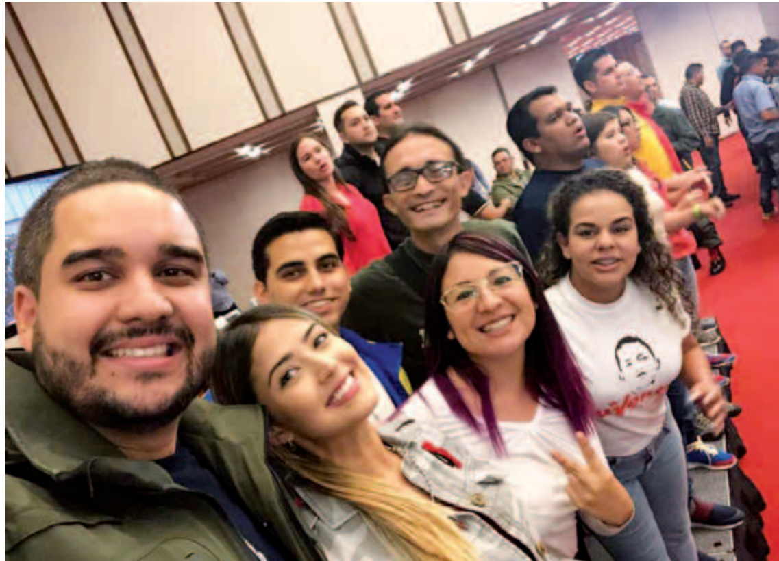
Jpsuv está activa para ganar espacios, producir y defender la patria

La Juventud del Partido Socialista Unido de Venezuela (Jpsuv), juramentó todos sus equipos políticos de las 22 parroquias de Caracas y 11 de La Guaira, cuya acción inmediata es visitar las comunidades y las calles de Venezuela, con la finalidad de consolidar desde la base la estructura organizativa de los jóvenes revolucionarios.