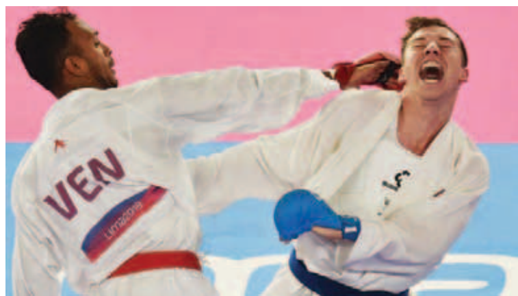
Madera buscará estar en el podio.