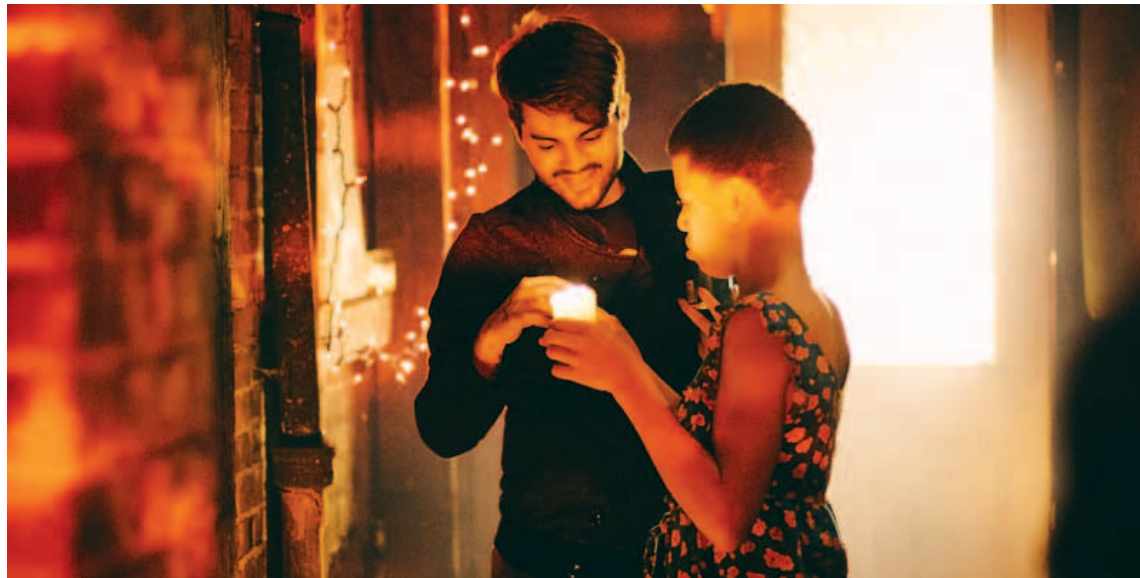
La cinta está inspirada en piezas teatrales muy conocidas

La cinta se desarrolla en Nueva York, Estados Unidos, donde un joven detective de la policía sigue la pista en un