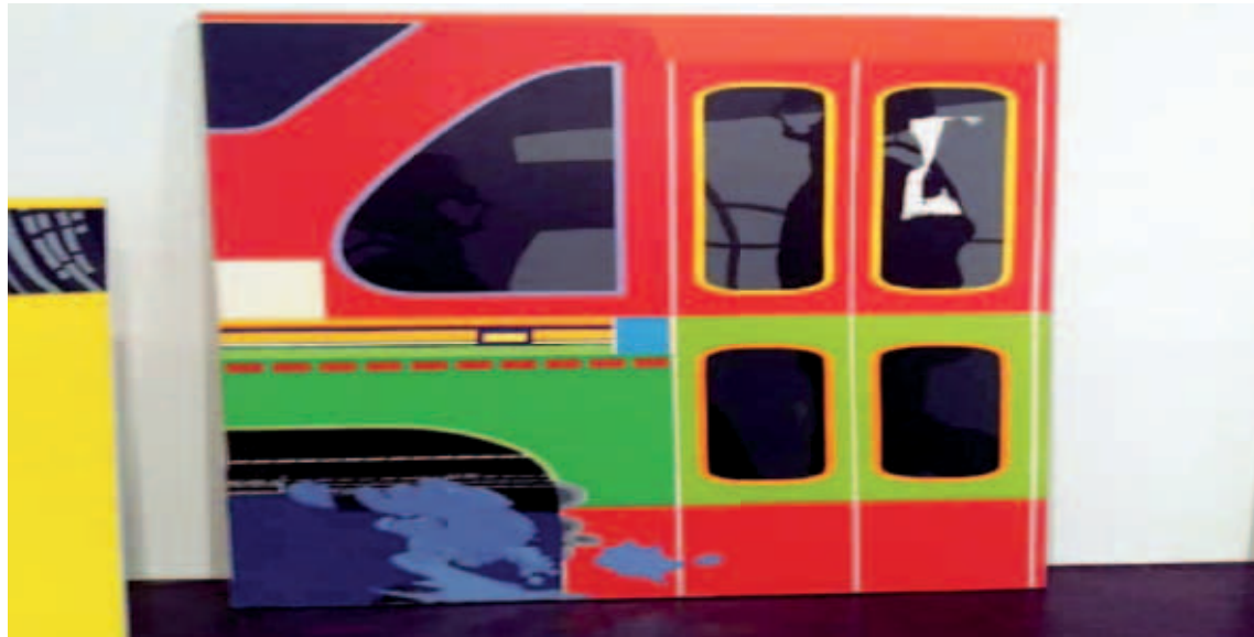
Piezas inéditas del artista se podrán apreciar en la muestra

La actividad se iniciará con un recorrido cronológico donde se identificarán las etapas