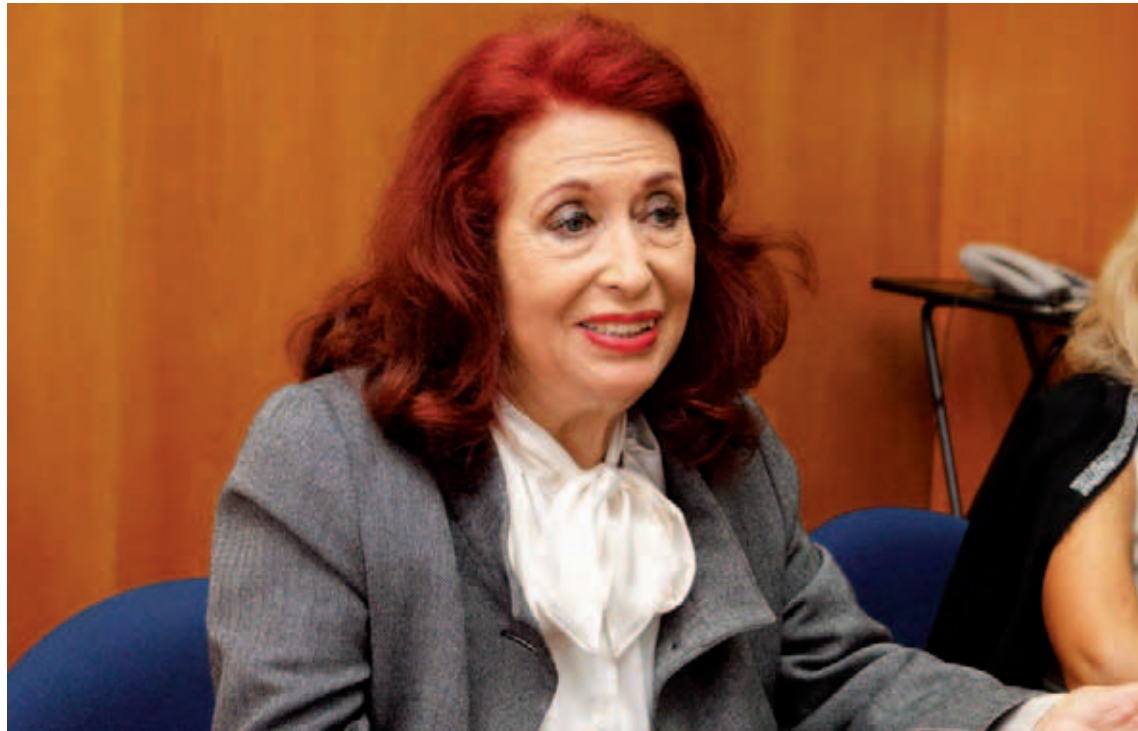
Es alto el número de mujeres asesinadas en España

T/ Agencia de Noticias