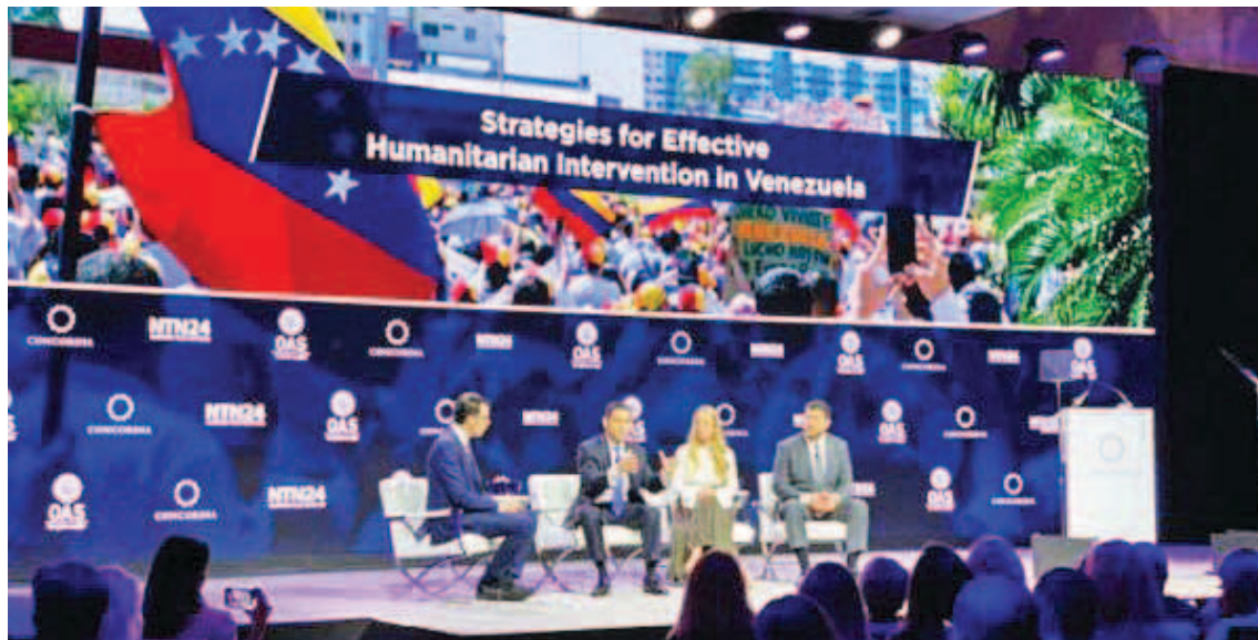
COSI afirma que llevaron esa misma denuncia a la sede de la ONU en Ginebra

El Comité de Solidaridad Internacional (COSI) reiteró ayer su solicitud de una investigación exhaustiva sobre el uso de mercenarios en Venezuela ante el Consejo de Derechos Humanos de la Organización de Naciones Unidas (ONU), tras las declaraciones públicas