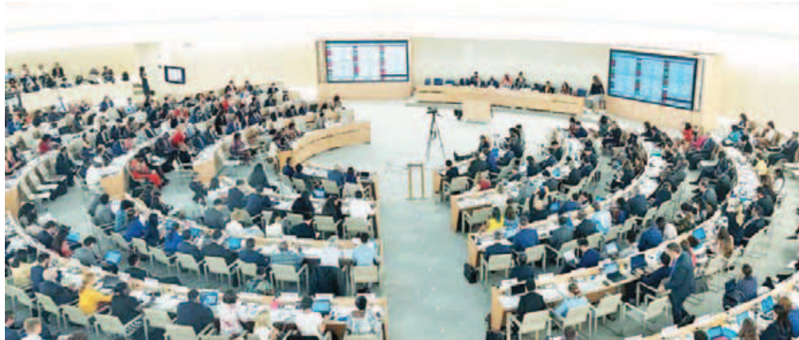
La resolución aboga por la solución pacífica, democrática y constitucional a la situación de Venezuela

El canciller de la República Bolivariana de Venezuela, Jorge Arreaza, en su cuenta de Twitter, destacó que es la pri-