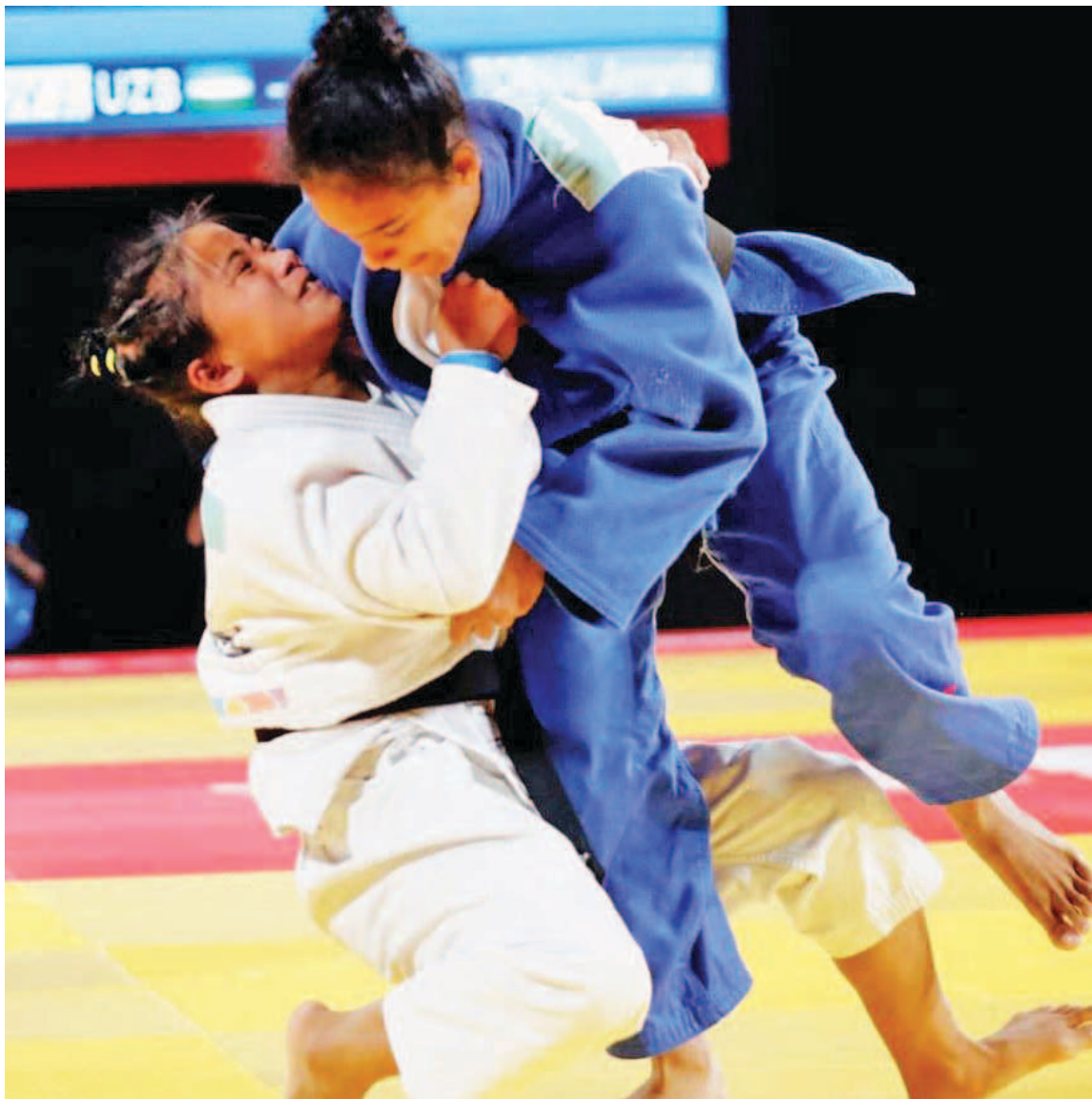
La deportista se fajó en los 44 kilos

En su segunda puesta en escena sobre el tatami, Giménez protagonizó un combate con similar tiempo de duración, poco más de tres minutos, donde se impuso igualmente por ippon ante la representante de Bulgaria, Anastasiia Balaban.