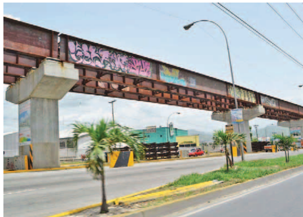
Retomarán construcción del Metro hacia Guarenas

Agregó el ministro que las mesas de trabajo establecerán cuáles serán las obras que se ejecutarán en una primera etapa, pero que adicionalmente