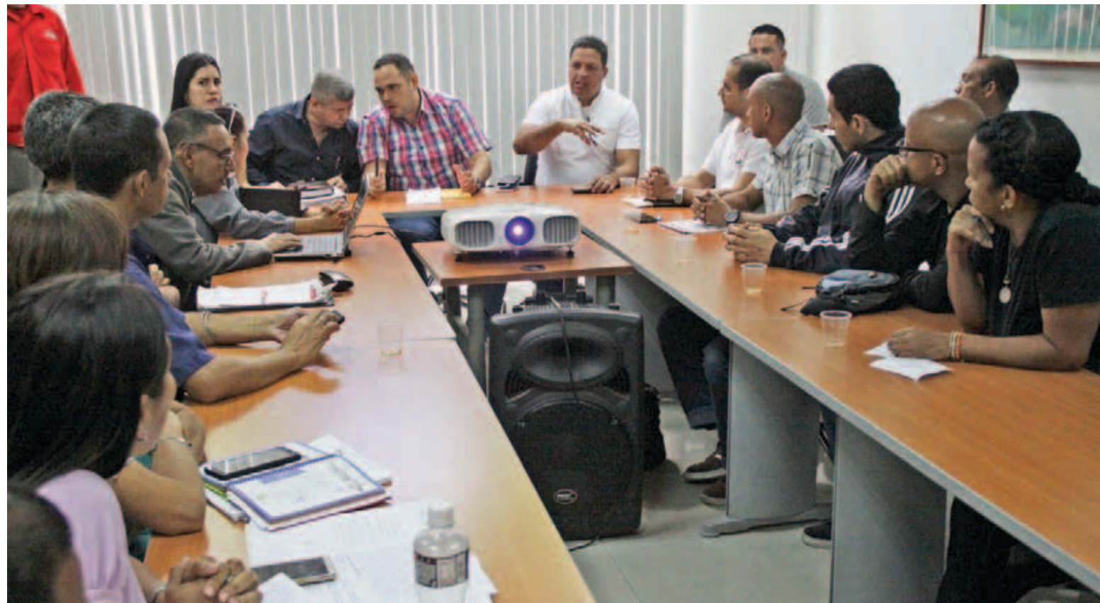
Las comisiones de trabajo evalúan reactivación de las obras paralizadas

La decisión de dar por concluidos los contratos con Odebrecht la tomó el presidente Nicolás Maduro hace varias