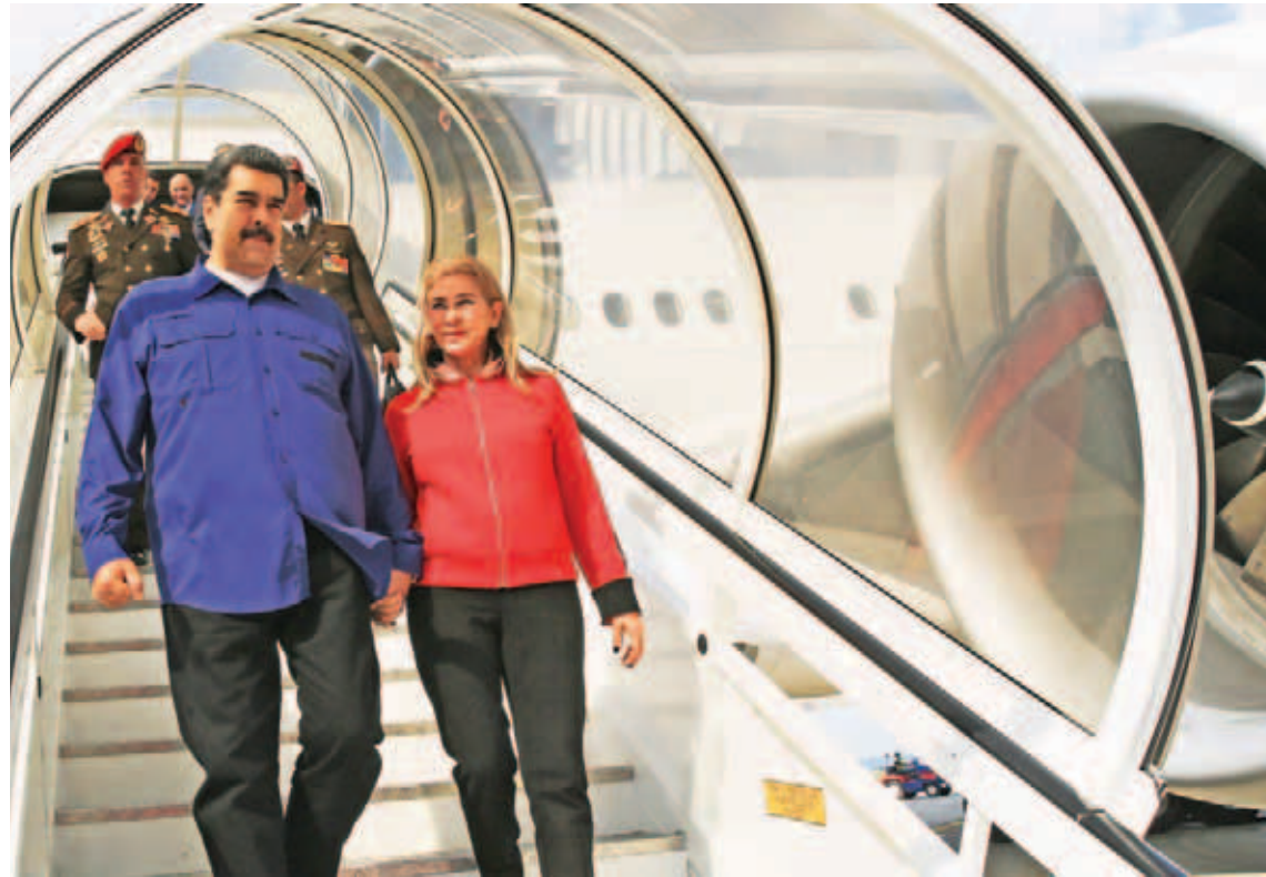
Maduro asegura a su par ruso que “todas las puertas están abiertas” para el diálogo con la oposición

“Hemos acordado un nuevo mapa de cooperación que pone su acento en el desarrollo económico, en la transferencia de tecnología, en el desarrollo industrial y en la llegada de nuevas inversiones al país, ne-