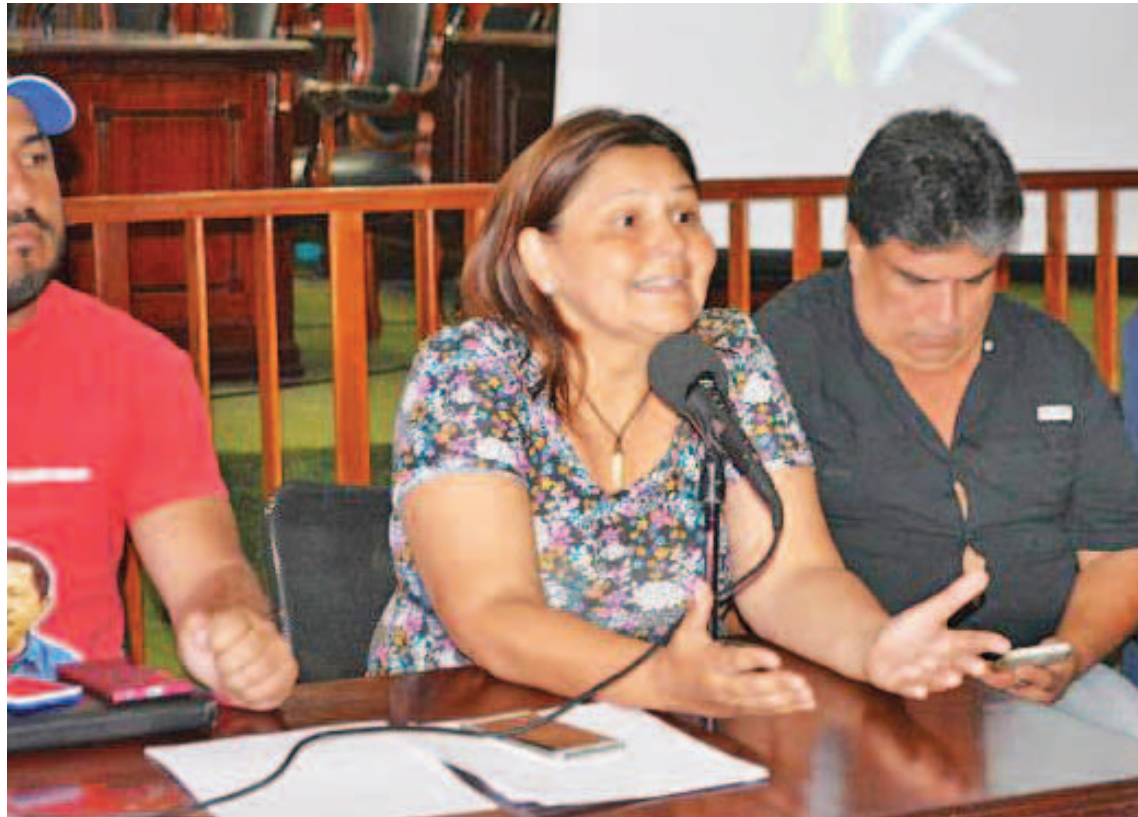
Aseguraron que Colombia juega a la desestabilización de Venezuela

Durante su programa en RNV Región Central , la militante del Partido Socialista Unido de Venezuela aplaudió la intervención de Delcy Rodríguez, quien ofreció datos concretos