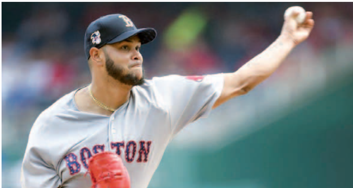
E-Rod se creció en medio del caos de los patirrojitos

Lo que evitó que Rodríguez (19-6, 3.81 EFE) se uniera a