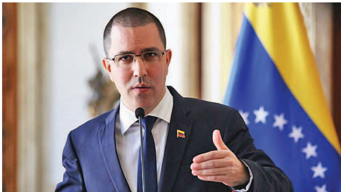
El canciller aseguró que serán defendidos los derechos humanos de venezolanos en Perú

En un mensaje publicado en Twitter, Arreaza manifestó que el personal diplomático defenderá los derechos humanos de