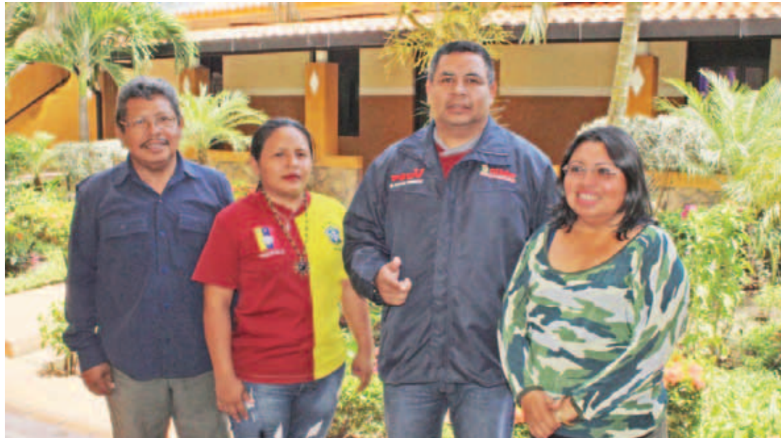
Agradecen al presidente Nicolás Maduro el reconocimiento de los idiomas indígenas de forma legal

T/ Leida Medina Ferrer F/ Prensa PSUV-Bolívar Caracas