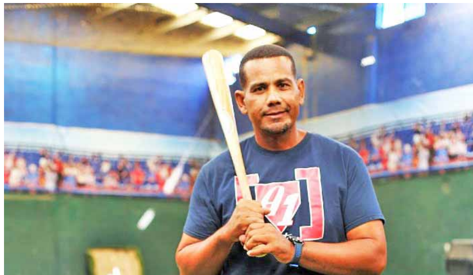
Guánchez jugó seis zafras en la LVBP

Guánchez se desempeñó como mánager y coach de bateo del equipo Caracas en la extinta Liga de Desarrollo. Como jugador activo disputó seis temporadas en la LVBP con los uniformes de Magallanes y La Guaira. Además ha trabaja-