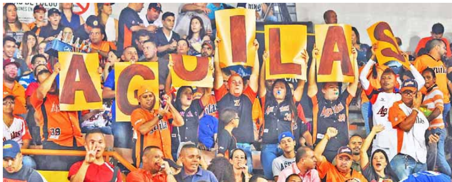
La fanaticada ha sido fiel y entusiasta durante este medio siglo.

Seis títulos y dos Series del Caribe tiene este equipo en su vitrina