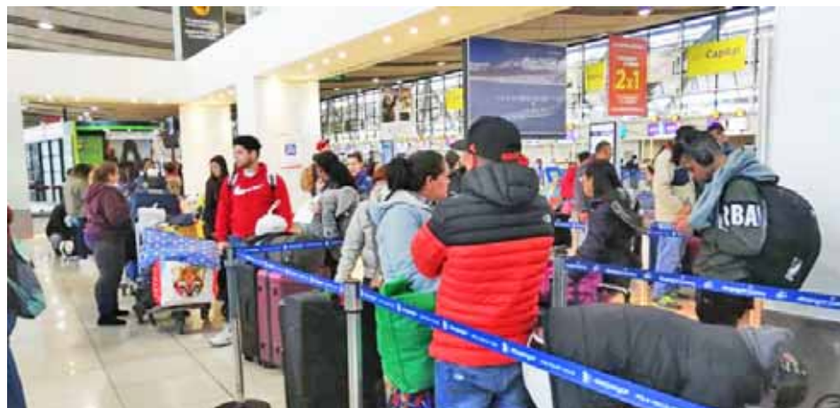
La Cancillería destaca la alegría expresada por los venezolanos que retornan al país

Este es el segundo vuelo proveniente de Chile organizado por el Plan Vuelta a la Patria en menos de una semana. En la oportunidad anterior, el grupo estuvo integrado por abogados, médicos, administradores, periodistas y otros profesionales venezolanos que decidieron retornaron luego de, según sus testimonios,