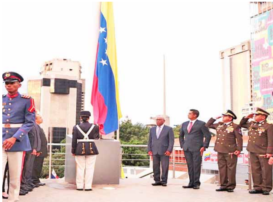
Hace 16 años se creó la Misión Guaicaipuro para garantizar los derechos humanos del pueblo indígena

“La Constitución de 1999 reconoce a la sociedad venezolana como una sociedad democrática, participativa, protagónica y reconoce la diversidad étnica y cultural de nuestro pueblo. El comandante Hugo Chávez decretó el 10 de octubre de 2002 el cambio de la indigna definición del Día de la Raza a Día de la Resistencia