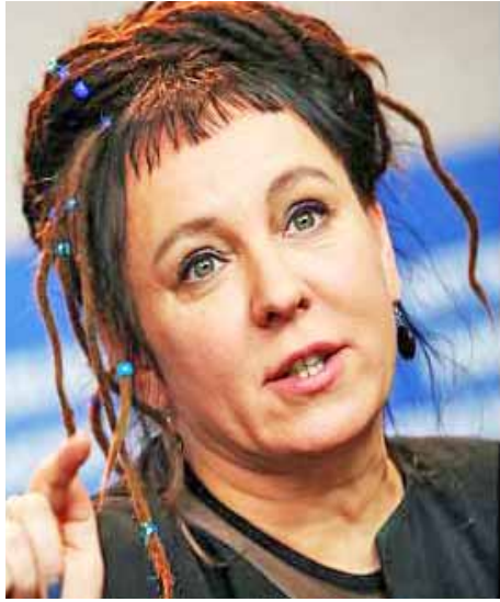
El premio se entregará el 10 de diciembre