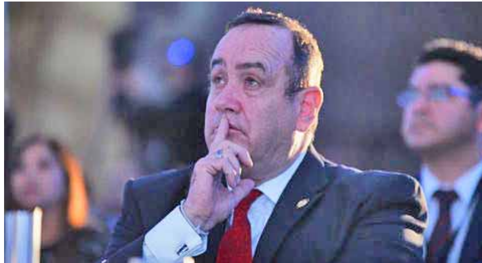
Venezuela exhorta a mantener relaciones de respeto entre Estados y dentro del Derecho internacional

T/ Romer Viera Rivas Caracas