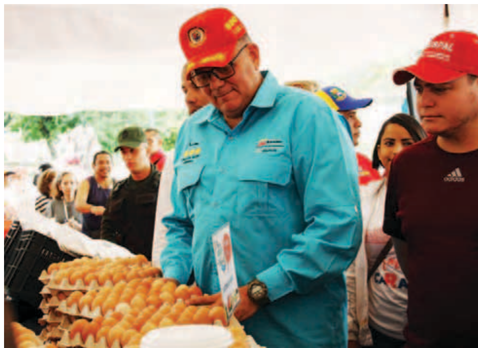
Todos los productos se venden a precios solidarios

Así lo informó el ministro del Poder Popular para la Alimentación, Carlos Leal Tellería, quien señaló que el Plan Nacional de Proteínas complementa el programa alimentario de los Comités