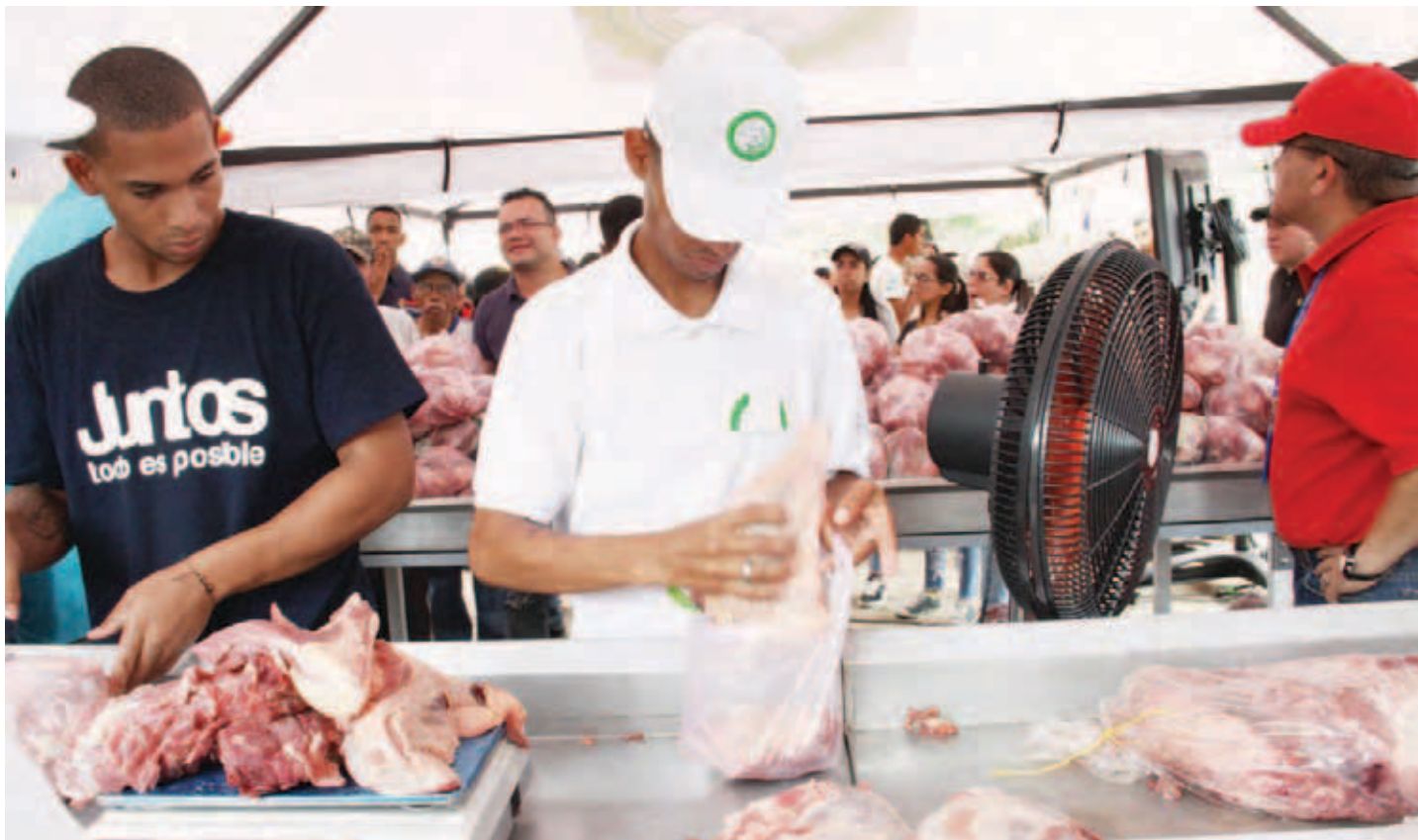
Los alimentos proteico son de producción nacional

En el país ayer se realizaron 509 Ferias del Campo Soberano, que distribuyeron 3.100 toneladas de alimentos y atendieron a más de 500 mil familias, “en medio de esta guerra criminal, en medio de un bloqueo que pretende quitar los alimentos al pueblo”, destacó el ministro de Alimentación, Carlos Leal Tellería