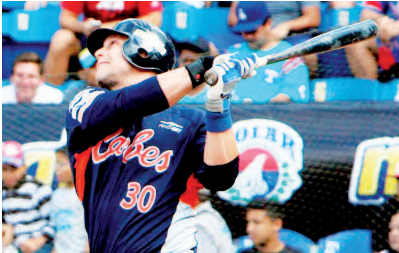
Melián jugó ocho temporadas en la choza

Será el décimo tercer criollo en dirigir los indígenas