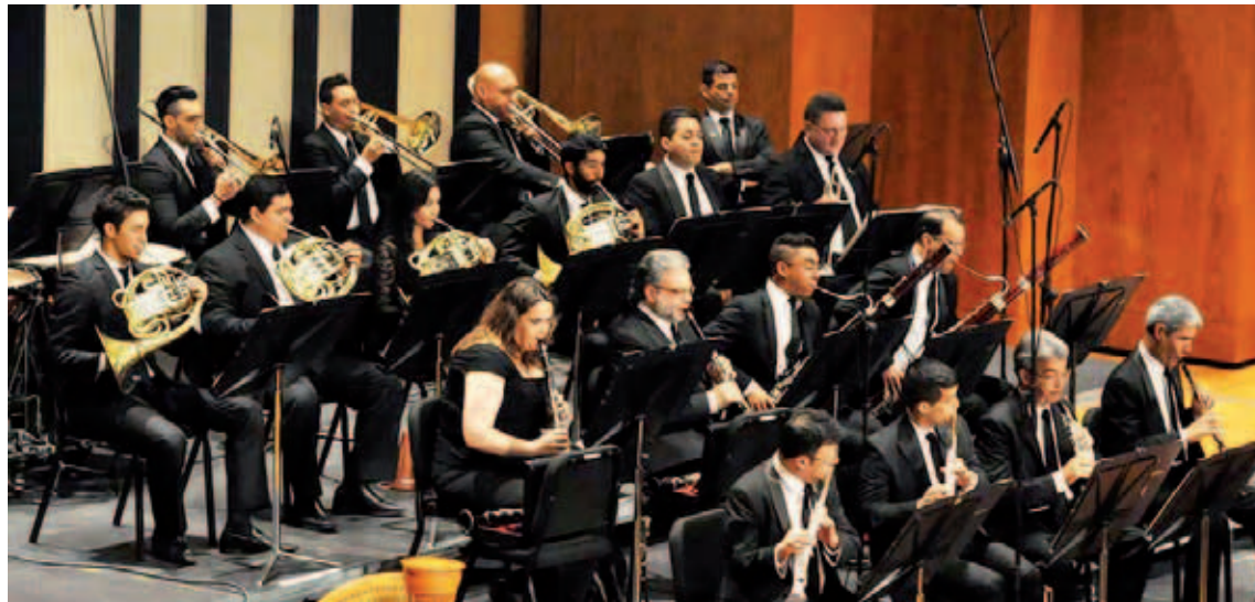
La OSV toca música de todos los géneros

El concierto Rock & Prog será en el Aula Magna de la Universidad Central de Venezuela (UCV), en Caracas, el domingo 3 de noviembre desde las 11 de