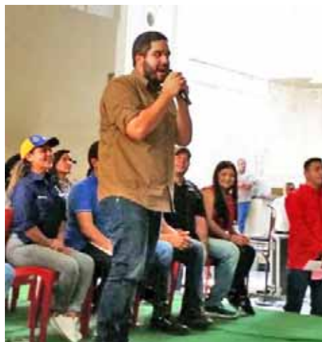
En encuentro con la Jpsuv de Guárico