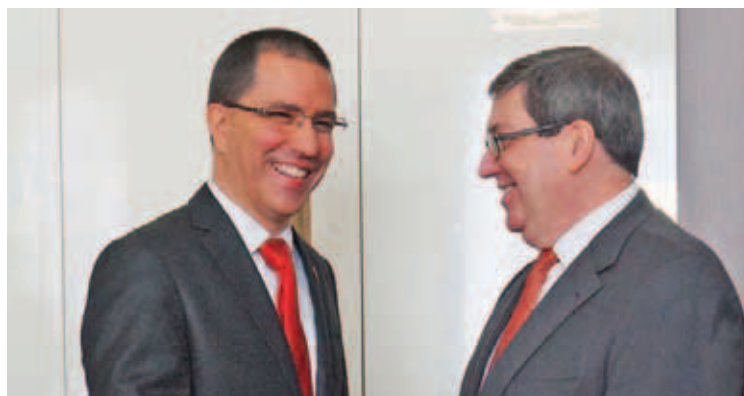
Venezuela y Cuba analizan mecanismos para la protección de sus pueblos

“Washington no cesa en su empeño de intervenir en los