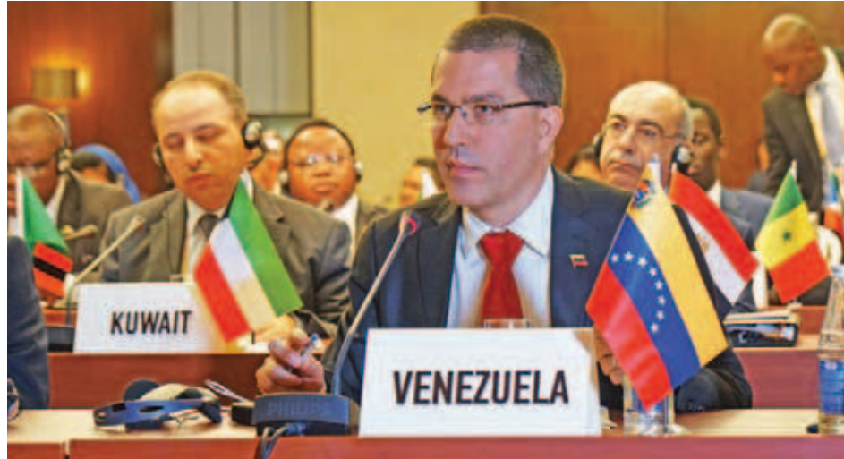
Jorge Arreaza juzgó necesario el fortalecimiento de la cooperación Sur-Sur

Durante su discurso en la reunión preparatoria de ministros de Relaciones Exteriores para la XVIII Cumbre de Jefes de Estado y de Gobierno del Mnoal, que se realiza en Bakú, Azerbaiyán, el can-