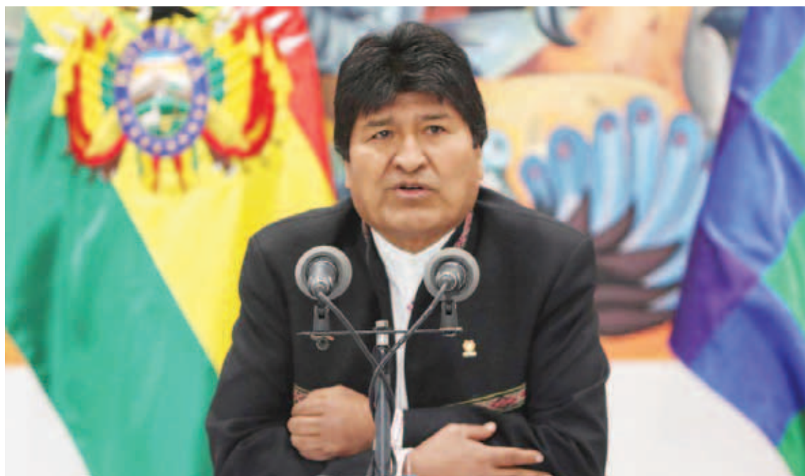
El Mandatario instó a sus seguidores a mantenerse en “estado de emergencia”

El Mandatario compareció este miércoles ante los medios tras los comicios celebrados en el país el pasado domingo. En el encuentro acusó a los opositores de obstaculizar el conteo de los votos con ataques