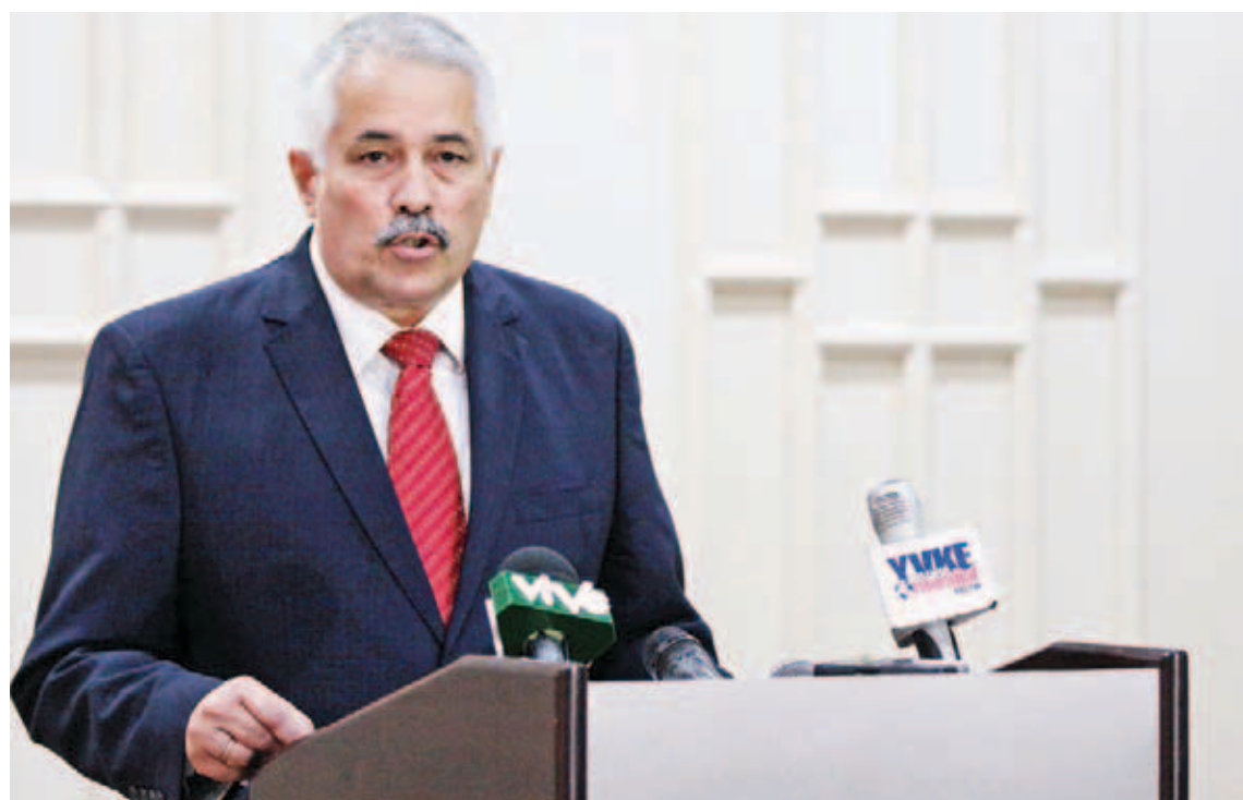
Dagoberto Rodríguez Barrera, embajador cubano en Venezuela

Estados Unidos contra Cuba por casi seis décadas es el sistema de sanciones unilaterales más injusto, severo y prolongado que se ha aplicado contra país alguno. Constituye el principal obstáculo para el desarrollo de la isla y para la implementación de la