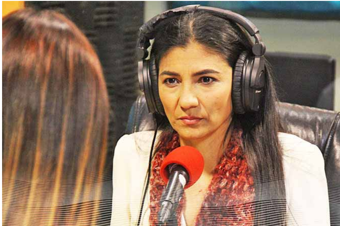
Estamos proponiendo e impulsado el tema de la titularidad conjunta”, expresó Maccarri

El Congreso Nacional Campesino y Pescador de Venezuela 2019 abordará cinco ejes temáticos centrales: político organizativo, económico-productivo, seguridad jurídica y social de los campesinos y legislativo para proponer leyes a la Asamblea Nacional Constituyente.