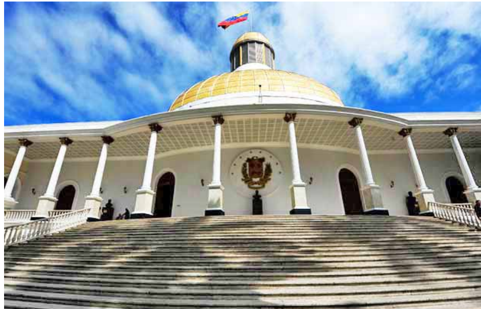
Las nuevas autoridades del CNE solo pueden ser designadas por la Mesa de Diálogo Nacional