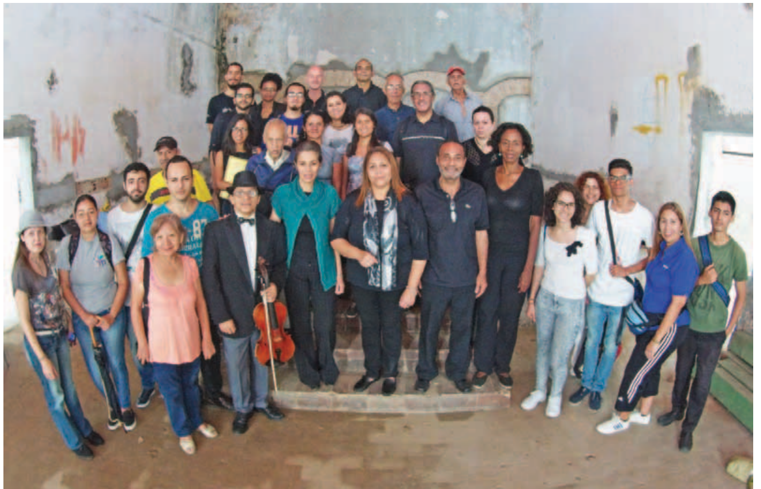
Alumnos y profesores de la Escuela José Ángel Lamas

“En este momento no hemos iniciado las clases debido a que la sede aliada, donde desarrollamos las actividades académicas, está sin aire acondicionado. Nosotros impartimos clases en un sótano de la Biblioteca Nacional, ubicada en el Foro Libertador. La Biblioteca, que depende del Ministerio de Cultura, ha sido nuestra aliada, con el Ministerio de Educación. Nos ha servido como sede, pero están sin aire acondicionado y no podemos realizar nuestras actividades normales. No hemos comenzado las actividades. Estamos celebrando, pero todavía no hemos dado la primera clase