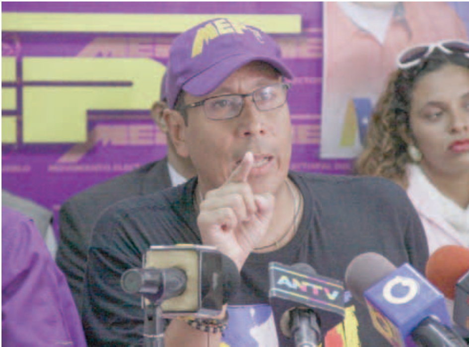
El MEP considera que debe haber “eficiencia o nada”