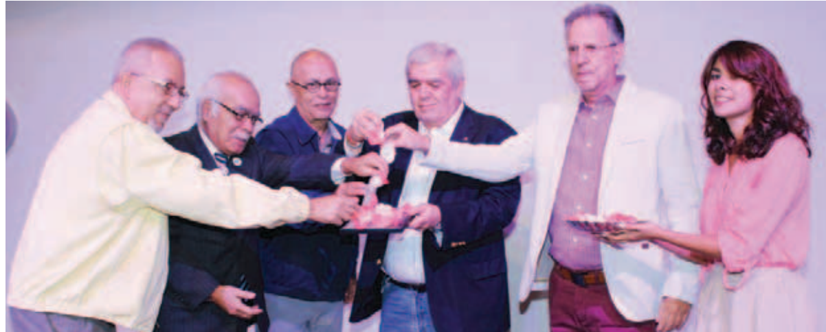
Los autores y personalidades durante el bautizo

Son más de 400 páginas, que cuentan las alegrías, penurias y chismes del equipo escualo