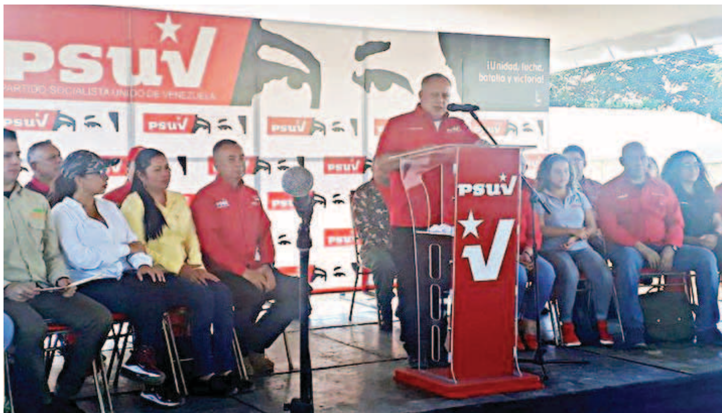
Triunfa en Argentina la fuerza liberadora de un pueblo, afirmó Cabello

Sobre las protestas que se han producido en varios países en América Latina, el dirigente expresó que el PSUV reconoce la lucha de los pueblos contra el neoliberalismo y el capitalismo, “y contra los presidentes que han estado al servicio de Estados Unidos en vez de sus pueblos”