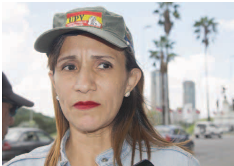
La UPV pide mano dura contra la especulación

Por su parte la dirigencia del PCV participará este jueves 31 de octubre en una movilización desde el Ministerio Público, frente a Parque Carabobo, en Caracas, y que comenzará a las nueve de la mañana, para solicitar que se vuelvan a implementar los precios regulados y se luche contra la especulación, entre otros objetivos.