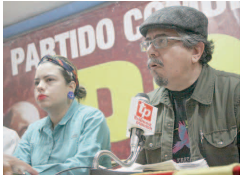
El PCV pide más participación del pueblo revolucionario

También reclaman la dolarización, corrupción e ineficacia de algunos organismos públicos