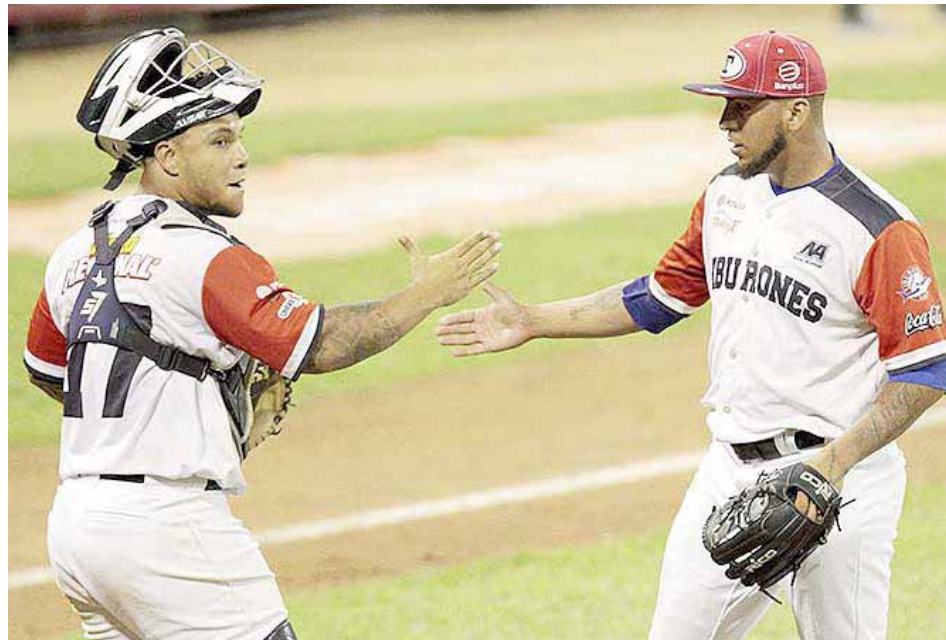
El cuerpo de pitcheo salado cuenta con muchos veteranos

Sin embargo, Apodaca no esperó mucho para colocarse el uniforme