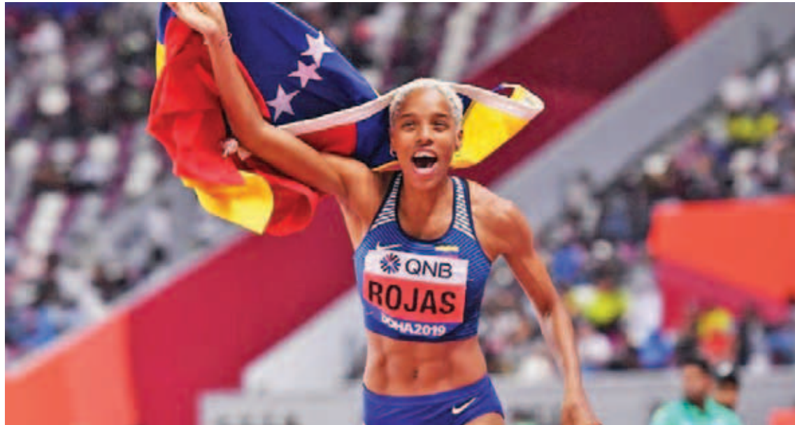
Yulimar apunta hacia los 16 metros en salto triple

Así lo informó el Instituto Nacional del Deporte en su cuenta en Twitter. Después de competir por cuarta vez en unos Panamericanos el pasado mes de julio en Perú, el venezolano Rubén Limardo ya acumula cuatro medallas de oro en el evento deportivo más importante de América. Compitió por primera vez en los Juegos Panamericanos en Río de Janeiro en 2007, y desde entonces ha gana-