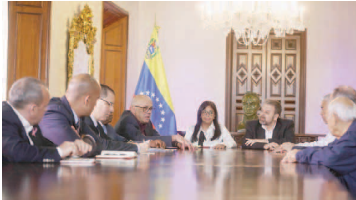
El comunicado desconoce los logros alcanzados

T/ Leida Medina Ferrer