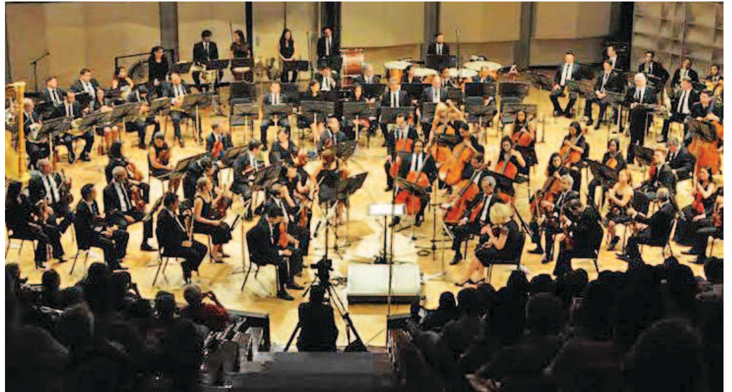
La OSV toca música de todos los géneros

Las bandas abandonaron la duración corta del sencillo pop (de dos a tres minutos) en favor de técnicas de instrumentación y de composición más frecuentemente asociadas con el jazz o la música